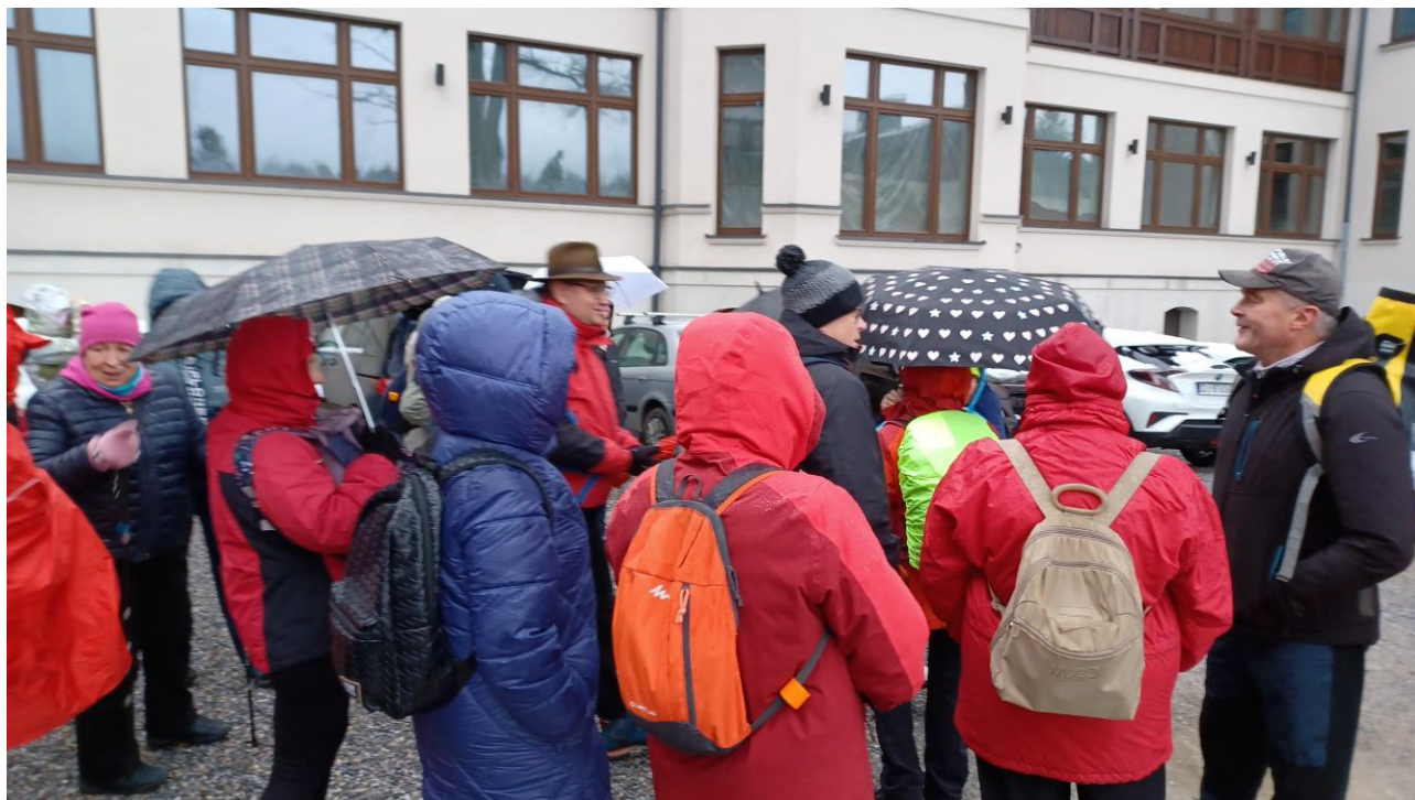
Pora ruszać w drogę.