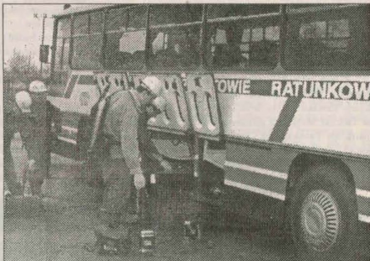
Ten autobus powstał na specjalne zamówienie ratowników.