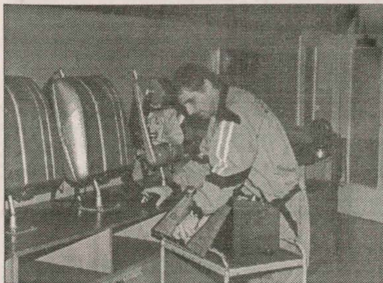
Aparaty tlenowe należy bezustannie sprawdzać.