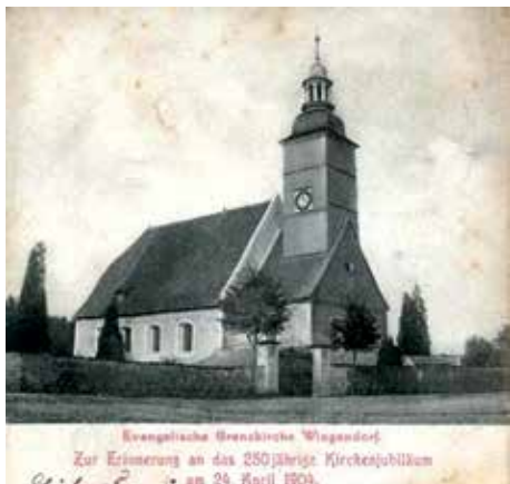
Kościół graniczny w Jałowcu (obecnie po kościele pozostały ruiny)

„Żadne źdźbło więcej na polu nie stało. Henryków (czyt. dobra henrykowskie - przyp. red.) w 1642 roku był zrabowany,