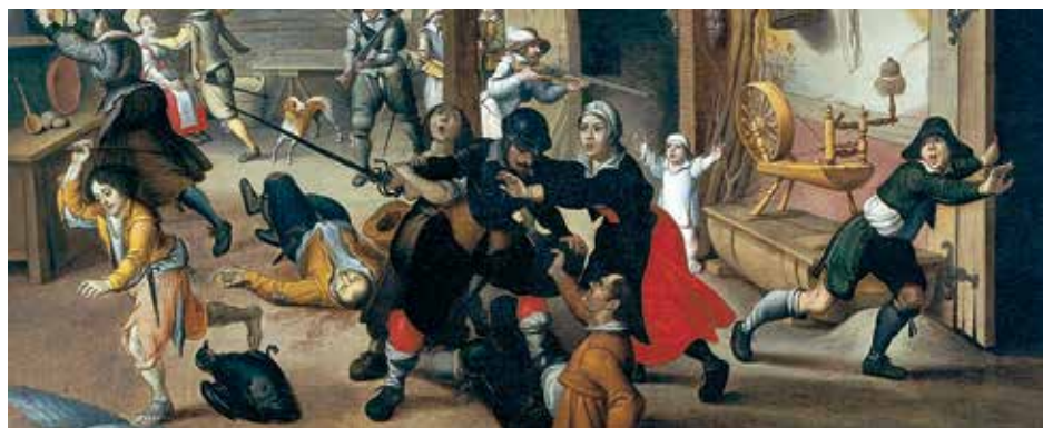
Wojna trzydziestoletnia. Żołnierze podczas plądrowania domów. Obraz Sebastiaena Vrancxa z 1620 r.

a ludzie umierali z głodu. Kiedy to pójdzie tak dalej pójdziemy wszyscy na dno. Podani uciekają, nie ma dochodów, od dwóch lat nie otrzymujemy daniny i ziarna od poddanych. Tego tygodnia zabrano bydło ze wszystkich wsi, a ludzi mordowano”.