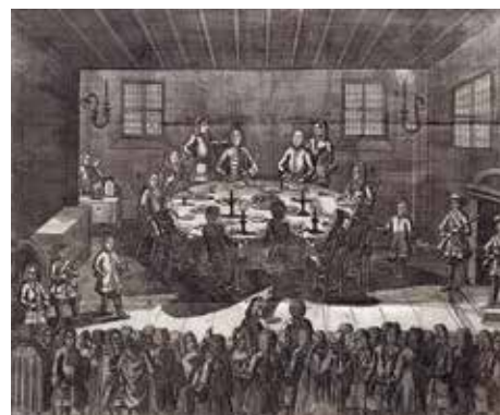
Pokój w Altranstädt (Saksonia)

Od zakończenia działań wojennych, Luteranie zamieszkujący Śląsk na pograniczu Kwisy zostali pozbawieni swobody wyznaniowej, wobec czego zmuszeni byli do odwiedzania kościołów granicznych w Biedrzychowicach, Dolnej Wieży koło Gryfowa Śl. i w Jałowcu (patrz foto), gdzie odprawiano dla nich nabożeństwa połączone z naukami. Za udział w nich groziły wysokie grzywny, ale mimo to nie odstraszały one olszyńskich protestantów. O tym jak wówczas represjonowano protestantów