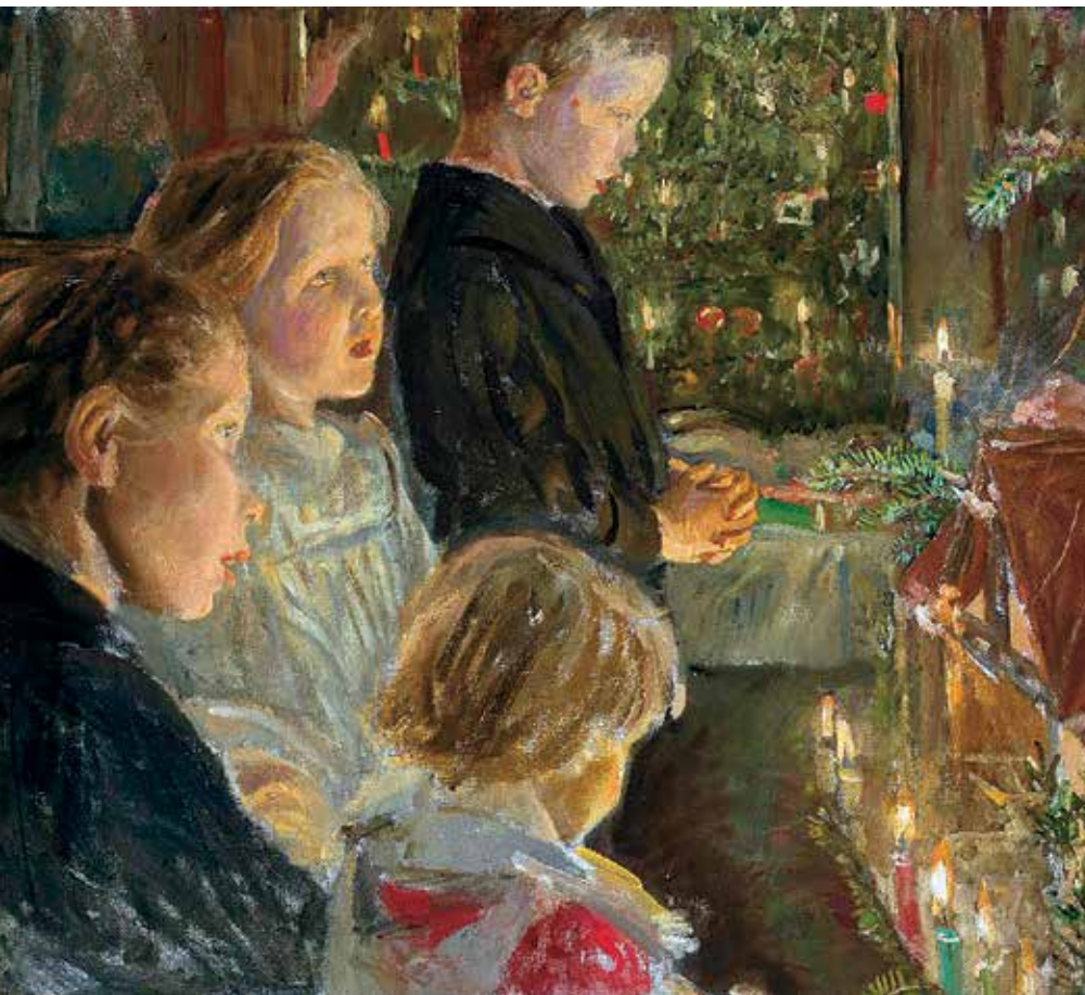
Leopold Kalckreuth, Dzieci przy choince, I poł. XX w., Muzeum Narodowe w Warszawie, licencja CC-BY, źródło: Cyfrowe MNW

Prezenty pod choinką to zwyczaj naszych czasów. W XIX wieku tylko w niektórych regionach dawano dzieciom drobne upominki – chłopcom scyzoryki i koziki, a dziewczętom wstążki i koraliki.