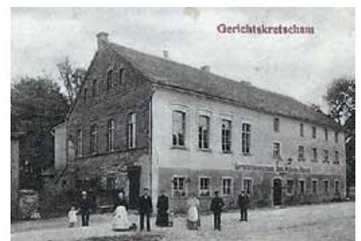
Karczma Sądowa Jeschego (przy ul. Wolności - do końca lat 90 XX w. znajdowało się tutaj kino)