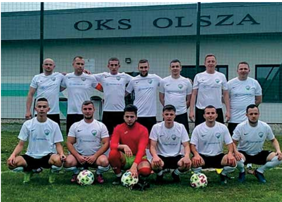
Piłkarze Olszy Olszyna w nowych strojach