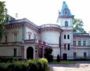
Powiatowe Centrum Edukacyjne w Lubaniu

Uczniowie szkół podstawowych z terenu Powiatu Lubańskiego mieli możliwość sprawdzenia swoich umiejętności języ-