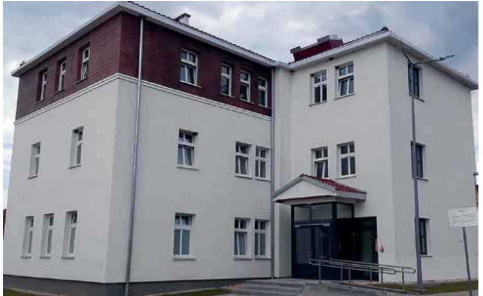
Nowy Ośrodek Gminnej Służby Zdrowia w Olszynie