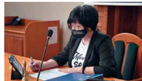
Przewodnicząca Rady Powiatu Lubańskiego podczas prowadzenia obrad online