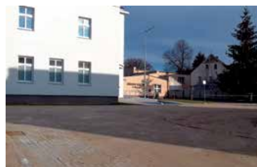
Na zdjęciu nowa droga przy ul. Wolności 20 tuż po zakończeniu budowy