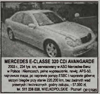
MERCEDES E-CLASSE 320 CDI AVANGARDE 2003 r., 234 tys. km, serwisowane w ASO Mercedes-Benz w Polsce i Niemczech, pełne wyposażenie, nowi! APS-50, naprawiona mapa, po naprawie pompy ESSC i naprawie gwintów skrzyni biegów przy stanie 220 000 km, bez zadnych wad prawny! i technicznych, godny zakupu, - 57.000 zł, tel. 511 238 028, WIELKOPOLSKIE - Poznań GR101689

MERCEDES S 320 W 220 , 2001 r., 187 tys. km, 3200 ccm, CDI, srebrny metalik, sprow. z Francji, gotowy do rejestracji, pełne wyposaż., stan bdb - 44.800 zł. Wieruszów, powiat świdnicki, tel. 509/22-16-70 GIORWTF3