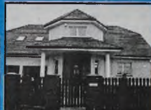
Sprzedam nowy dom w Bielanych Wrocławskich

295/1179 mkw., 20 pomieszczeń, wszystkie media, w rozliczeniu może być mieszkanie we Wrocławiu do 50 mkw.