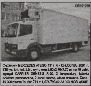
Ciężarowy MERCEDES ATEGO 1317 N - CHŁODNIA, 2001 r., 238 tys. km, ład. 5,5 t, wym. 6,60x2,46x2,20 m, na 16 palet, agregat CARRIER GENESIS R-90, 2 temperatury, ścianka dzielona podwieszana, 2 drzwi boczne, winda chowana. Cena - 49.000 zł netto. Tel. 601 771 111, 071/799-02-63 DOLNOŚLĄSKIE

MERCEDES SPRINTER 311, 2002 r., 136 tys. km, 2200 ccm, CDI, niebieski, 5-osobowy, pełna dokumentacja, ABS, ASR, EBC, EDV, kpl. kol. zimowych średni, niski, hak, możliwość wystawienia FV - 28.000 zł. Radość, powiat lubinski, tel. 0605/78-53-35 GIOLFA43 MERCEDES SPRINTER 316 BLASZAK MAXI, 2002 r., 200 tys. km, 2700 ccm, biały, bez wgnieceń, przelobiony z wersji angielskiej, zamki antywłamaniowe, ład. 1270 kg, 3-osobowy, Webasto, zarejestr. stan bdb - 35.000 zł. Wrocław, tel. 0603/66-97-27 GIOEHMT FOTO MERCEDES SPRINTER, 2002 r., 119 tys. km, 2148 ccm, diesel, biały, bez wypadku, kupiony w kraju, pełna dokument., i właściciel, zarejestrowany, el. lusterka, podwyższony, przedłużony, RO, bardzo mało przebieg i delikatna eksploatacja, 3 miejsca w kabine, komplet opon letnich i zimowych + zapas - 40.000 zł. Wrocław, tel. 0698/63-32-19 tygrzynek1976@onet.eu IOLFF5A MERCEDES SPRINTER 211, 2002 r., 170 tys. km, 2200 ccm, dCi, 115 KM, bordowy, 6-osobowy, stan bdb, bez wypadku, zadbane, el. szyby, alarm, c. zamek, Webasto, ABS, ASR, syst. kontrol. trakcji, wsp. kierownicy, hak, radio, bagażnik - 22.000 zł. Wrocław, tel. 0792/25-32-55, 0791/31-63 GIOMCPE