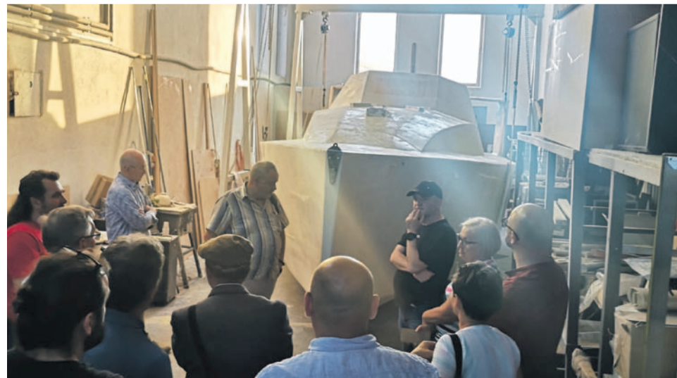
Już dziś sporo ludzi interesuje się nietypowym rejsiem, nietypowym jachtem i nietypowym żeglarzem. Nawet przychodzą do hangaru, aby popatrzeć na postępy prac