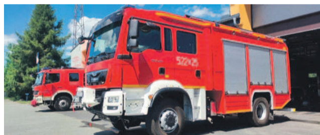
To nie tylko wóz gaśniczy, na wyposażeniu ma bardzo dużo wysokiej klasy sprzętu

potrzebny jest znaczny zapas środka gaśniczego. Czerwony gaśniczy z symbolem 522-25 będzie widywany w Jelczu-Laskowicach i na terenie powiatu oławskiego, gdyż w ramach Programu Infrastruktura i Środowisko 2014-2020 (PO IiS) oś priorytetowa III Rozwój sieci drogowej TEN-T i transportu multimodalnego.