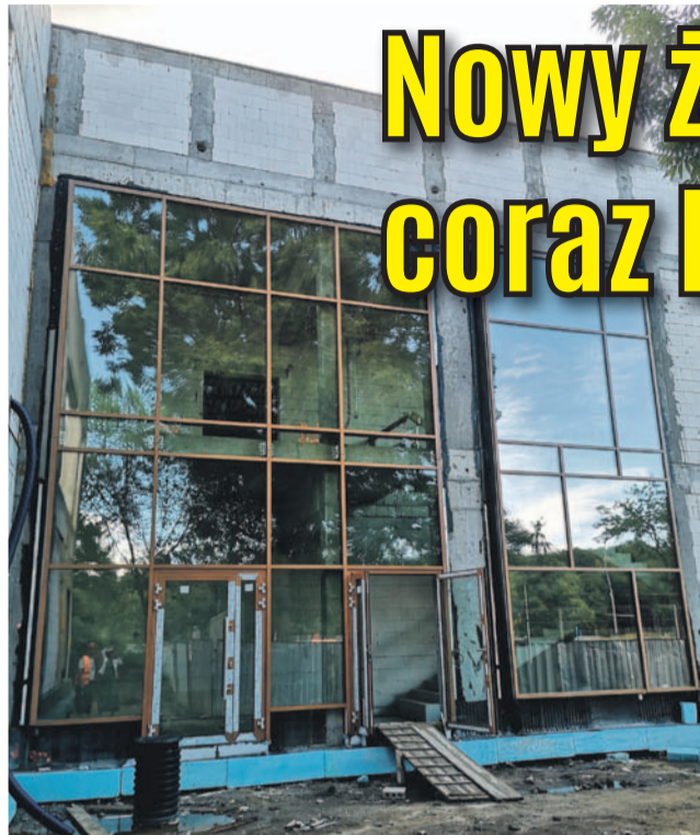
Żłobek budowany jest w nowoczesnym stylu

Trwa realizacja kolejnej ważnej dla mieszkańców inwestycji – budowa Żłobka Miejskiego. Budynek powstaje przy Przedszkolu Miejskim nr 4 na ul. 1 Maja. Będzie utworzonych 96 nowych miejsc opieki nad dziećmi w wieku do 3 lat, co umożliwi rodzicom powrót na rynek pracy.