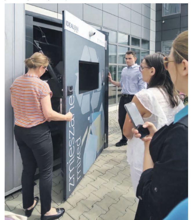
Przednia ściana kosza się otwiera tak, by firma wywożąca odpady bez problemu mogła wyjąć i opróżnić znajdujący się w środku pojemnik

kosza, otrzyma kartę dostępu oraz możliwość zalogowania się w aplikacji.