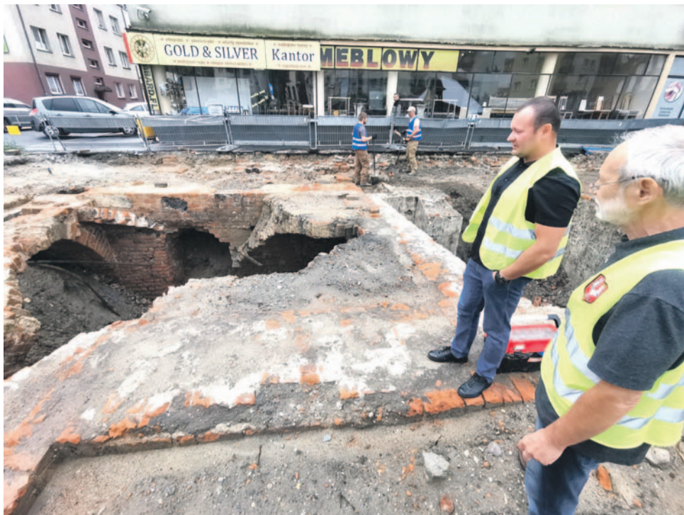
Te mury po dawnym hotelu trzeba dokładnie doczyścić i zbadać, po tym zostanie podjęta decyzja co dalej, czy można je zasypać, czy wyeksponować na stałe