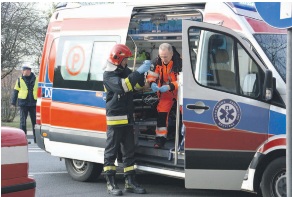
Nie wiadomo, gdzie od 1 września będą stacjonować ratownicy medyczni

założenia, których nie można przeskoczyć, a jednym z nich jest fakt, że w strukturach musi funkcjonować podstacja. Nie da się jednak ukryć, że stacjonujemy gościnnie w budynku Państwowej Straży Pożarnej. Mieliśmy umowę najmu do końca roku, a ze względu na to, że straż szykuje się do remontu dachu, na który już teraz dostała fundusze, będziemy tam tylko do końca sierpnia. Na ten moment nie wiem, jakie będą nasze dalsze losy. Na pewno nie należy od razu zakładać, że przeniosą nas nie wiadomo gdzie. Są określone czasy dojazdu i to jest podstawa funkcjonowania całego pogotowia. Na dziś trudno mi powiedzieć, gdzie będziemy od września. Nie sądzę, by skończyło się na Wrocławiu, ale co najważniejsze - nie ma takiej możliwości, by mieszkańcy pozostali bez zabezpieczenia medycznego. Tak jak wspominałem, zawsze liczą się czasy dojazdów. Jeśli trzeba jeżdżymy w struktury opolszczyzny i tak samo oni jeżdżą do nas. Nie wyobrażam sobie takiej sytuacji, by Oławę zostawiono na pastwę losu. Trudno mi jednak mówić o szczegółach, których po prostu jeszcze nie znam. Wiele będzie teraz zależało od pana starosty oraz dyrekcji we