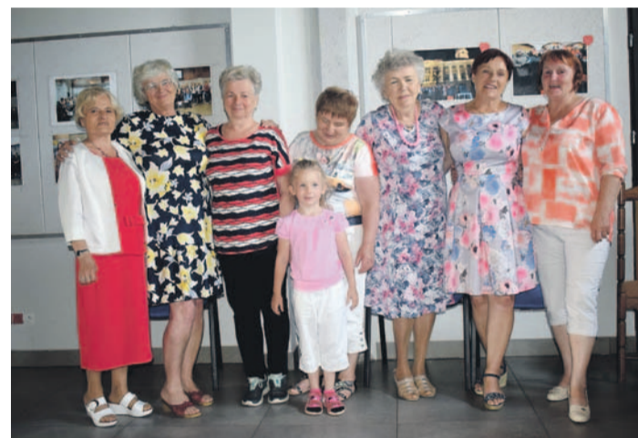
Seniorzy z niecierpliwością czekali na ten radosny moment

Oławscy seniorzy, po długiej nieobecności spowodowanej pandemią, wrócili do stacjonarnych spotkań w Klubach Seniora. Przy zachowaniu reżimu sanitarnego uczestniczą w zajęciach, które dzięki sprzyjającej aurze często odbywają się w plenerze. Seniorzy z radością przyjęli wiadomość o powrocie do aktywności, której bardzo im brakowało. Wszystkim życzymy dużo zdrowia oraz miłego spędzonego czasu.