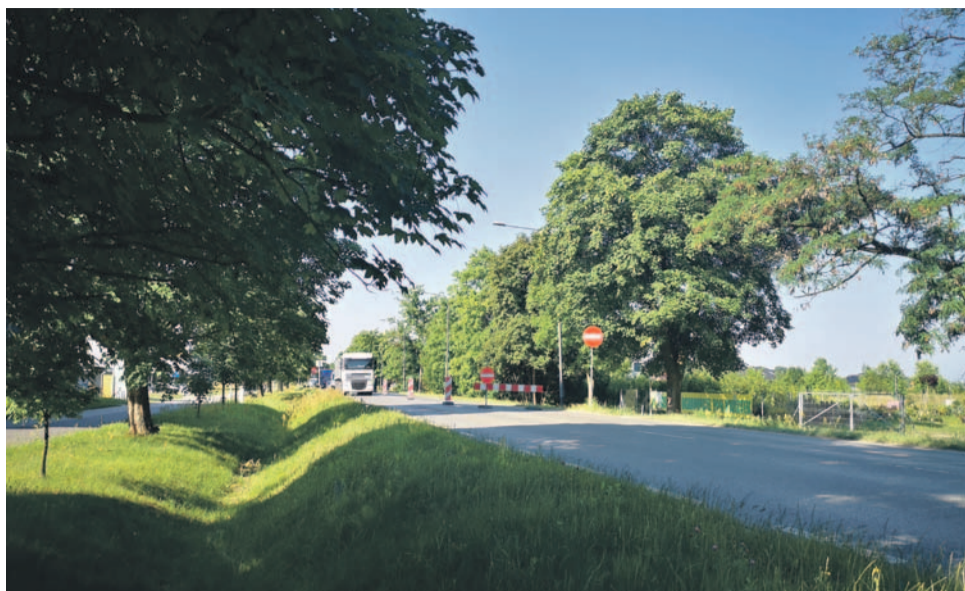
W kierunku Orłenu przejazd jest niemożliwy. W stronę Centrum Sportu i Rekreacji można jechać