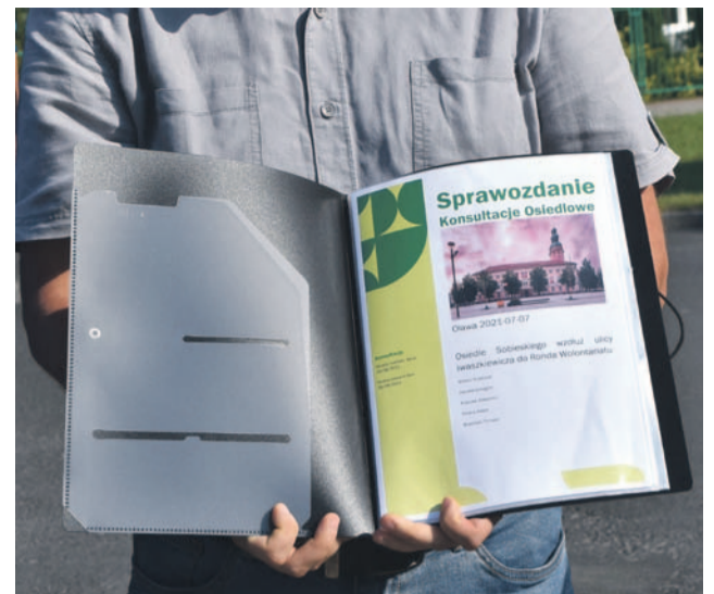
Potrzeby i wnioski mieszkańców z konsultacji zgromadzone w jednym dokumencie który zostanie przekazany władzom miasta

Odpowiadając na pytanie skąd pomysł na konsultacje społeczne i pomoc w formie „mieszkańcy mieszkańcom”