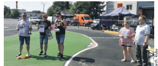
Ostatnie zawody były eliminacjami mistrzostw Polski