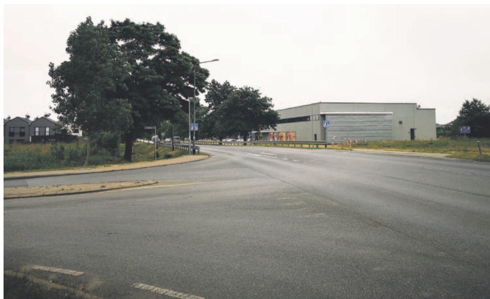
To na tym skrzyżowaniu powstaje rondo