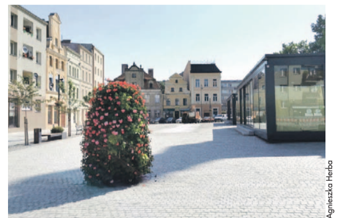
Wieże kwiatowe i donice na latarniach w Rynku kosztowały ponad 23 tys. złotych