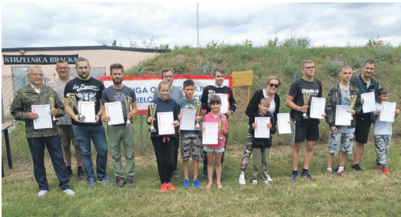
Najlepsi strzelcy zawodów 10 lipca