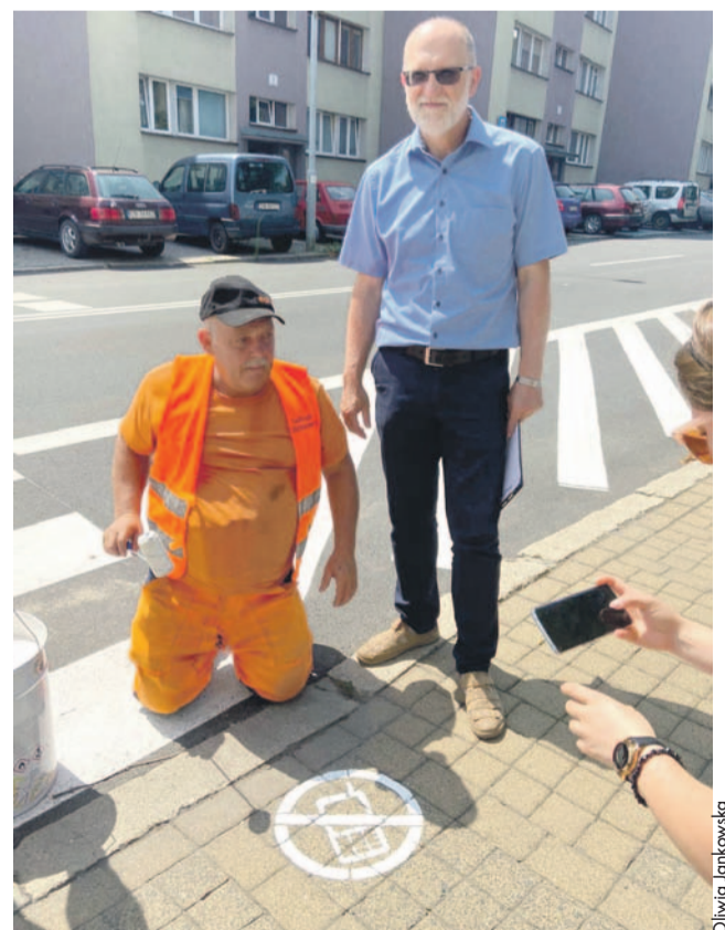
Piktogramy już są!

- Na chwilę obecną oznaczone zostaną przejścia przy szkołach oraz takie, które wiemy z różnych doświadczeń są bardzo często używane - dodaje starosta. - Zachęcam innych zarządców dróg krajowych, wojewódzkich oraz naszych lokalnych, żeby przejścia, szczególnie te, które są najczę-