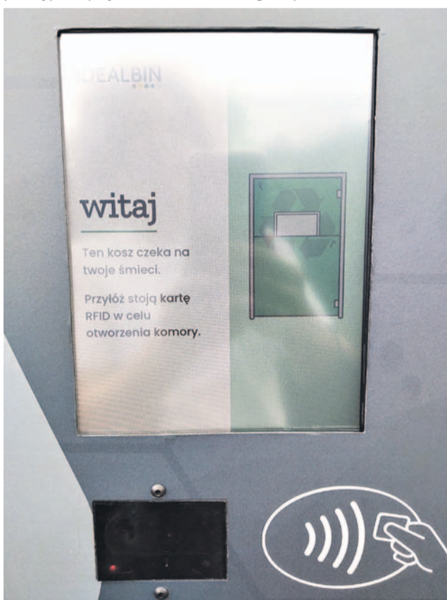
Aby pojemnik się otworzył i można było wrzucić do niego śmieci, każdy mieszkaniec będzie musiał najpierw wczytać swoją kartę identyfikacyjną