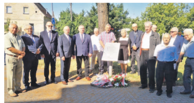
Spotkanie odbyło się przy oławskim Rondzie Kresowym

W tym roku obchodzimy również 78. rocznicę rzezi wołyńskiej. Dla uczczenia tych tragicznych wydarzeń przed tablicą pamiątkową przy Rondzie Kresowym w Olawie kwiaty złożyli przedstawiciele oławskich samorządów i stowarzyszeń m.in. Miłośników Kresów