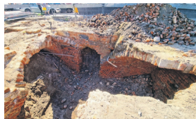
Odkrycie jest dokładnie badane

Podczas prac budowlanych, prowadzonych w związku z rewitalizacją Rynku, zostały odkryte fundamenty oraz piwnice po byłym hotelu i winotece „Pod lwami”