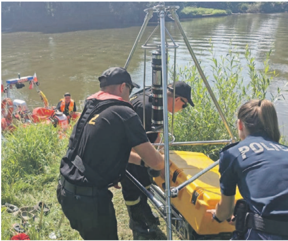
Do poszukiwań wykorzystano wysokiej klasy sprzęt, dzięki któremu sprawdzono dno Odry

wet kilku pracowało niemal od początku. W pierwszym dniu nie mógł działać długo, ponieważ się ściemniło i po zmroku akcję przerwano. W niedzielę przyjechało czterech nurków, podzielili się zadaniami, zabezpieczali wzajemnie. - Kwestia wejścia płetwonurka do wody musi być potwierdzona informacją