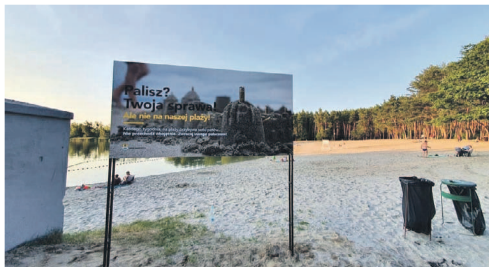
Palisz? Twoja sprawa! Ale nie na naszej plaży!