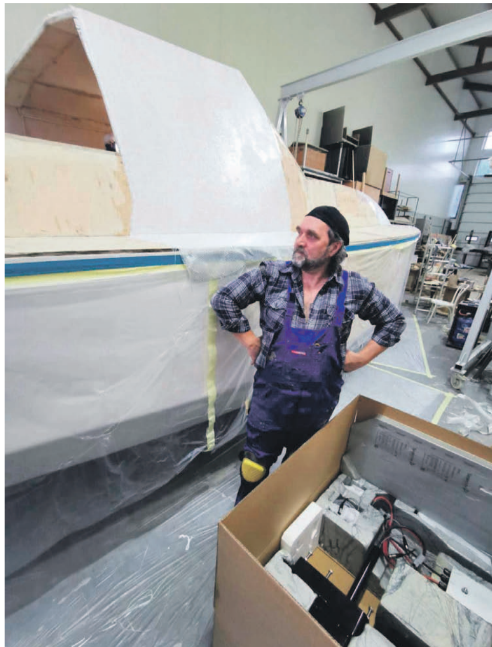
Z dumą patrzy na swoje dzieło, które wkrótce ma być zwodowane

Gdy wystartuje, nie płynie najkrótszą drogą przez kanał La Manche.