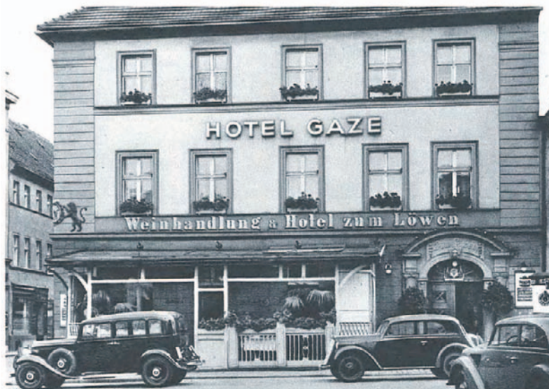
Tak wyglądało to miejsce