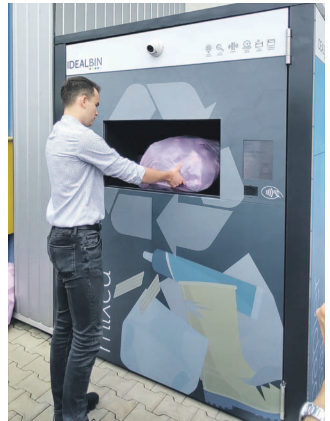
Po włożeniu do wnętrza worka z śmieciami kosz waży ilość i sprawdza jakość wyrzucanych odpadów

Kosze Idealbin przeznaczone są do selektywnej zbiórki papieru, plastiku i metali, szkła oraz odpadów zmieszanych. Ważą, a dzięki wbudowanej sztucznej inteligencji będą mogły rozpoznać rodzaj wyrzucanych śmieci i wskazać błędy w sortowaniu. W aplikacji na indywidualnym koncie mieszkańca, każdy będzie miał wgląd w informacje dotyczące ilości wyrzucanych śmieci i poziomu segregacji. Każdy, kto będzie korzystał z takiego