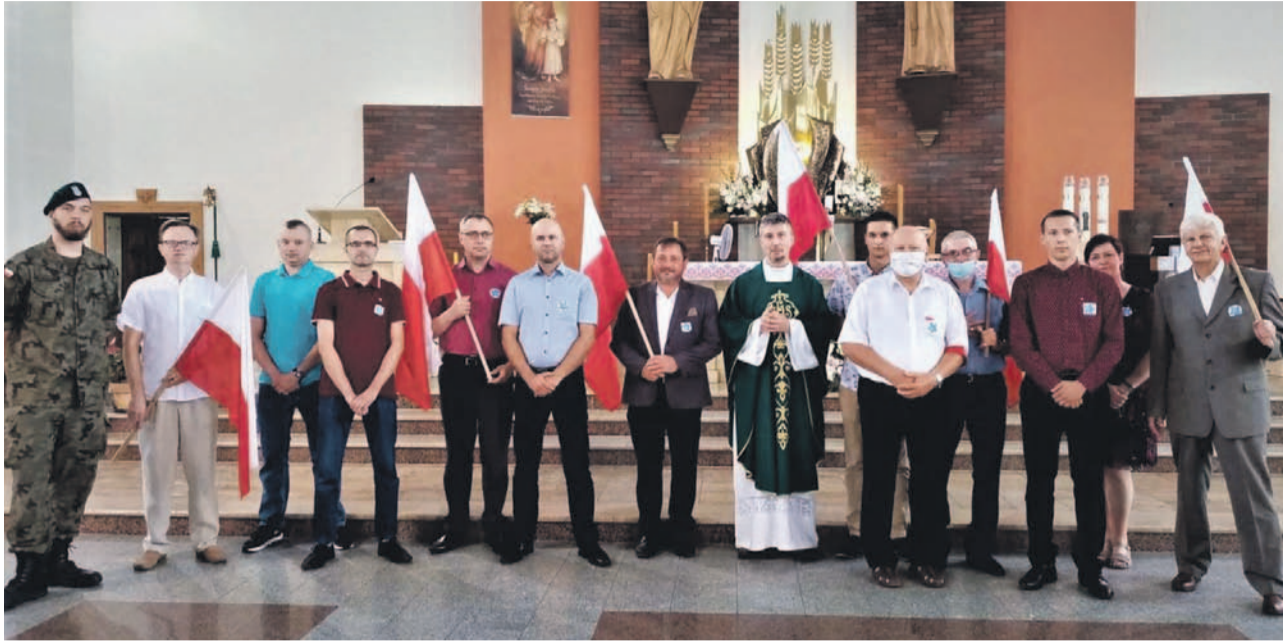
Uroczysta msza święta odbyła się w parafii pw. św. Maksymiliana Marii Kolbego

cy Polaków opuściły swoje domy, uciekając do centralnej części kraju.