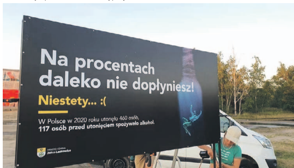
Na procentach daleko nie dopłyniesz!