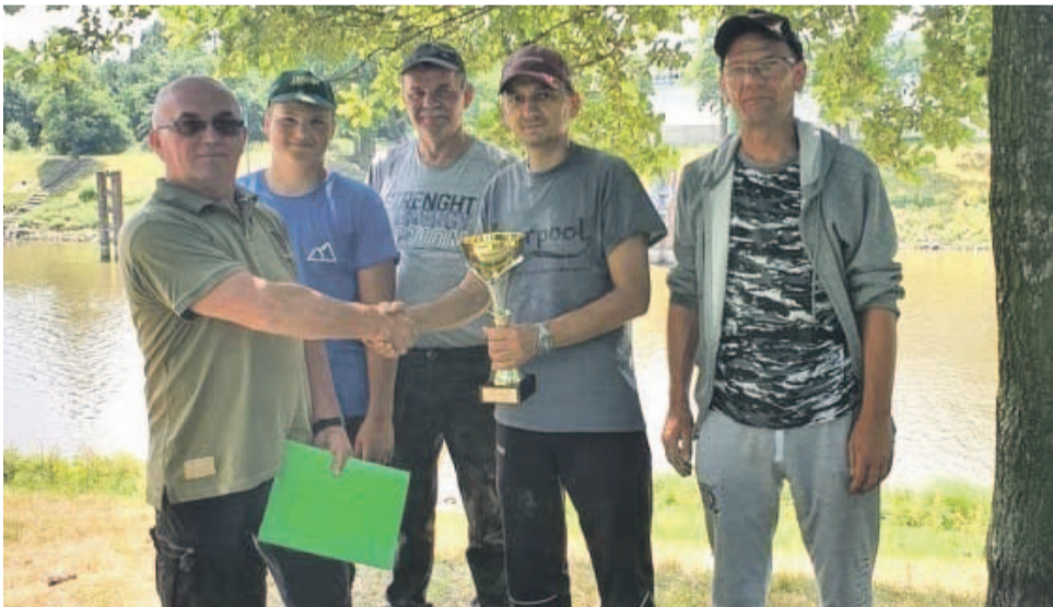
Najlepsi w zawodach o puchar prezesa Koła PZW nr 19 „Rzemieślnik” w Oławie