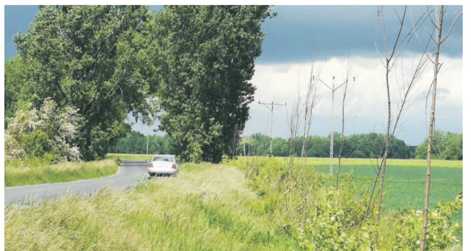
A to mógłby być taki przyjemny fragment Odrzańskiej Trasy Rowerowej...

Koło Gospodyń Wiejskich GAĆaneczki oraz Rada Sołecka wsi Gać zapraszają na akcję