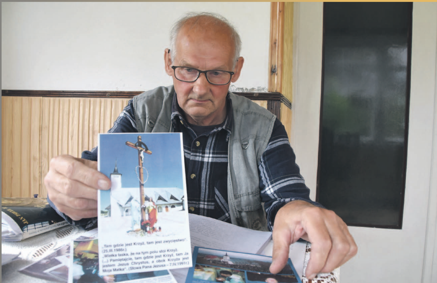
- Komputer i internet? O, nie! Co to, to na pewno nie! Po co robić z mózgu śmietniko. Człowiek jest tylko człowiekiem, każdy jest słaby. Mógłbym ulec pokusie i obejrzeć coś niewłaściwego. Diabeł tylko czeka, żeby zaatakować. Wiem, o czym mówię. To przerażające - mówi i prezentuje krzyż, z którego figura Chrystusa miała kiedyś krwawić

Dopytywany opowiadał, że powiedział mu to „wewnętrzny głos”, gdy czytał prorocstwa. O swoim powołaniu informował i starał się już przekonać wielu. Pisał do ważnych osób w kraju i do gazet. Zainteresowanie było jednak - jak to wtedy określił - słabiotkie. Dlaczego? - Bo ludzie boją się prawdy - mówi. - Wiem, że ci, którzy nie wierzą, mogą