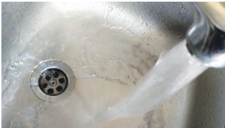
9 czerwca awaria zaskoczyła nie tylko mieszkańców, ale też ZWiK. Trzeba było kilku dni, aby rozwiązać problem

zakładu. W trakcie tych prac okazało się, że uszkodzeniu uległ główny przewód zasilający Zakład Uzdatniania Wody. Około godziny 14.30 przystąpiono do wyłączenia z eksploatacji uszkodzonego przewodu, przełączając zasilanie na przewód zapasowy. Prace zostały zakończone około godziny 17.30, co pozwoliło rozpocząć rozruch zakładu.