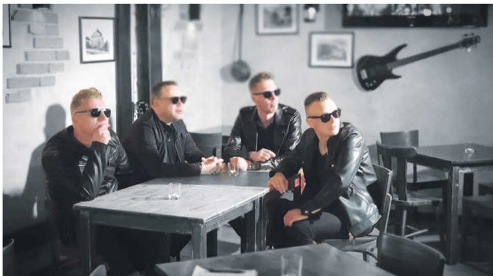
Zdjęcia do teledysku były zrobione również w barze „Samy Swoi” w Oławie