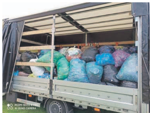
Pełna przyczepa nakrętek, ale potrzeba kolejnych