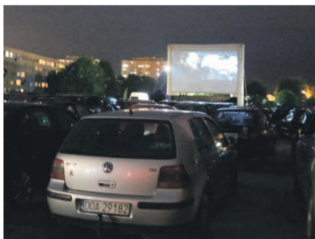
Tak było 11 czerwca w Olawie