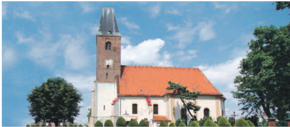
Dzięki gminnej dotacji, parafia będzie mogła dokończyć remont

- Kościół ma wartości artystyczne, których zachowanie leży w interesie społecznym - czytamy w uzasadnieniu. - Na skutek wieloletniej eks-