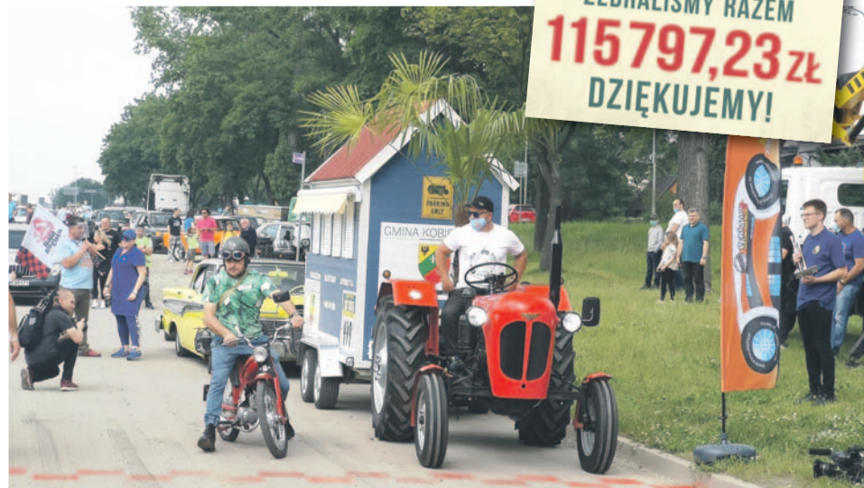
Palma na starcie w Olawie