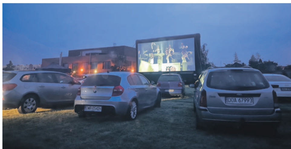
W ramach kina samochodowego mieszkańcy obejrzeli „Green Book”