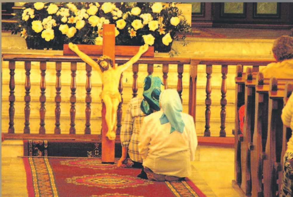
Dwa lata temu w 35. rocznicę tzw. objawień w Oławie, pod nieobecność księdza proboszcza krzyż z figurą Chrystusa na chwilę ustawiono przy ołtarzu i modlono się do niego. Jeden z pielgrzymów tłumaczy, że to jest ta figura, która wisiała na krzyżu, związanym z tzw. „cudami oławskimi”: - A on krwawił, wiele znaków dawał. Teraz jest odnowiony i przechowywany poza kościołem