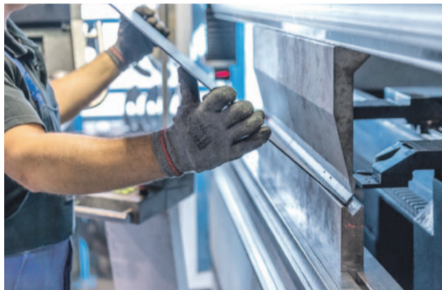
Pomoc adresowana jest do mikro, małych i średnich przedsiębiorstw

z funduszy unijnych - mówi Cezary Przybylski , marszałek województwa dolnośląskiego.