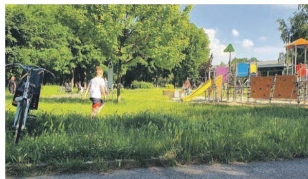
Tak było w niedzielę na Miasteczku. We wtorek trawę skoszone