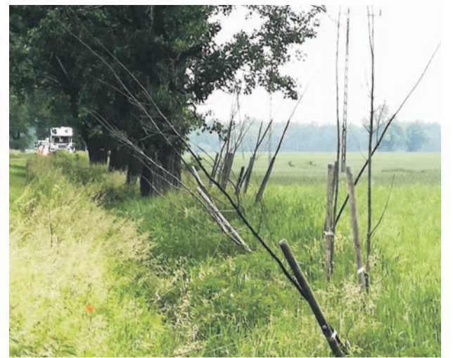
Stan nasadzeń woła o pomstę do nieba. Jak te drzewka mają rosnąć?!

A tak niewiele brakuje, aby ten ostatni odcinek, czyli właśnie z Oławy do Siedlec (to niecałe 2 km), zrobić solidnie, jak na część Odrzańskiej Trasy Rowerowej przystało. Bez lipy. No, ale to trzeba wcześniej przemyśleć, a nie sadzić drzewka tak, by potem nic się nie dało z tym zrobić. Chyba, że - tu na chwilę przy rowerze zapala się zielona lampka