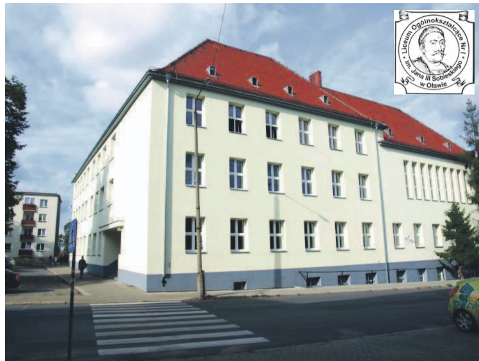
Trwa rekrutacja m.in. do Liceum Ogólnokształcącego nr 1 w Oławie

- Zespół Szkół w Jelczu-Laskowicach rekrutacja@zsjelcz.pl