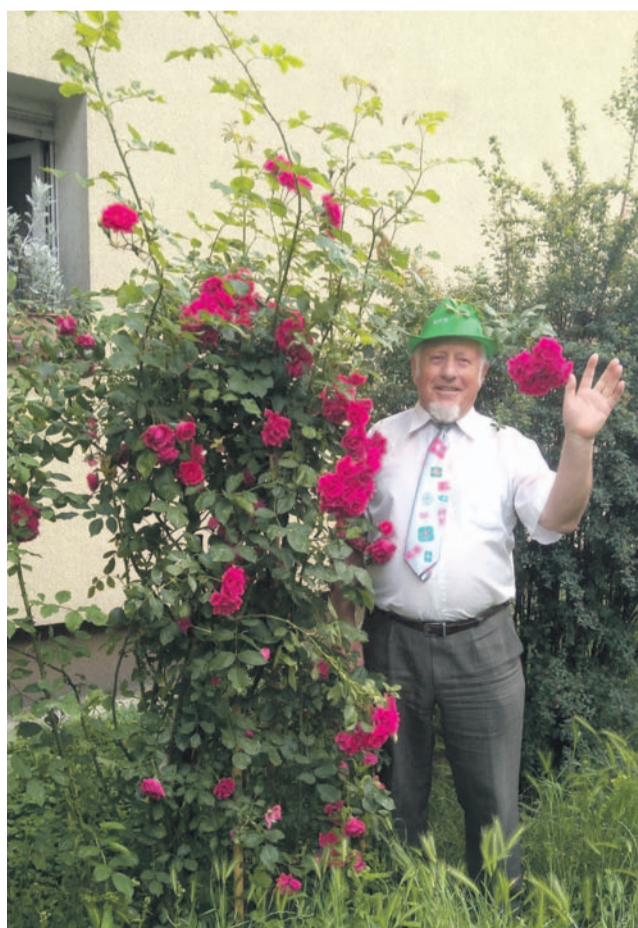
Pan Tadeusz i jego róże