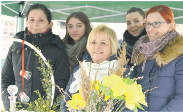
W powiecie olawskim kół gospodyń wiejskich nie brakuje. Na zdjęciu panie z Godzikowic