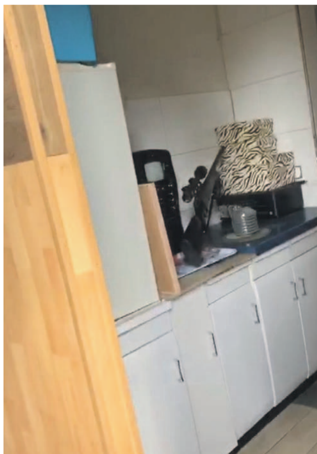
Tak wyglądała kuchnia letnia przed wynajęciem domu

WIOLETTA KAMIŃSKA wkaminska@gazeta.olawa.pl