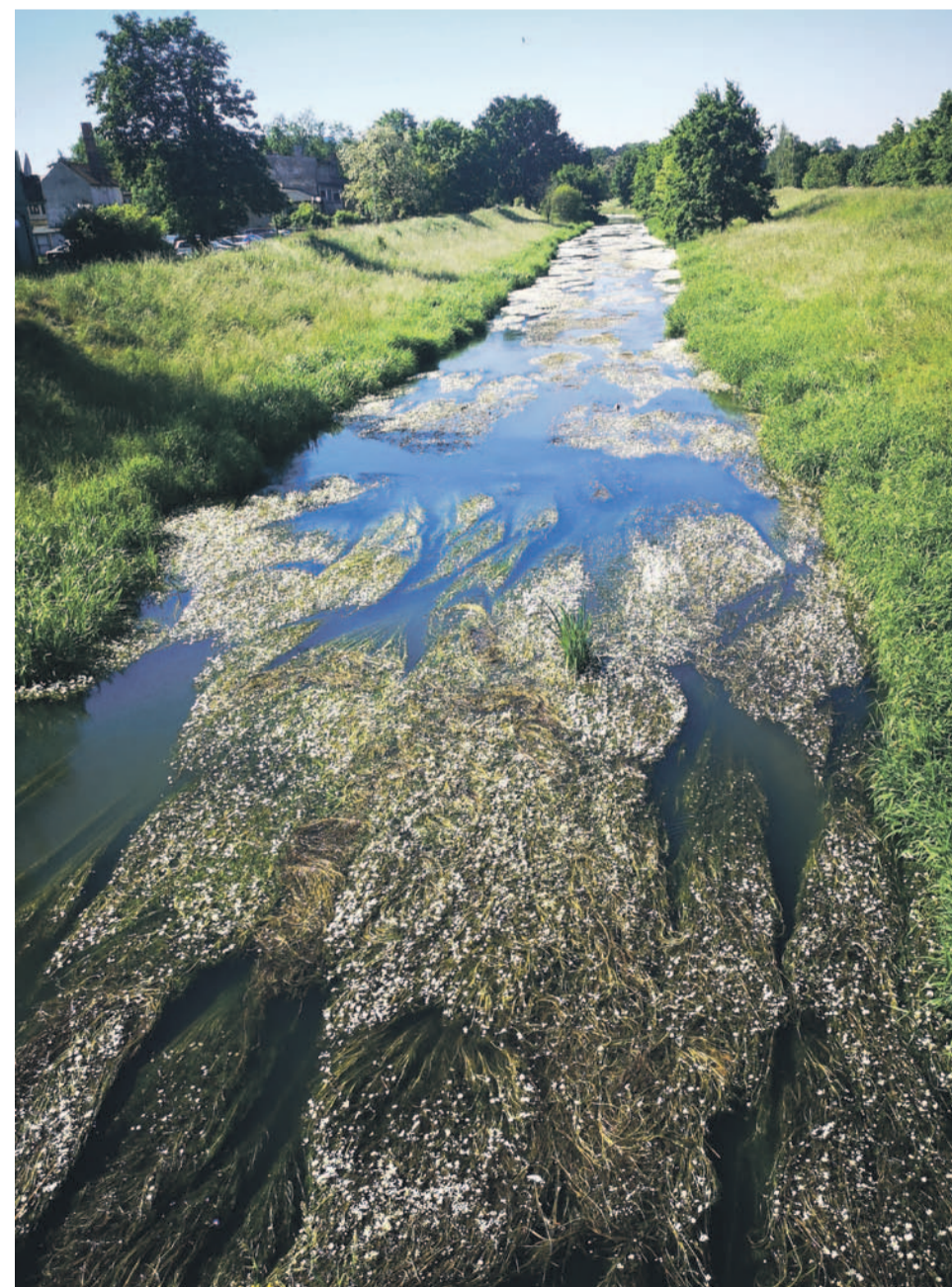
Zdjęcie Oławki sprzed 2 tygodni