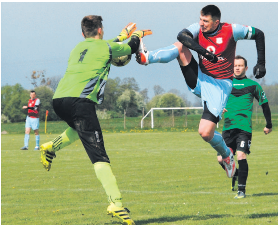
Piłkarze „Zalesia” Wójcice (na fot. zawodnik tego zespołu w zielonym stroju) w pierwszej rundzie „pandemicznej” Ligi LZS Jelcz-Laskowice odnieśli efektowne zwycięstwo nad miłocickim „Piastem”, ale w drugiej kolejce niespodziewanie wysoko ulegli „Widawie” Grędzina