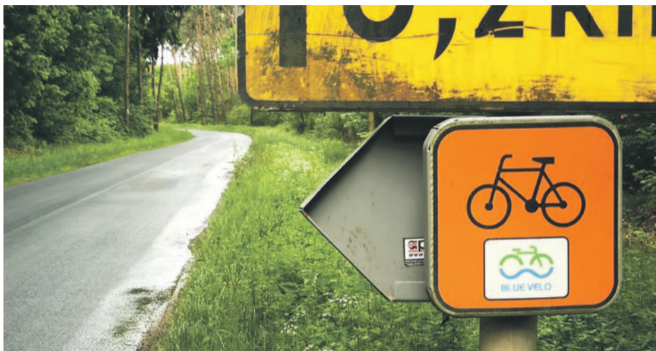
Tak, to jest część Blue Velo, ale od samych znaczków trasa nie robi się ani wygodniejsza, ani bardziej bezpieczna. Zwłaszcza, gdy nie ma pobocza