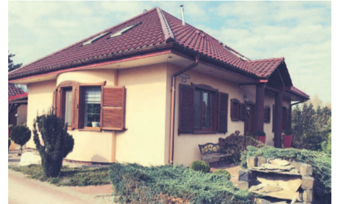
Właściciele wynajęli ten dom w Marcinkowicach, by nie stał pusty, gdy oni wyjadą. Teraz nie mogą do niego nawet wejść. Najemcy nie chcą się wyprowadzić

To nie koniec niespodzianek. Dwa dni później do właścicieli domu zadzwoniła ich adwokatka i poinformowała, że najemcy domu złożyli donos na policję i skierowali do sądu sprawę o wtargnięcie na posesję. Twierdzą też, że podczas tego zdarzenia gro-