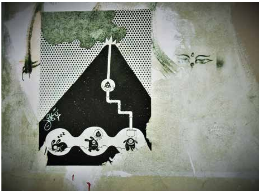
Igor Wojtasik (13 lat) wyróżnienie