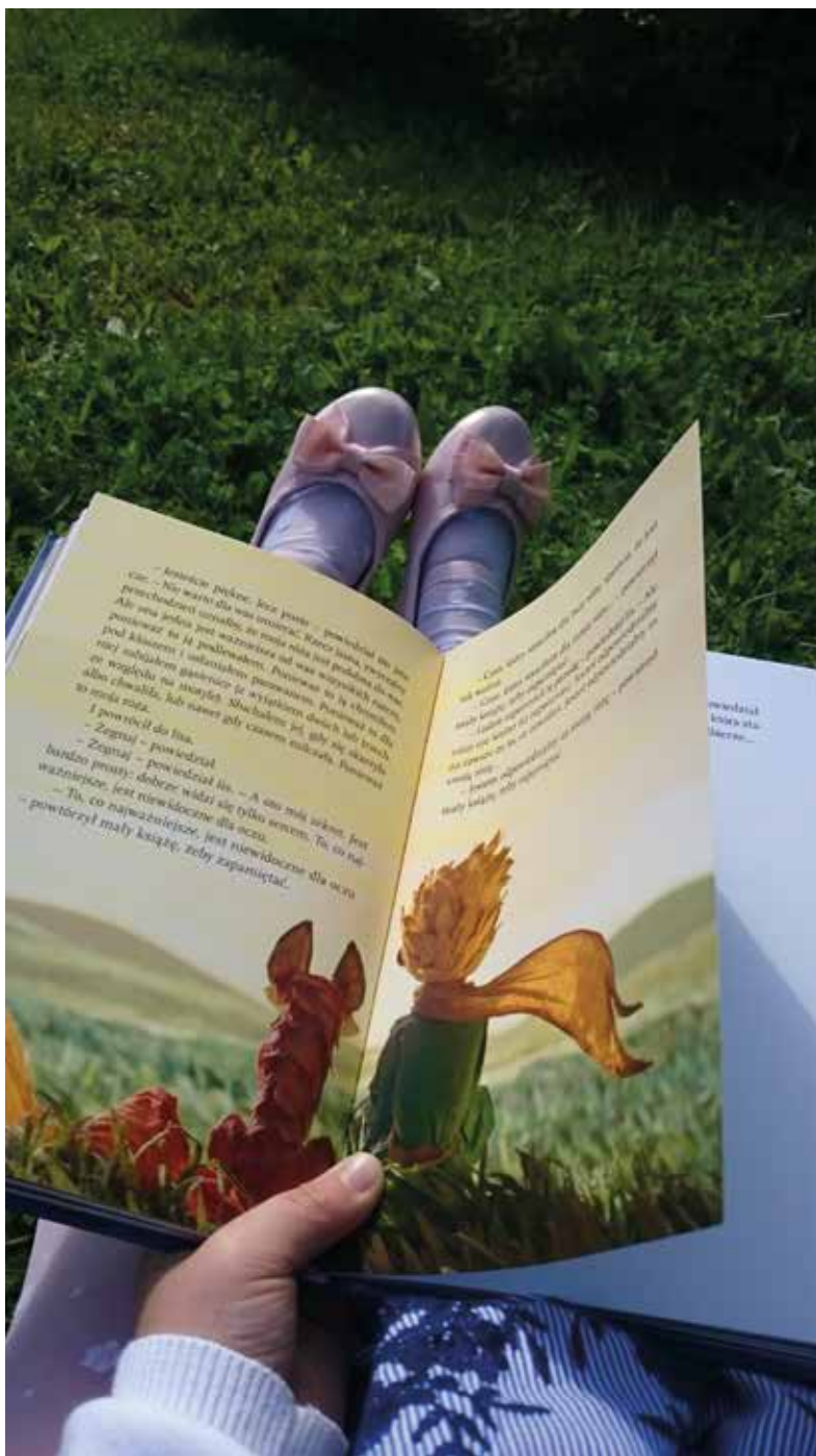
II nagroda Blanka Kłubowicz (7 lat) Mały Książę