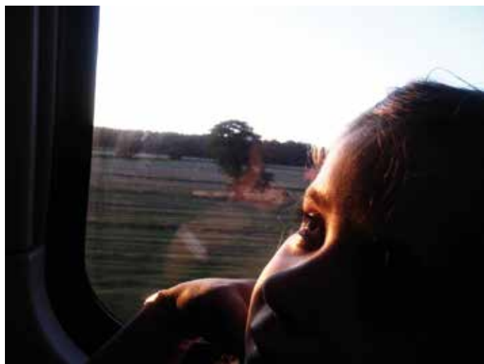
Jadąc w stronę słońca