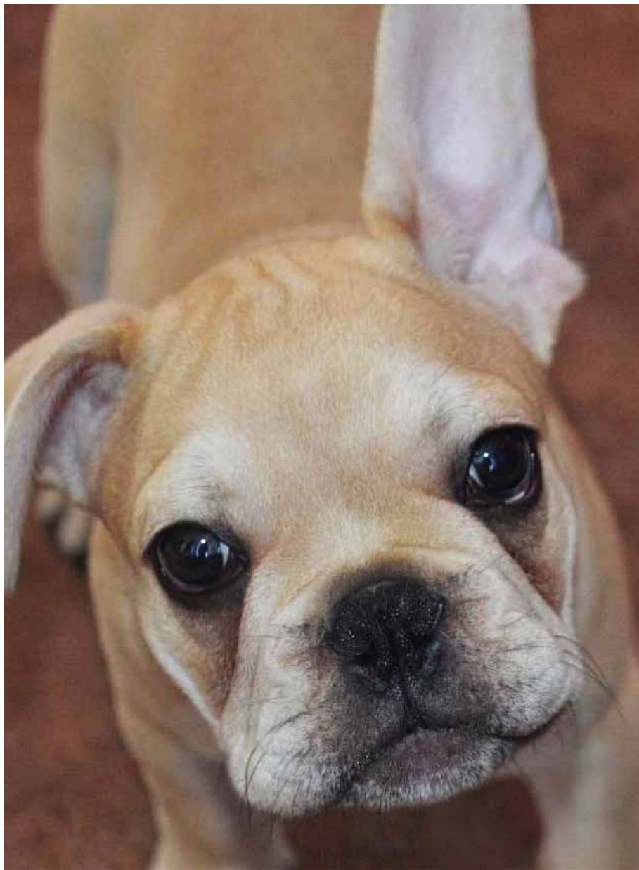
Alan Szumisz-Otoo (7 lat) wyróżnienie