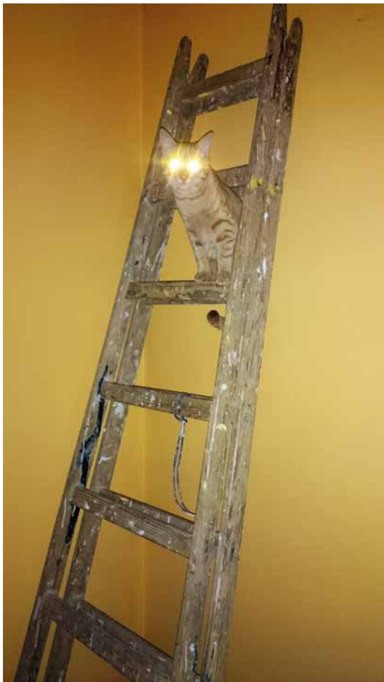
I nagroda Tymon Gierus (9 lat) Mam tę moc