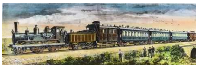
Orient-Express, gravura din 1833

W Bukareszcie o szóstej rano podróżni zjedli śniadanie - herbata i kanapki z kawiozem - w dworcowym bufecie. W Giurgiu nad brzegiem Dunaju ze zdumieniem dowiedzieli się, że tu pociąg kończy swój bieg: do Konstantynopola dotarli korzystając z promu, rozklekotanego pociągu i statku. Dopiero od stycznia 1889 roku można było wsiąść do pociągu w Paryżu i po 67 godzinach i 35 minutach, bez ko-