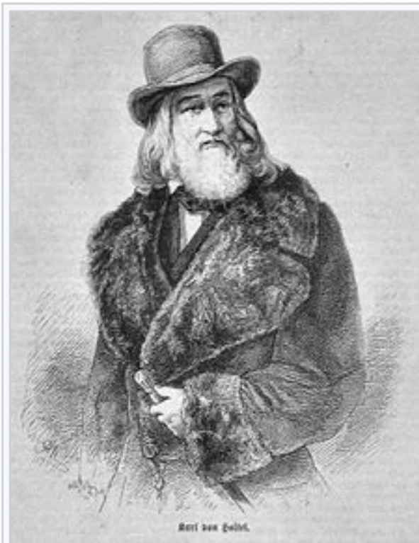
Karl von Holtei roku 1873

Odbierano więc te treści jako radykalne i niebezpieczne.