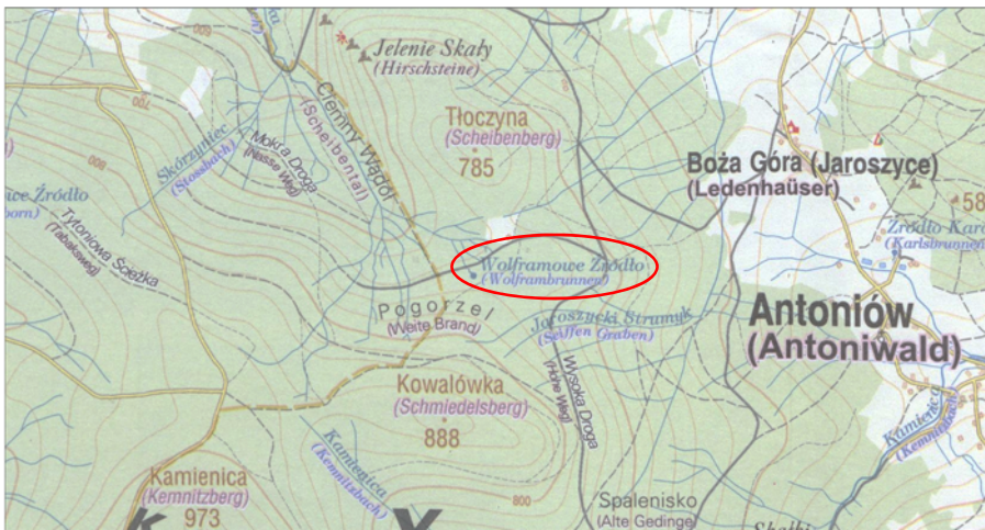
Wolfgangbrunnen ( hier Wolframbrunnen genannt )