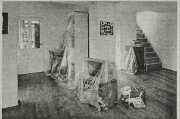
Będąc otoczonym wszechobecnymi reklamami przekonującymi, że kredyt otrzymamy „od ręki” lub w „5 minut” łatwo można ulec przekonaniu, że kredyt gotówkowy, konsumpcyjny czy też hipoteczny to zbliżona grupa produktów dostępna w szybkim czasie

Biorąc powyższe pod uwagę oraz wiedząc, że czas analizy wniosku może