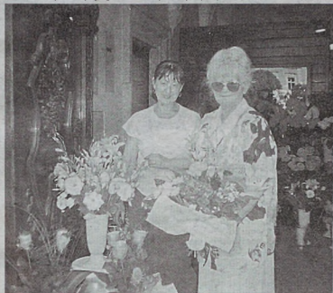
Kwaciarki z Ryńka