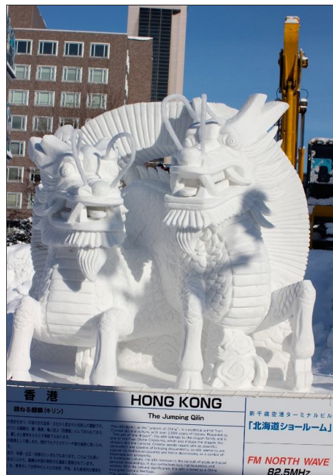
香港 HONG KONG The Jumping Qilin 新千歳空港ターミナルビル 【北海道ショールーム】 FM NORTH WAVE 82.5MHz

we władanie rzeźbiarzy: w tym 11 drużynom spoza Japonii min. z Korei, Hongkongu, Tajlandii, Nowej Zelandii, Korei, Singapuru, Stanów Zjednoczonych i Polski. W śniegu tworzyli również japońscy artyści, harcerze z wielu kra-