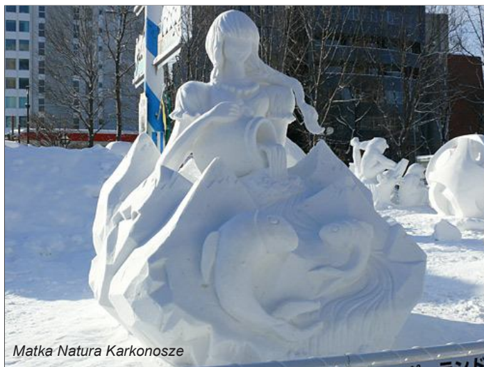
Matka Natura Karkonosze

Ostatecznie Konkurs na Międzynarodową Rzeźbę w Śniegu wygrała Korea. Przedstawicielki naszego kraju zostały uznane za najsympatyczniejszą drużynę Międzynarodowego Konkursu w Rzeźbie w Śniegu. Na Sapporo Snow Festiwal przyjechali w