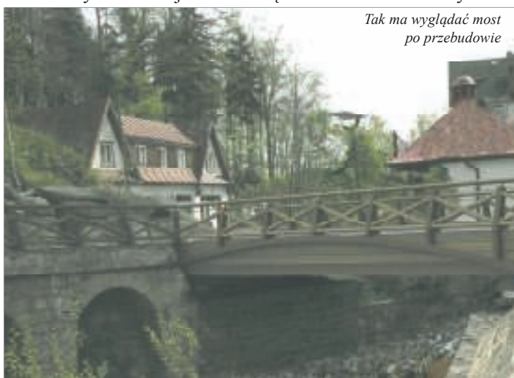
Tak ma wyglądać most po przebudowie

chodniku trwały jak najkrócej. Jednak ostateczna decyzja zależy od wykonawcy, który zobowiązany jest