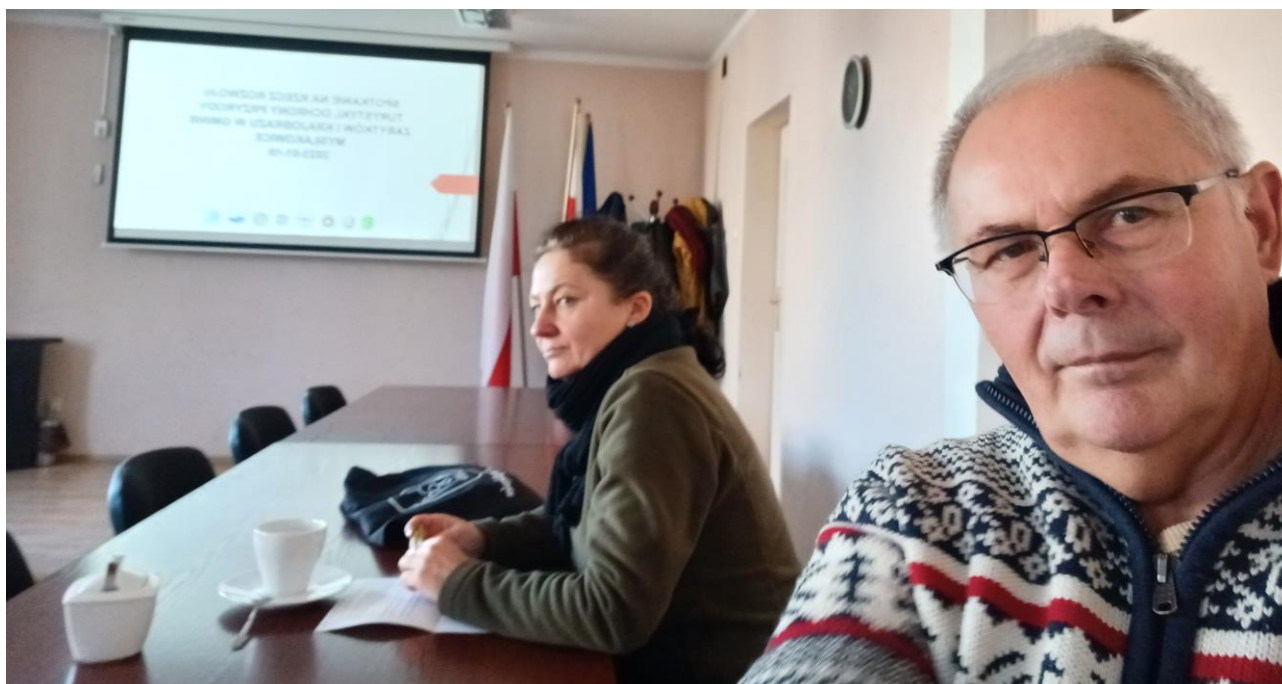
Uczestnicy spotkania:

Zadaniem, które wydaje się nie mieć końca są działania zmierzające do powrotu na pierwotne miejsce usadowienia „Lwa czuwającego”, znajdującego się obecnie nad tamą złotnicką. Niestety temat ten jest bardzo skomplikowany pod względem prawnym i pewnie upłynie jeszcze trochę czasu nim sprawa znajdzie swój finał, pozytywny finał.