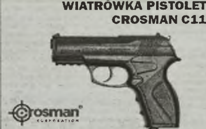
WIATRÓWKA PISTOLET CROSMAN C11