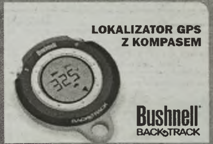
LOKALIZATOR GPS Z KOMPASEM