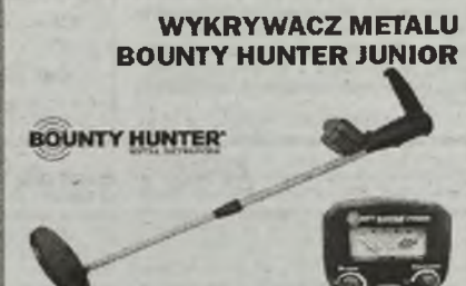
WYKRYWACZ METALU BOUNTY HUNTER JUNIOR