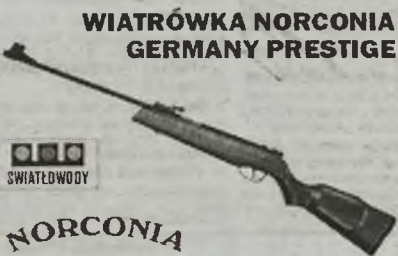
WIATRÓWKA NORCONIA GERMANY PRESTIGE