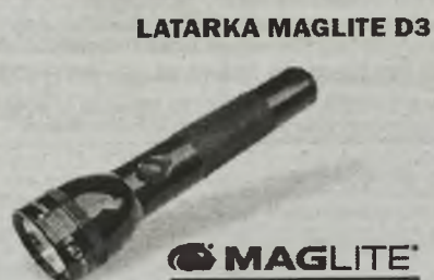
LATARKA MAGLITE D3