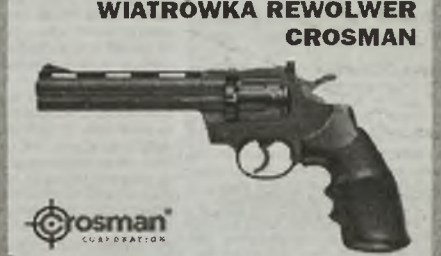
WIATRÓWKA REWOLWER CROSMAN