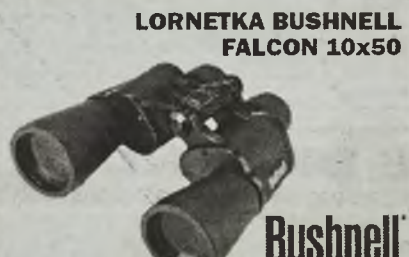
LORNETKA BUSHNELL FALCON 10x50