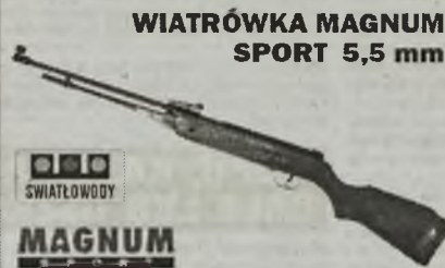
WIATRÓWKA MAGNUM SPORT 5,5 mm