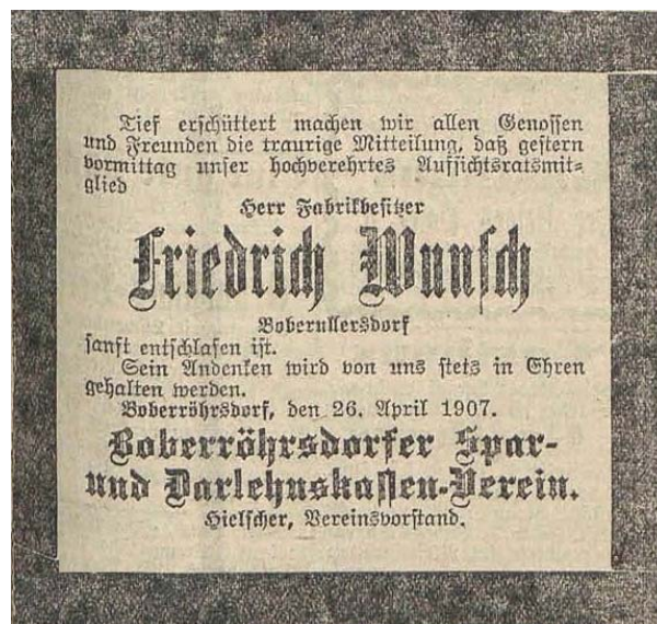
Boberröhrschorfer Spar- u. Dahrlehnskassen-Verein