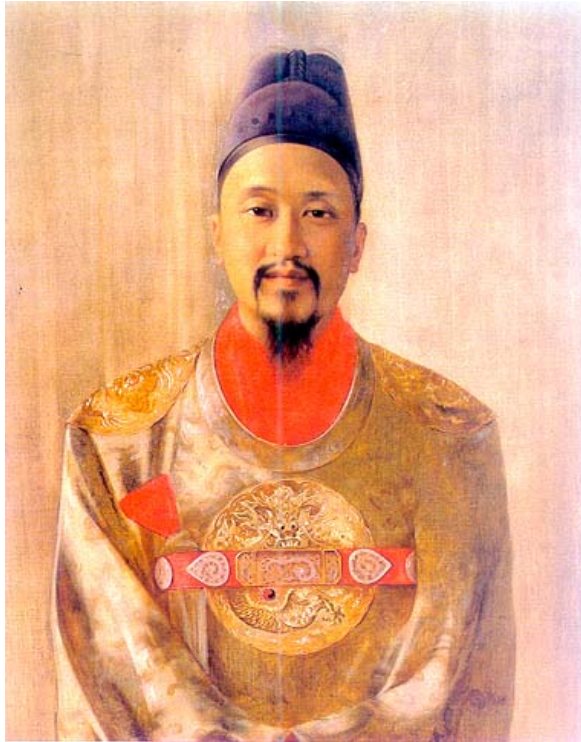
Kaiser Kojong (1852 – 1919) in Korea Regierte von 1873-1907