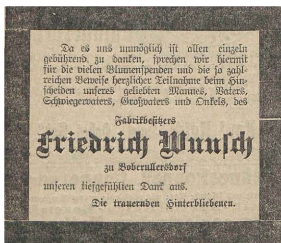
Danksagung der Familie Wunsch