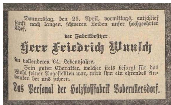
Traueranzeige des Personals