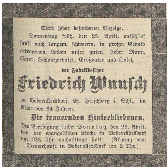
Traueranzeige der Familie Wunsch