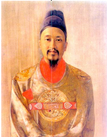
Cesarz Kojong (1852 - 1919) w Korei Sprawował rządy w latach 1873-1907