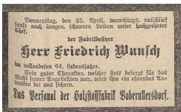
Zawiadomienie o żałobie pracowników