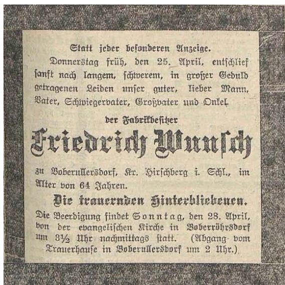
Nekrolog rodziny Wunsch