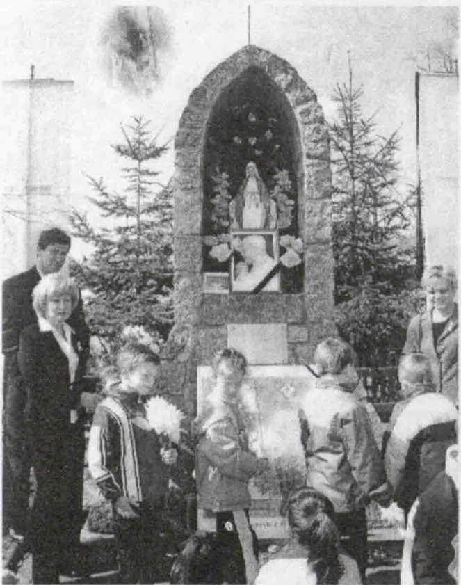
„ Pożegnanie Wielkiego Rodaka “