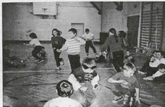
Tak wyglądały nasze zajęcia.