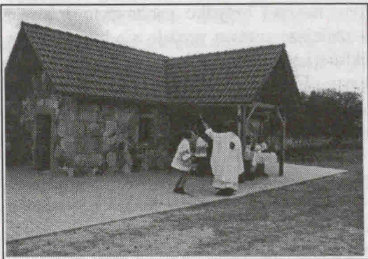
Takie są efekty !

Podziękowania należą się również dla Rady Sołectkiej w Janówku, która swoje środki z budżetu sołectwa przeznaczyła w całości na rzecz remontu kaplicy.