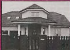
Sprzedam nowy dom w Bielaniach Wrocławskich

1997 r., 165 tys. km, 2600 ccm, V6, granatowy, automatic, skórzana tapicerka, 2 poduszki pow., klimatronic, el. ster. szyby i lusterka, tempomat, alum. felgi, RO z CD, alarm, wykończenia w drewnie, inst. gazowa sekwencyjnym wtryskiem, sprow. ze Szwajcari, zarejestrowany - 20.900 zł. Wrocław, tel. 000/000-00-00