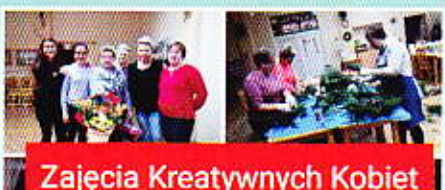
Zajęcia Kreatywnych Kobiet