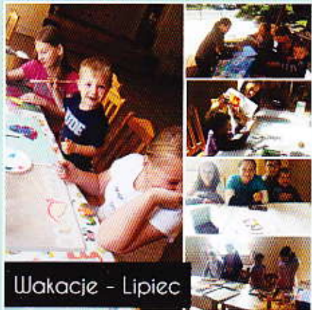
Wakacje - Lipiec