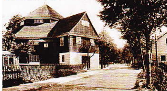
Alt Kamnitz v. Kamnigebirge. Ein Ansicht

łupkiem. Budowę rozpoczęto w lipcu 1743. A gotowy był już w październiku 1743. Zdziwiająco i niesamowite tempo. Tego też roku został wyświęcony pod wezwaniem Johannes Bethaus. Po kilku latach przemianowano na Bethauskirche. Także w tym roku rozpoczęto budowę szkoły i domu parafialnego / dzisiejsze przedszkole/.