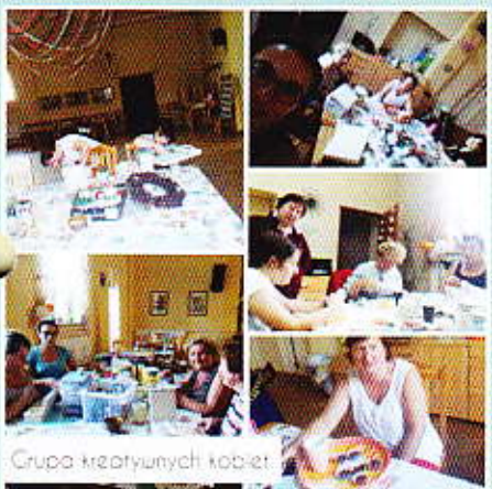
Grupa kreatywnych kobiet

Lato minęło bardzo szybko tym bardziej, że w tym roku pogoda dopisała i fajnie było posiedzieć na zajęciach również na zewnątrz, gdzie mamy ogrodzony i bezpieczny dla dzieci teren.