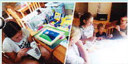
Wakacje - Sierpień