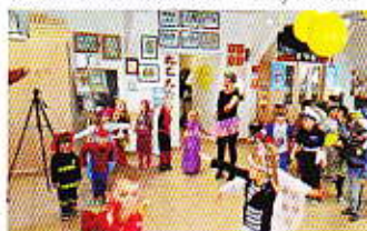
Zabawa karnawałowa przedszkolaków.