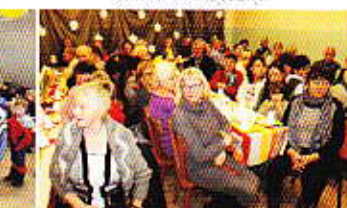
Dzień Babeli i Dziadka