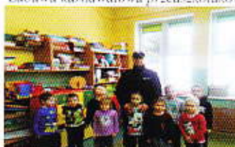
Poznajemy zawody: spotkanie z Policjantem.