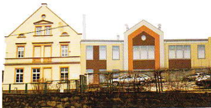
Wizualizacja rozbudowy Gimnazjum w Starej Kamienicy pomiędzy budynkiem "A" a halą sportową

uzyskaniu pozytywnej opinii do końca marca br. Rady Gmin zgodnie z literą prawa musiały podjąć ostateczne uchwały w sprawie sieci szkół funkcjonujących w okresie 1 września 2017