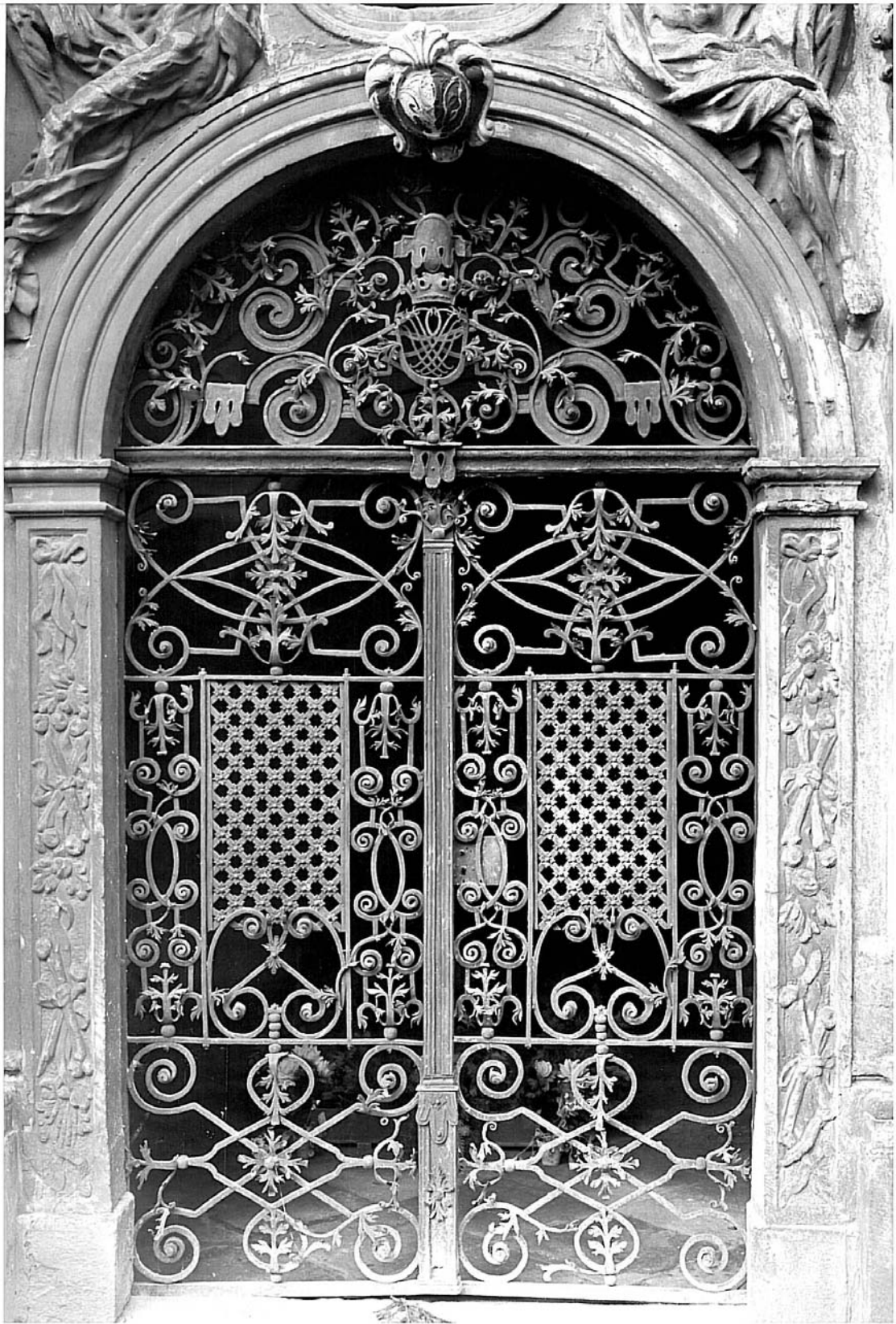
Gitterportal an der Heß'schen Gruftkapelle (vor 1945)