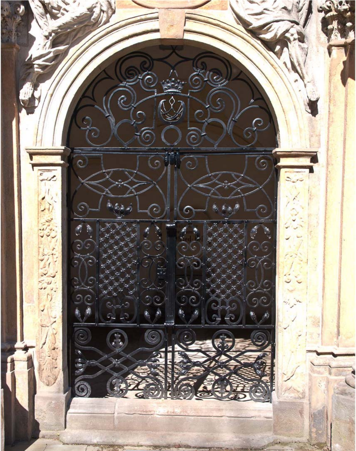
Das neue Gitterportal an der Heß'schen Gruftkapelle im Frühjahr 2014