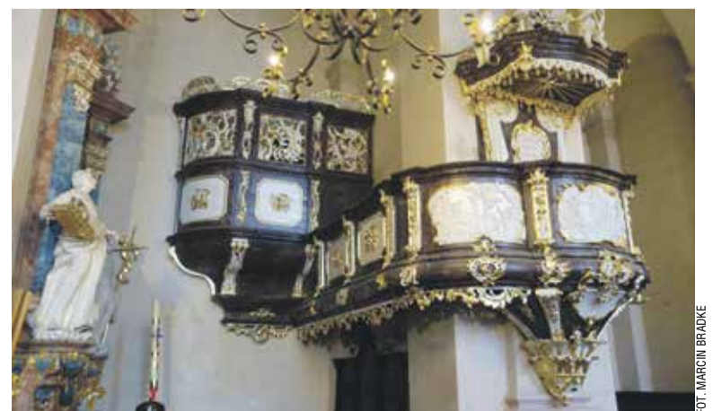
Barokowa ambona w kościele w Głębowicach