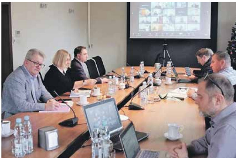
Hybrydowe obrady w Komisji Krajowej

W tym kontekście Piotr Duda odniósł się do fali krytyki w mediach społecznościowych i na forum Rady Dialogu Społecznego ze