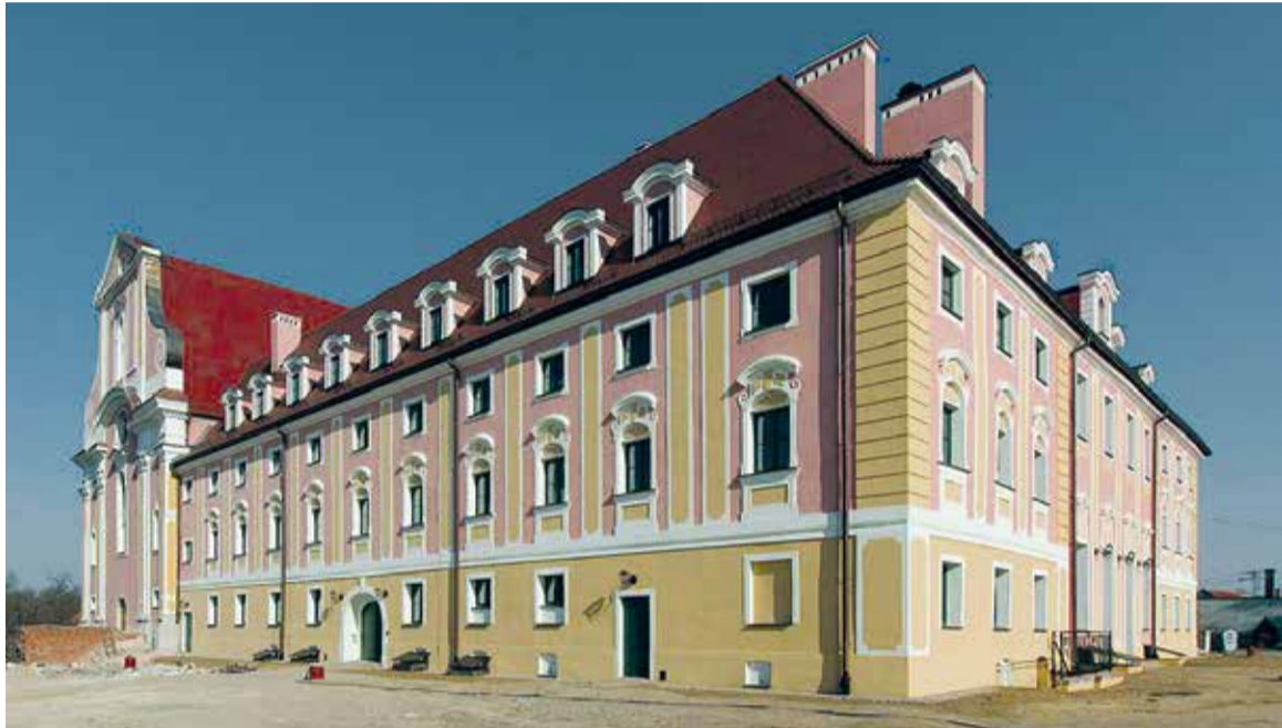
Pokarmelicki zespół klasztorny w Głębowicach w gminie Wińsko