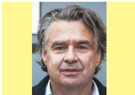
Autor jest reportażystą, felietonistą, powieściopisarzem. Obecnie pracuje w TVP3 Opole i TVP Info.