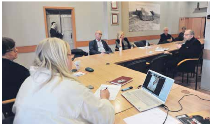
Hybrydowe obrady oświatowej Solidarności

Podkreślono też w nim, że nie ma i nie będzie zgody KSOiW NSZZ „Solidarność” na zwiększenie pensum dydaktycznego nauczycieli z 18 do 22 godzin tygodniowo, jak planuje MEiN. – Takie rozwiązanie doprowadzi do zwolnienia z pracy co najmniej 50 tys. nauczycieli w całym kraju” – szacują związkowcy. „Obrona miejsc pracy jest priorytetem Związku, dlatego protestujemy