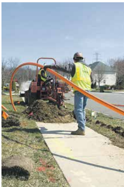
W telekomunikacji zawarto nowe porozumienie płacowe.

Zakończyły się, zainicjowane przez Organizację Międzyzakładową Pracowników Telekomunikacji NSZZ „Solidarność”, negocjacje ws. wzrostu wynagrodzeń pracowników NexoTech S.A. w roku 2022.