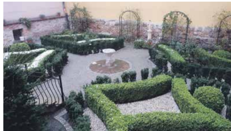
Dziedziniec wewnętrzny klasztoru

w Głębowicach. Pod koniec życia wstąpił do niego jako brat świecki Christophorus i zmarł w 1680 r. Pochowano go najpierw na przyklasztornym cmentarzu, po latach zaś