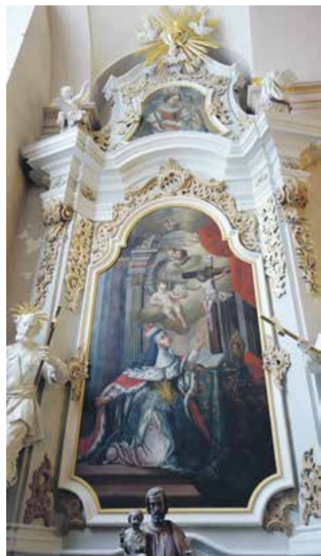
Ołtarz boczny w kościele NMP z Góry Karmel w Głębowicach