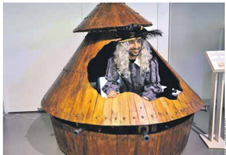
Jednym z ciekawszych eksponatów jest machina bojowa w rodzaju czołgu

Przykładem może być projekt mostu obrotowego, który Leonardo da Vinci stworzył dla Ludwika Sforza, księcia Mediolanu, który byłby łatwy w zapakowaniu i transportowaniu. Wynalazek ten miał pomóc