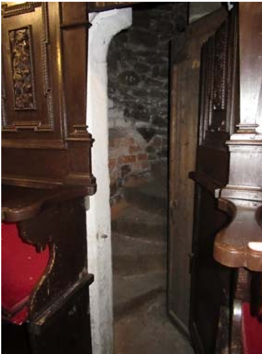
Geheimtür im Chorgestühl mit Blick zur Wendeltreppe Sekretne drzwi w stalli z widokiem na spiralne schody

durch der kath. Geistliche Sonn- und Feiertags von 6 bis 8 Uhr Gottesdienst halten und im Anschluß daran und Nachmittags von 1 bis 3 Uhr konnte der lutherische Gottesdienst gehalten werden und anschließend stand die Kirche den Katholiken wieder zur Verfügung. So waren auch die Wochentage geregelt, der evangel. Gottesdienst von 7 bis 8 Uhr und danach der katholische und Sonnabend sollte gemeinschaftlich gehalten werden, oder der von 1 bis 2 Uhr der katholische und der evangelische anschließend. Diese Gemeinsamkeit wurde abrupt durch den dem kaiserlichen Befehl beendet. Danach mußte der evangelische Pfarrer Röhrich am 29. Okt. 1650 die Kirchenschlüssel dem Magistrat der Stadt Hirschberg übergeben.