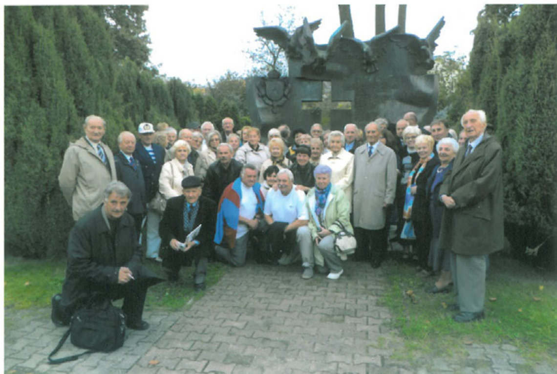
Odrestaurowany Pomnik Obrońców Lwowa we Wrocławiu na cmentarzu Świętej Rodziny z uczestnikami obchodów XXV-lecia Towarzystwa Miłośników Lwowa i Kresów Południowo-Wschodnich

PISMO TOWARZYSTWA MIŁOŚNIKÓW LWOWA I KRESÓW POŁUDNIOWO-WSCHODNICH. WROCŁAW