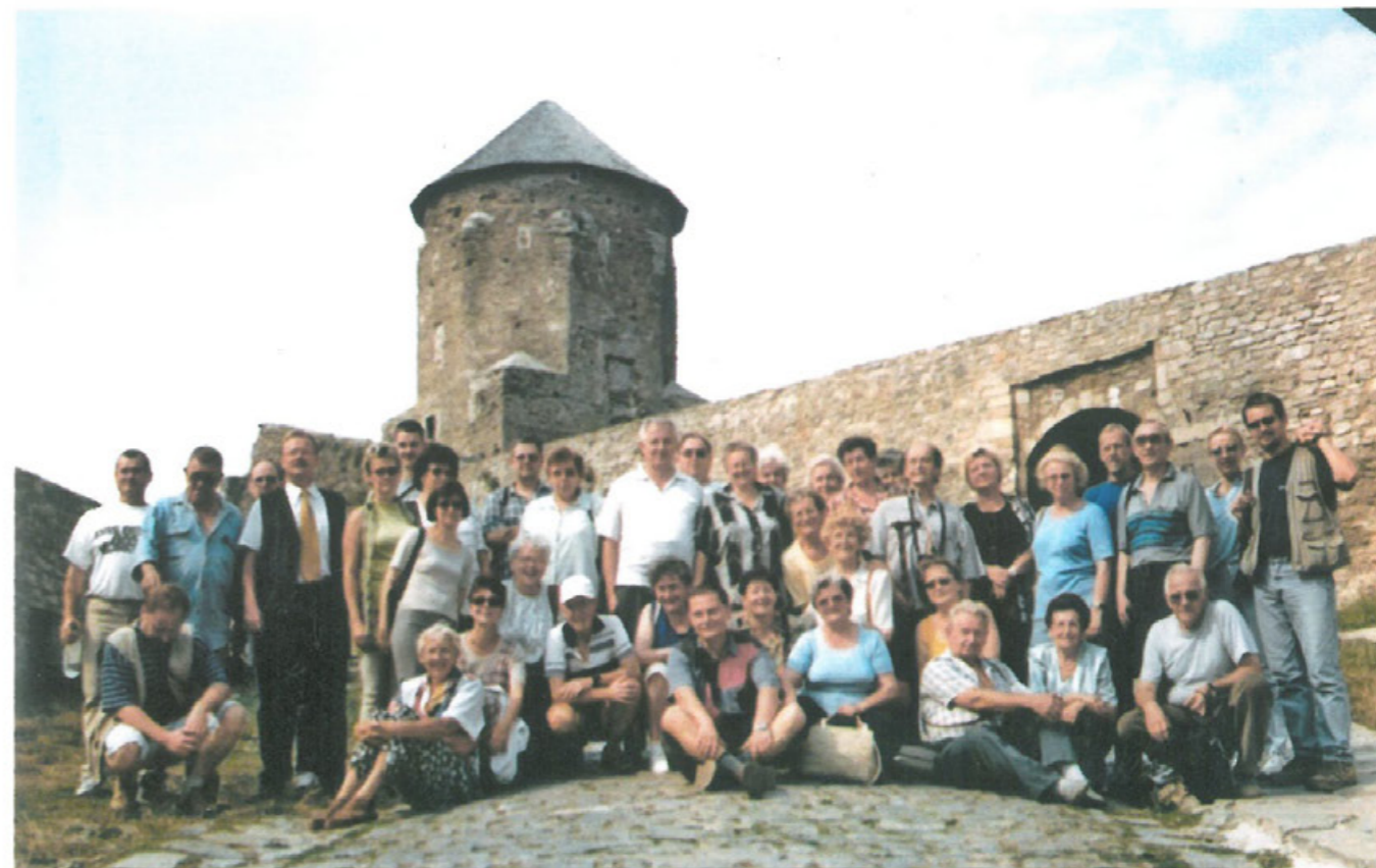
Pierwsza wycieczka członków Oddziału TMLiKPW w Pile na Kresy w sierpniu 2001 r.