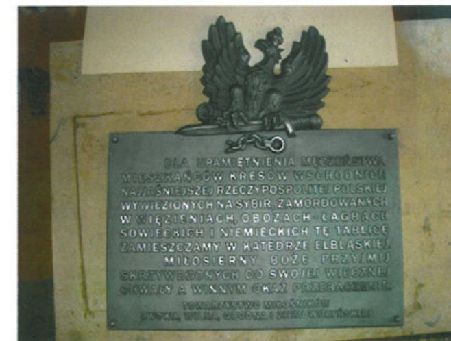
Tablica pamiątkowa w Katedrze Elbląskiej