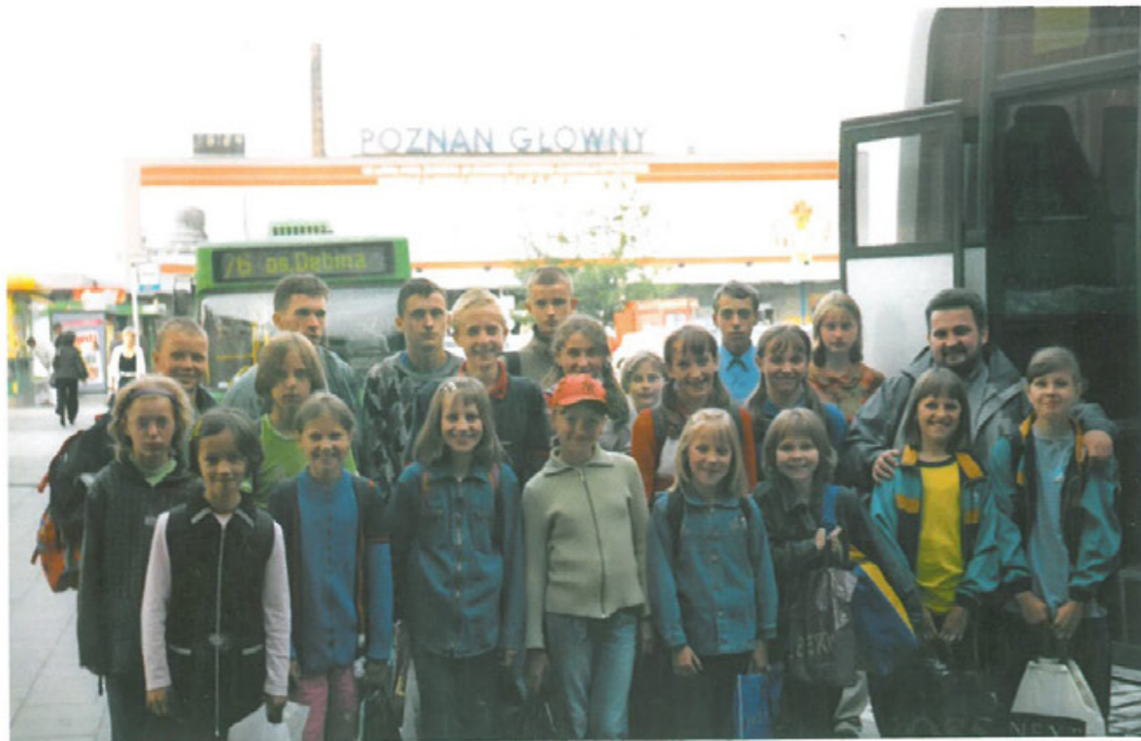
Kolonie dzieci ze Strzelczysk w 2003 r.