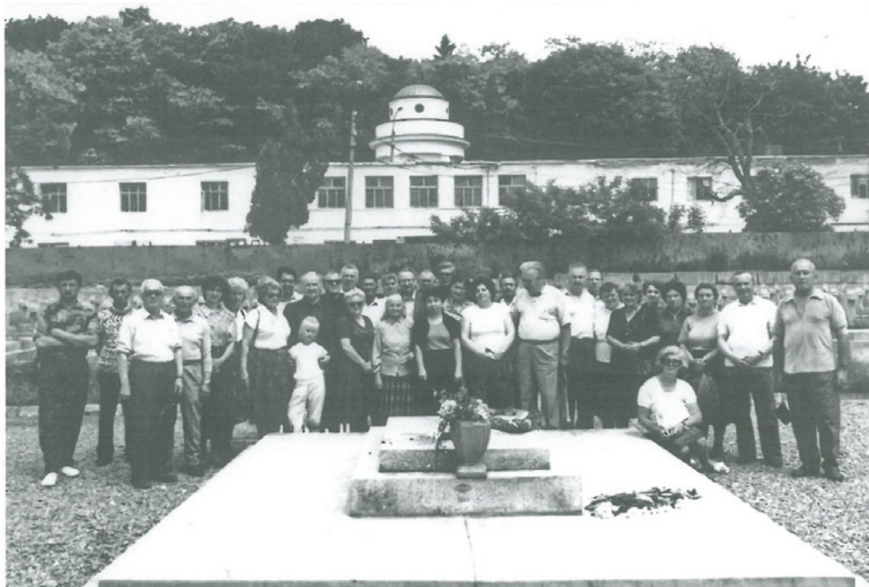
I pielgrzymka do Rudek i Lwowa