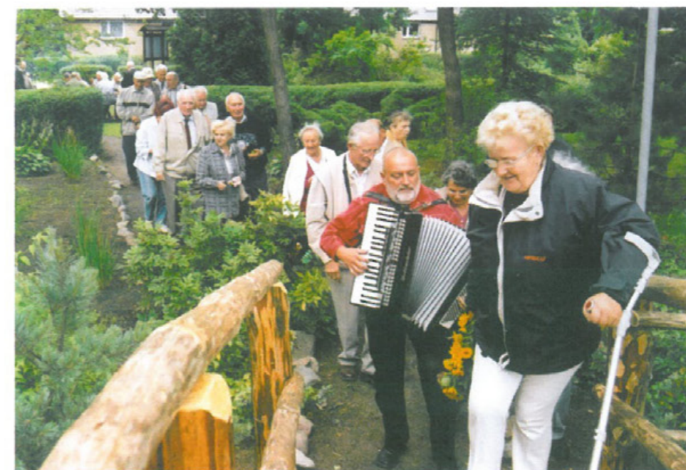
Każdego roku ok. 24 czerwca na spotkaniu plenerowym Oddziału TMLiKPW przy akompaniamencie akordeonu puszczanie wianków na wodę (2008 r.)