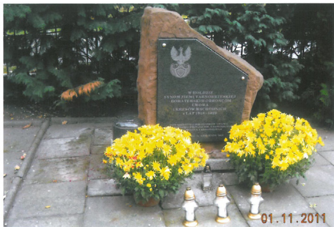
Dzień Wszystkich Świętych – obelisk poświęcony synom Ziemi Tarnobzeskiej walczącym i poległym w obronie Lwowa i Kresów Południowo-Wschodnich w latach 1918–1920.