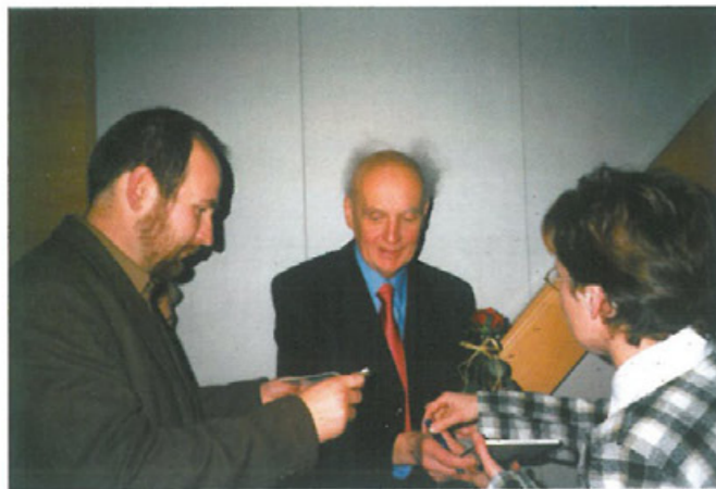
Spotkanie z kompozytorem Wojciechem Kilarem