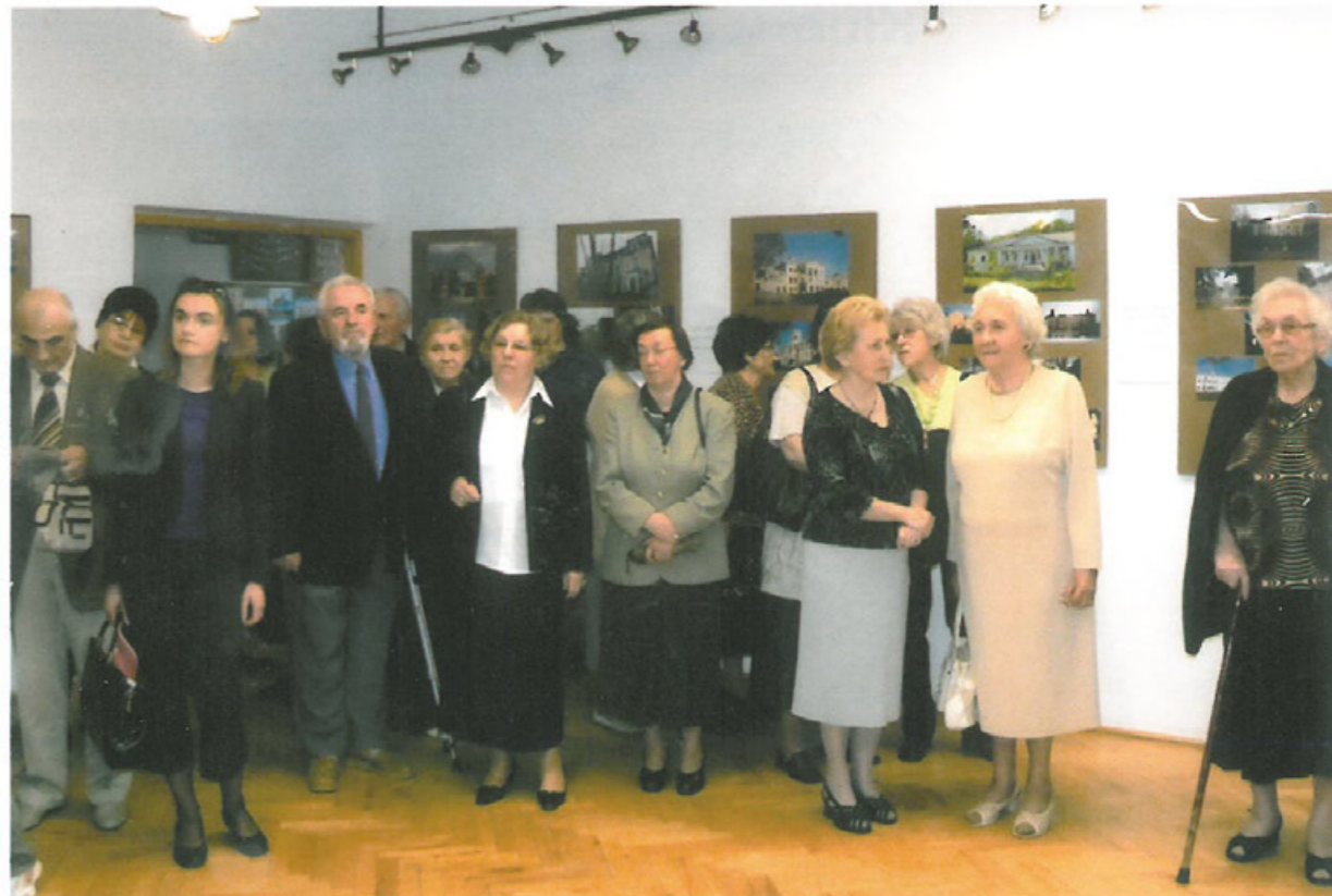
Otwarcie wystawy fotograficznej