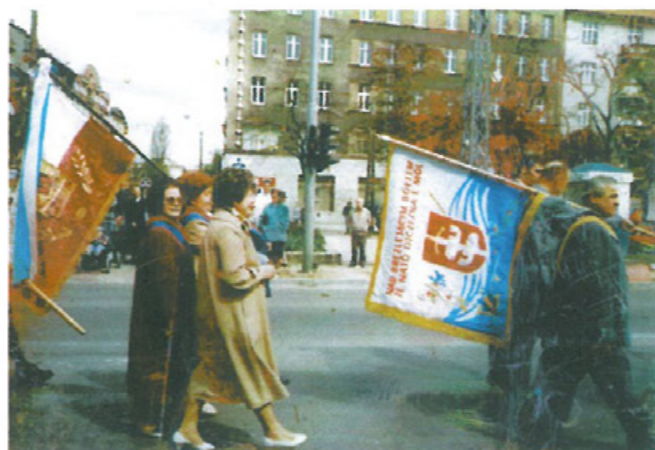
Członkowie na manifestacji w Gdyni