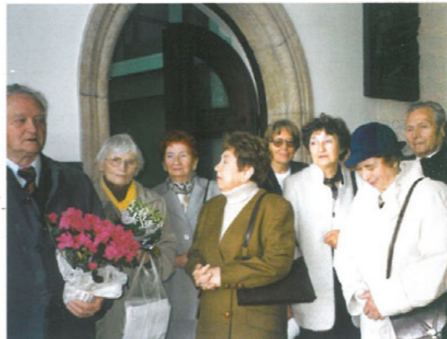
Krypta Katedry Chrystusa Króla w Katowicach. Msza św. na rozpoczęcie XV-lecia Oddziału.