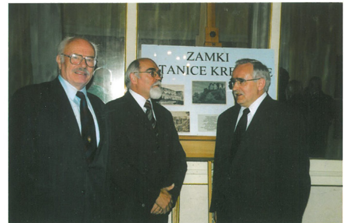
Prezydent Jeleniej Góry otwiera wystawę „Zamki i Stanice Kresowe”.