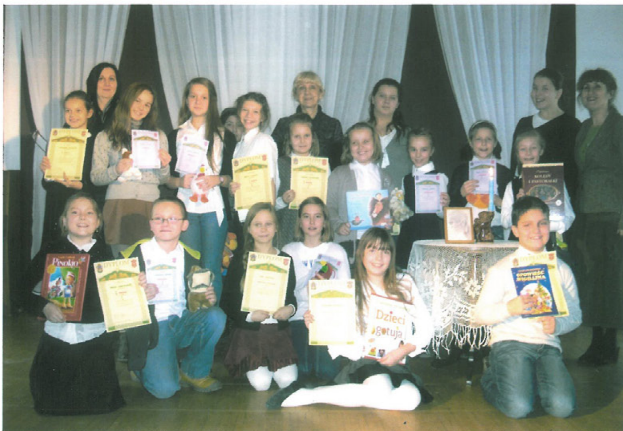
Najdłuższy stażem jest organizowany w grudniu Konkurs Recytatorski Poezji Lwowskiej i Kresowej im. Mariana Hemara. Odbyły się już 23 edycje tego konkursu dla dzieci i młodzieży szkolnej, w których wzięło udział 1200 uczestników.