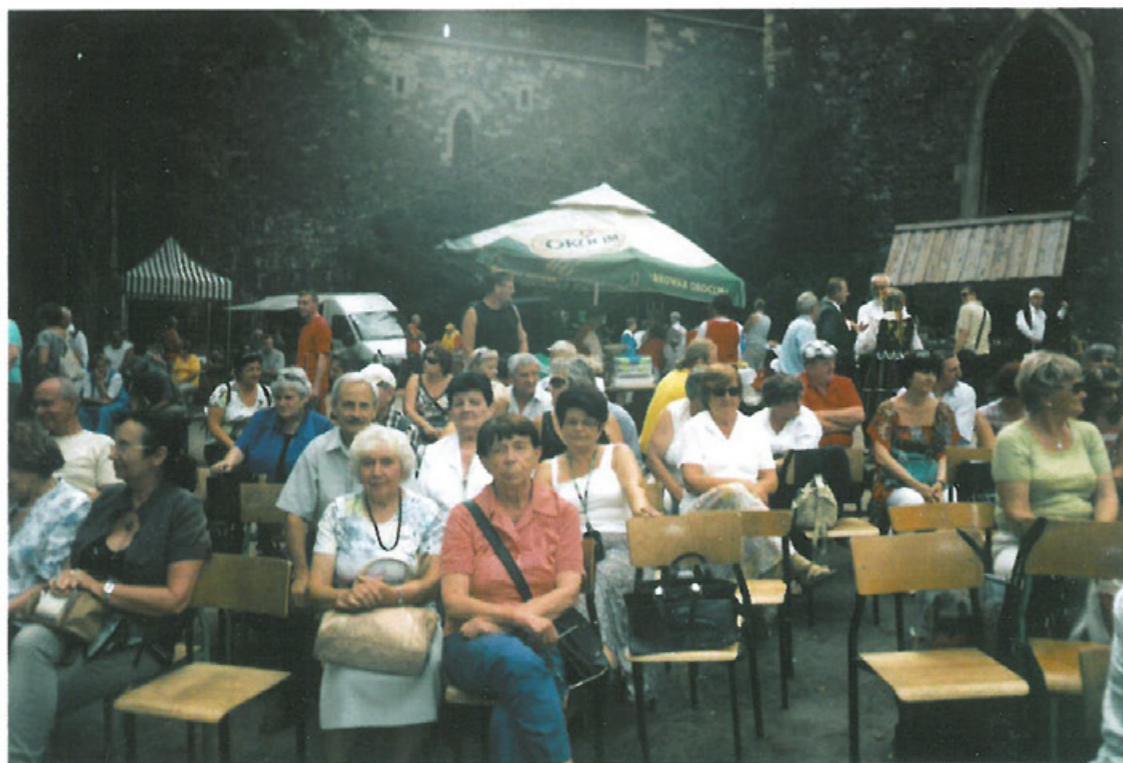
Spotkanie grupy członków TMLiKPW Legnica na Zamku Chojnik – Biesiada Kresowa