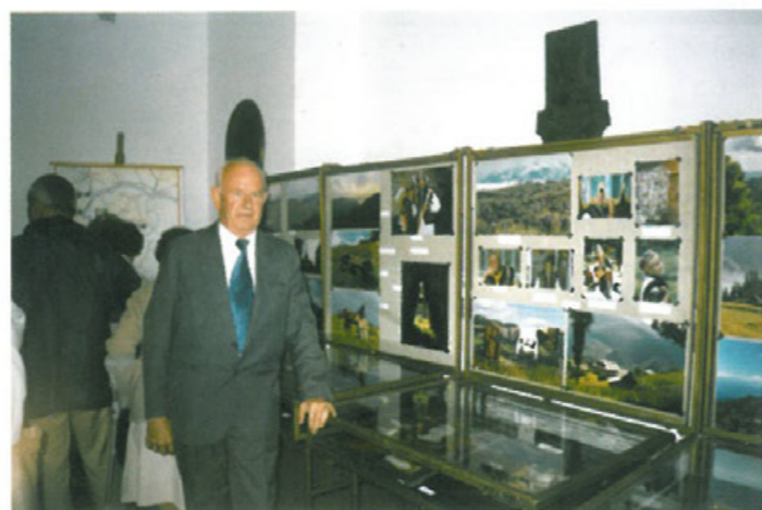
V Dni Lwowa. Wystawa pt. „Karpaty Wschodnie – Huculszczyzna 2002 r.”