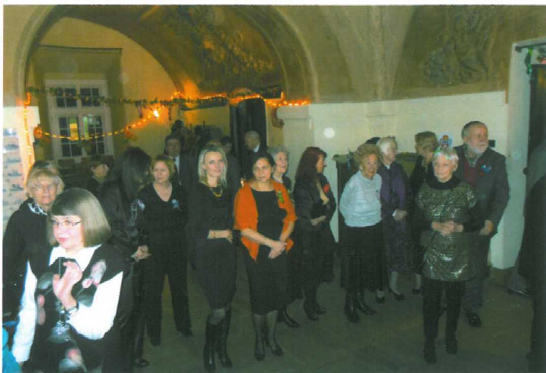
Lwowski bal karnawałowy w Krakowie