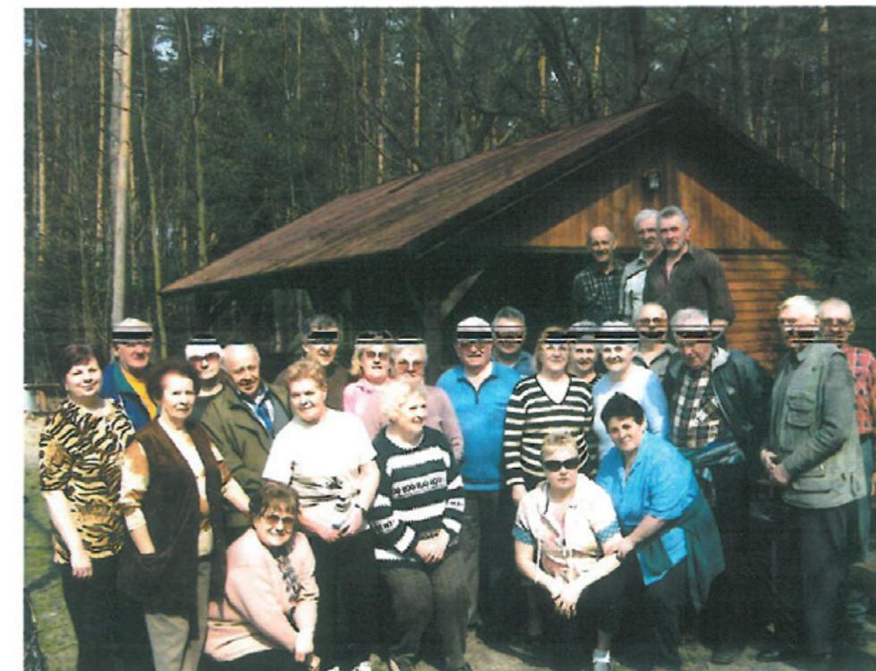
Milicki Klub Kresowiaków podczas sadzenia lasu w Świętoszynie