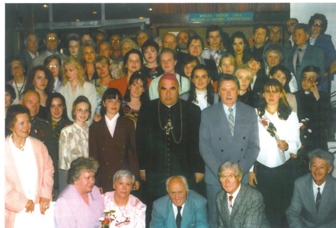
Pożegnanie słuchaczy Studium Nauczycielskiego ze wschodu