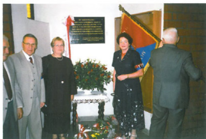
Członkowie Zarządu w Tychach pod tablicą upamiętniającą ludobójstwo na Kresach