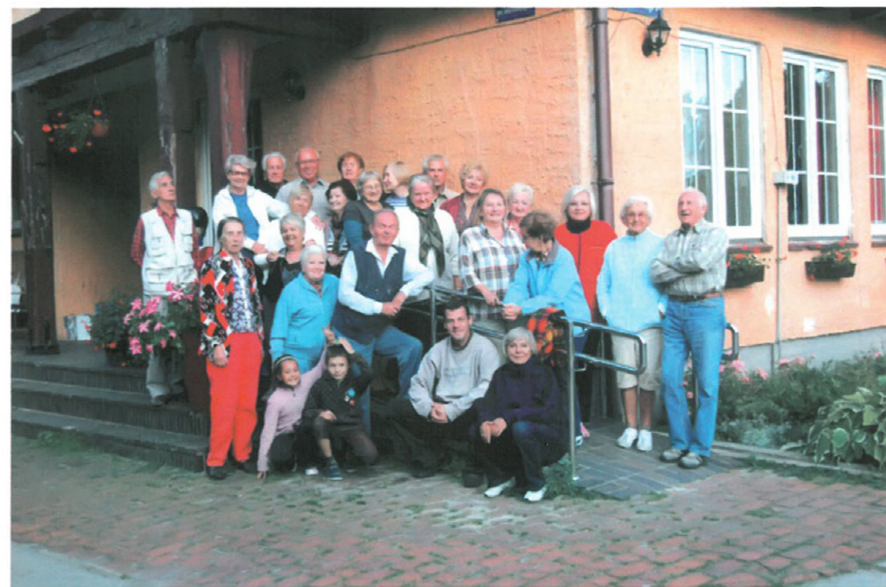
Zjazd Tłumaczan w Mielnie Unieściu, wrzesień 2011 r.