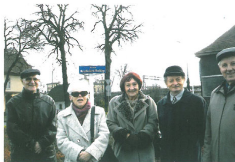
Członkowie Zarządu Oddziału TMLiKPW podczas uroczystości nadania imienia Marszałka Józefa Piłsudskiego rondu przy dworcu PKP w Pile w dniu Święta Niepodległości w 2008 r.