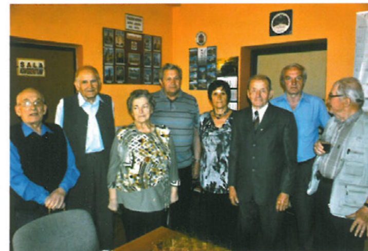
Siedziba Zarządu Oddziału TMLiKPW