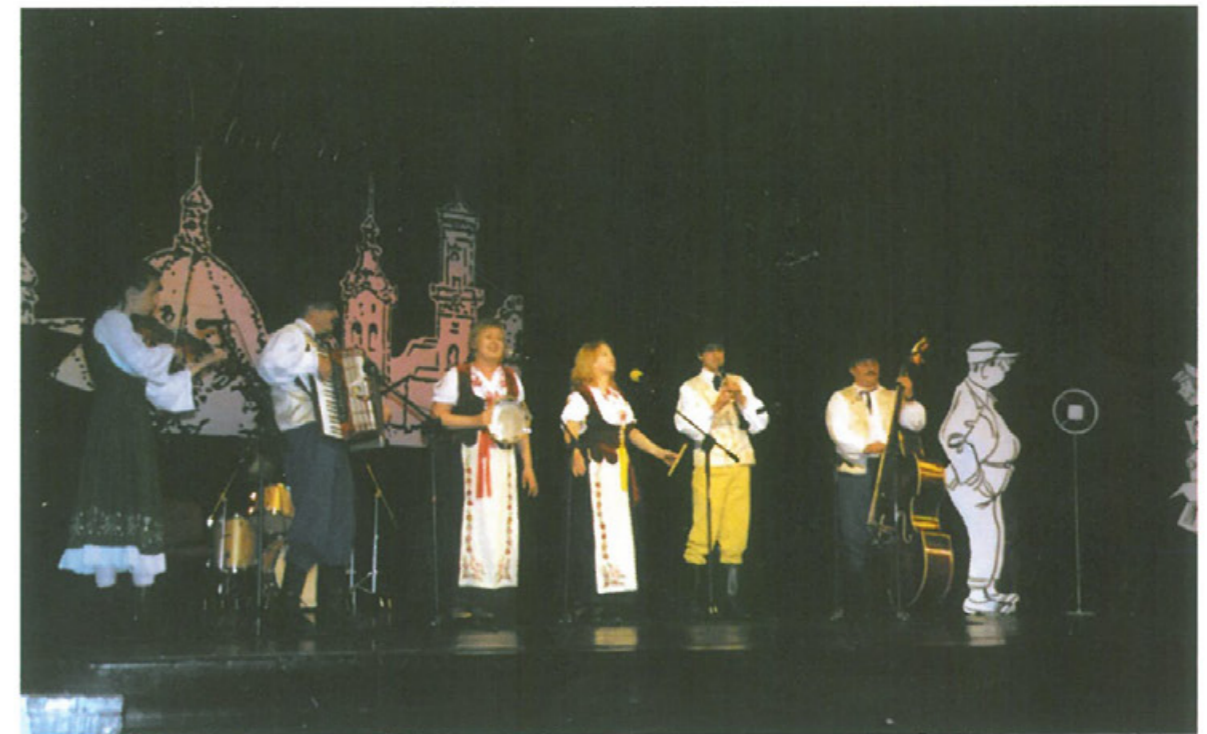
Zespół „Każdy Sobie” zdobywa nagrodę Grand Prix.