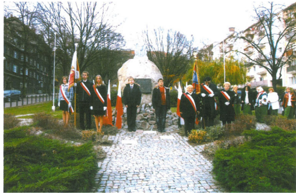
Poczty sztandarowe Zespołu Szkół nr 21 im. Orłąt Lwowskich i Gorzowskiego Oddziału TMLiKPW przy pomniku-obelisku Orłąt Lwowskich w Gorzowie Wielkopolskim