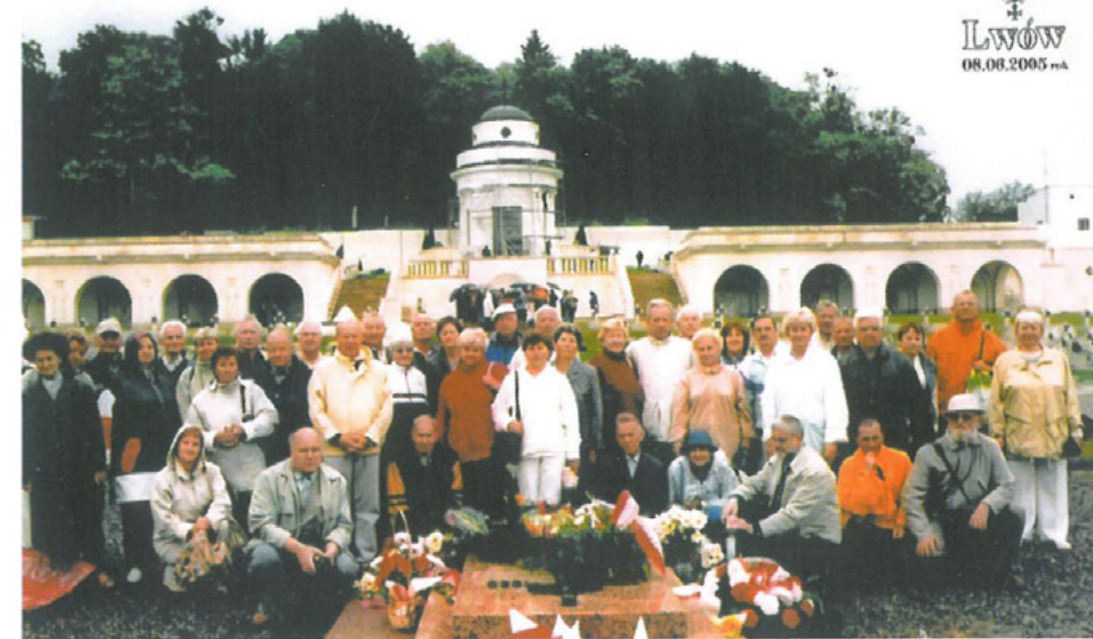
Członkowie Klubu Koźuchowskiego na Cmentarzu Obońców Lwowa w 2005 r.