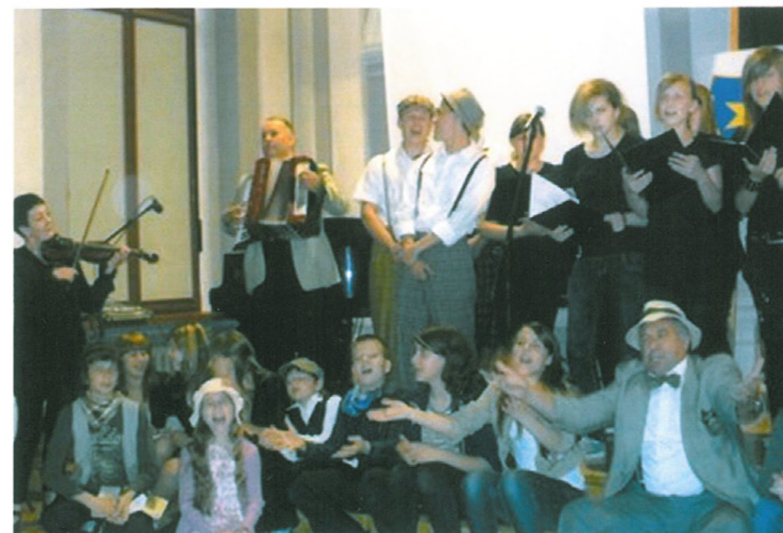
Dni Lwowa w Tarnowie znalazły swą trwałą pozycję w kalendarzu miejskich imprez kulturalnych. Biorą w nich udział władze i społeczeństwo Tarnowa oraz liczni goście, w tym z ZG TMLiKPW, z innych oddziałów oraz goście ze Lwowa.