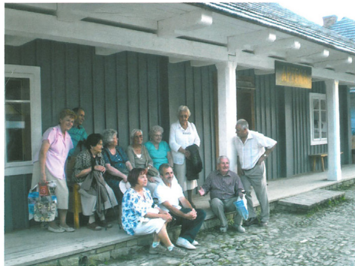
Spotkanie na Rynku Galicyjskim (skansen)