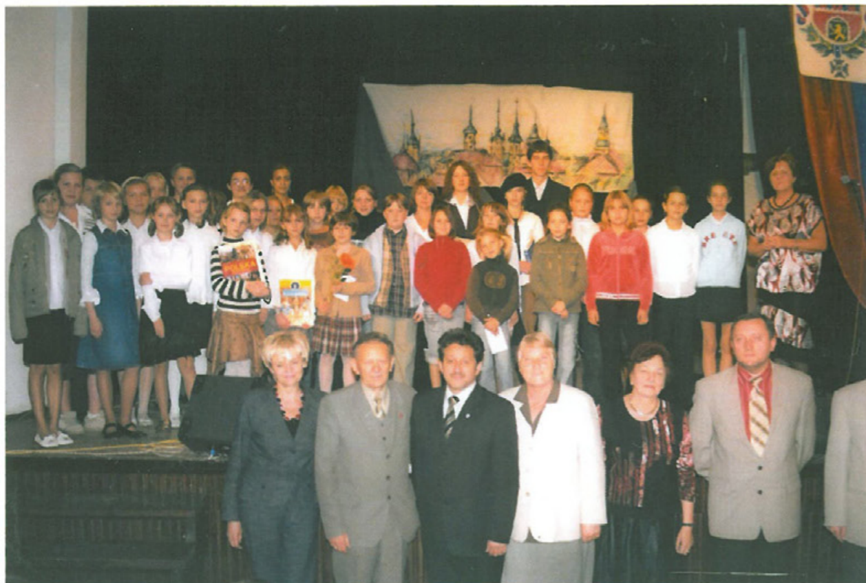
Uczestnicy VIII Konkursu Poezji i Piosenki Lwowskiej Świdwin 2007 r. z władzami powiatu, jury konkursu i organizatorami