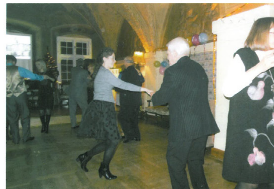
Lwowski bal karnawałowy w Krakowie