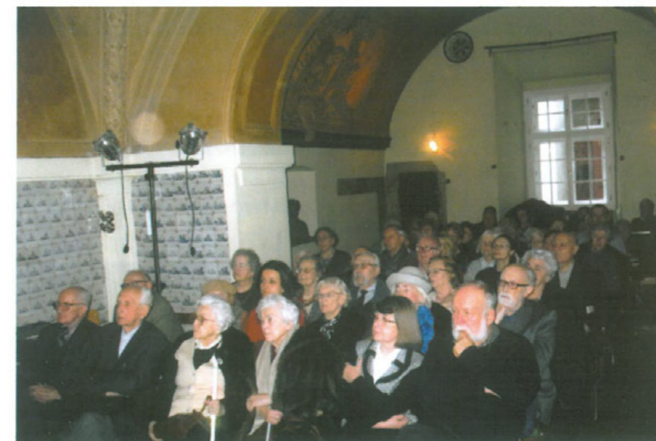
Jedno ze spotkań comiesięcznych w Klubie