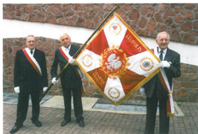
Prezentacja Sztandaru TMLiKPW w Tychach