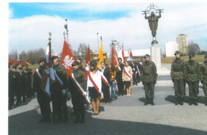
Uroczystości upamiętniające Katyń i Smoleńsk. Uczniowie, harcerze, cywilna ludność w Tychach, 2012 r.