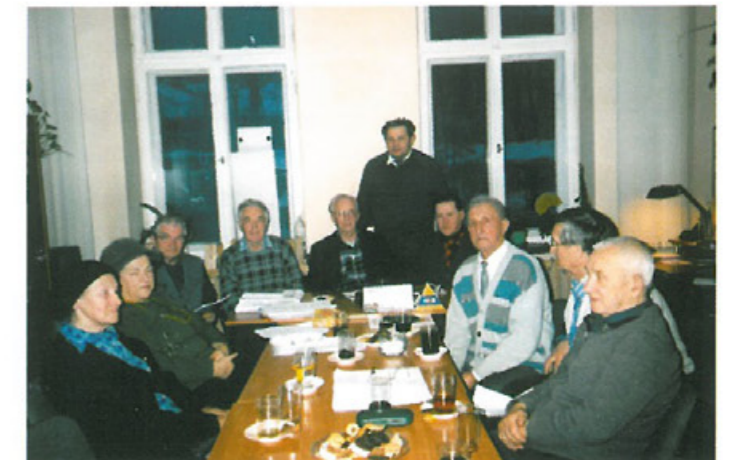
Zarząd Oddziału wśród Przyjaciół