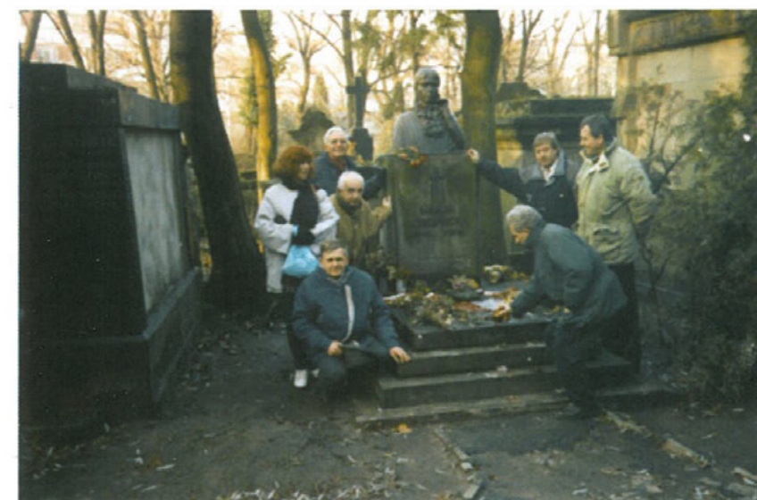
Wizyta na Cmentarzu Łyczakowskim przed grobem M. Konopnickiej w 1994 r.