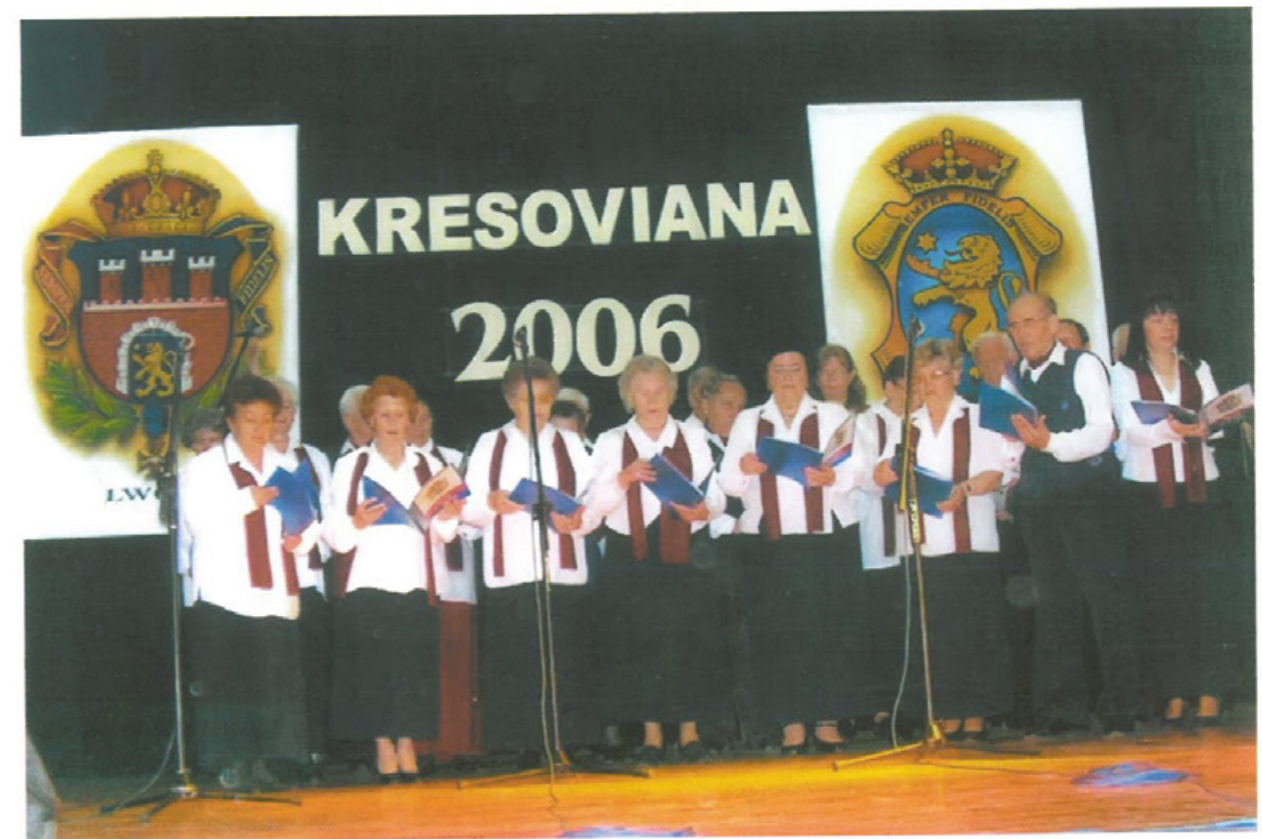
Chór „Ta Jój” Gorzowskiego Oddziału TMLiKPW na Regionalnym Spotkaniu Wykonawców Piosenki Kresowej „Kresoviana”