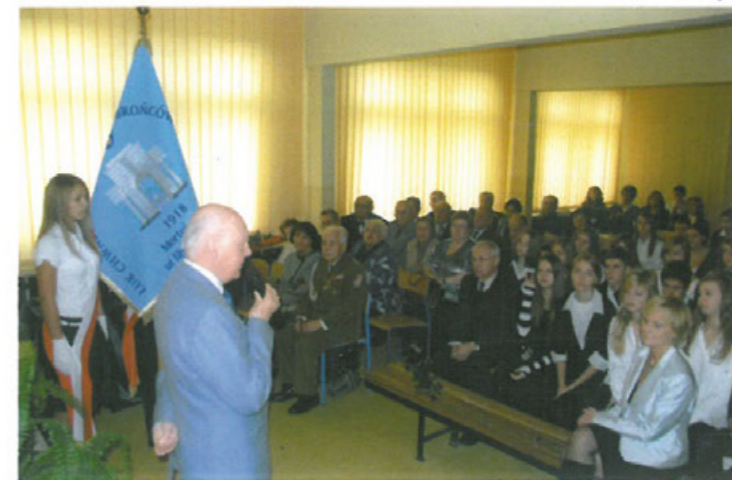
Uroczystość Święta Niepodległości i Obrony Lwowa w Gimnazjum nr 65 im. Orłąt Lwowskich w 2009 r.