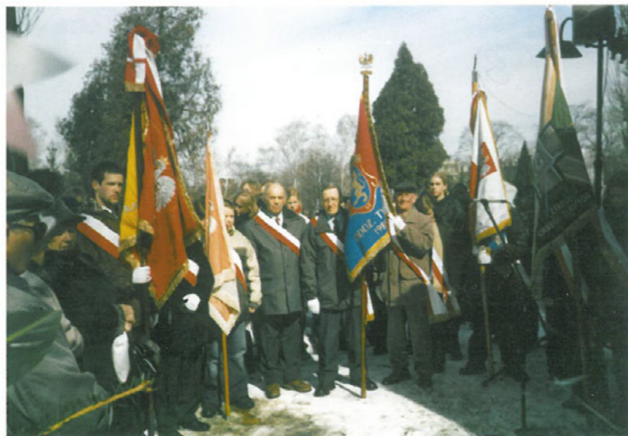
Poświęcenie tablicy upamiętniającej Pomordowanych Polaków na Wschodzie, 14 III 2005 r.