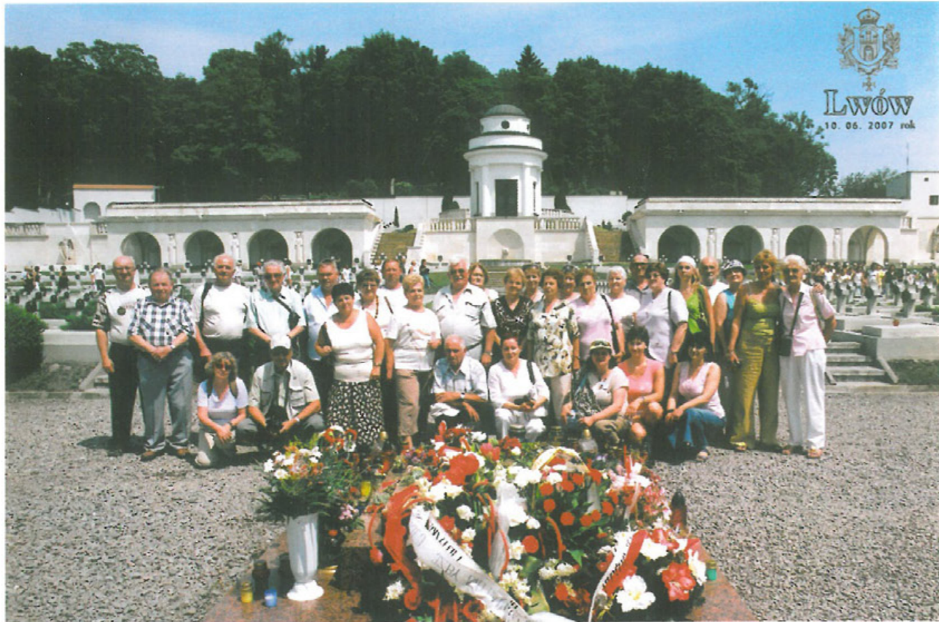
Kresowiaci z Milicza na Cmentarzu Obrońców Lwowa w 2007 r.