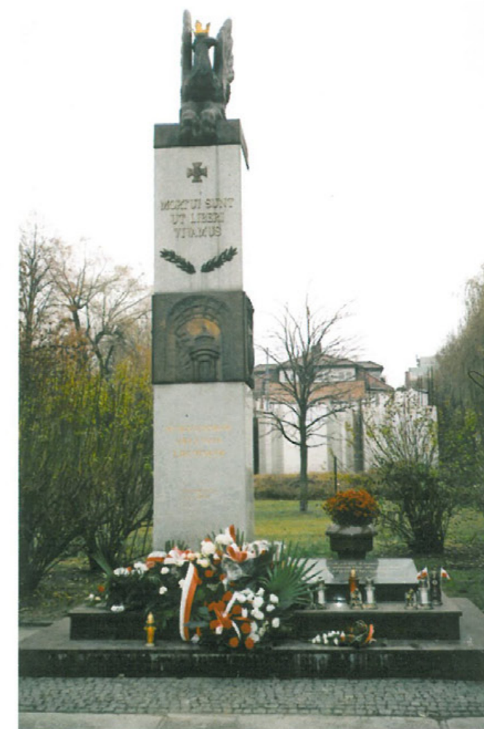
Pomnik Orłąt Lwowskich w Częstochowie odsłonięty i poświęcony 9 czerwca 2006 r. Autor: artysta rzeźbiarz Szymon Wypych. Architekt: Mariusz Błażewicz. Wysokość pomnika – 6 m.