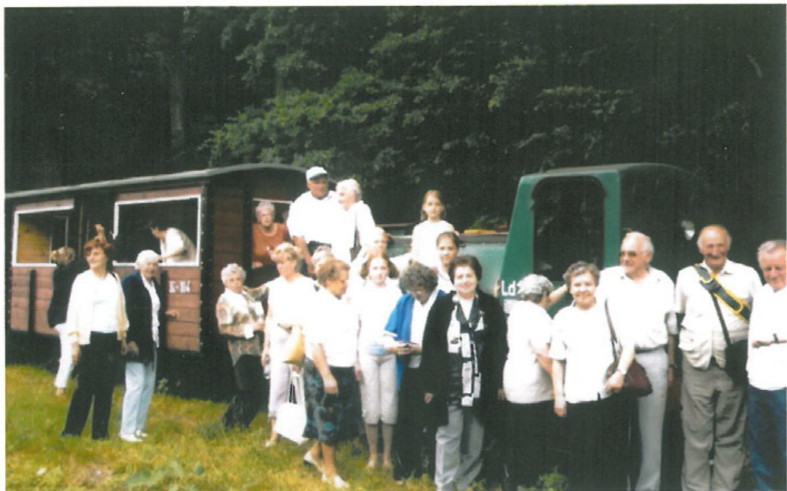
19 czerwca 2005 roku z okazji jubileuszu 5-lecia Oddziału uczestniczyliśmy w Mszy św. odprawionej w naszej intencji w Sanktuarium Maryjnym w Górcie Klasztornej.