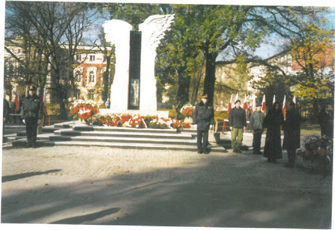
Urna z ziemią z Kresów