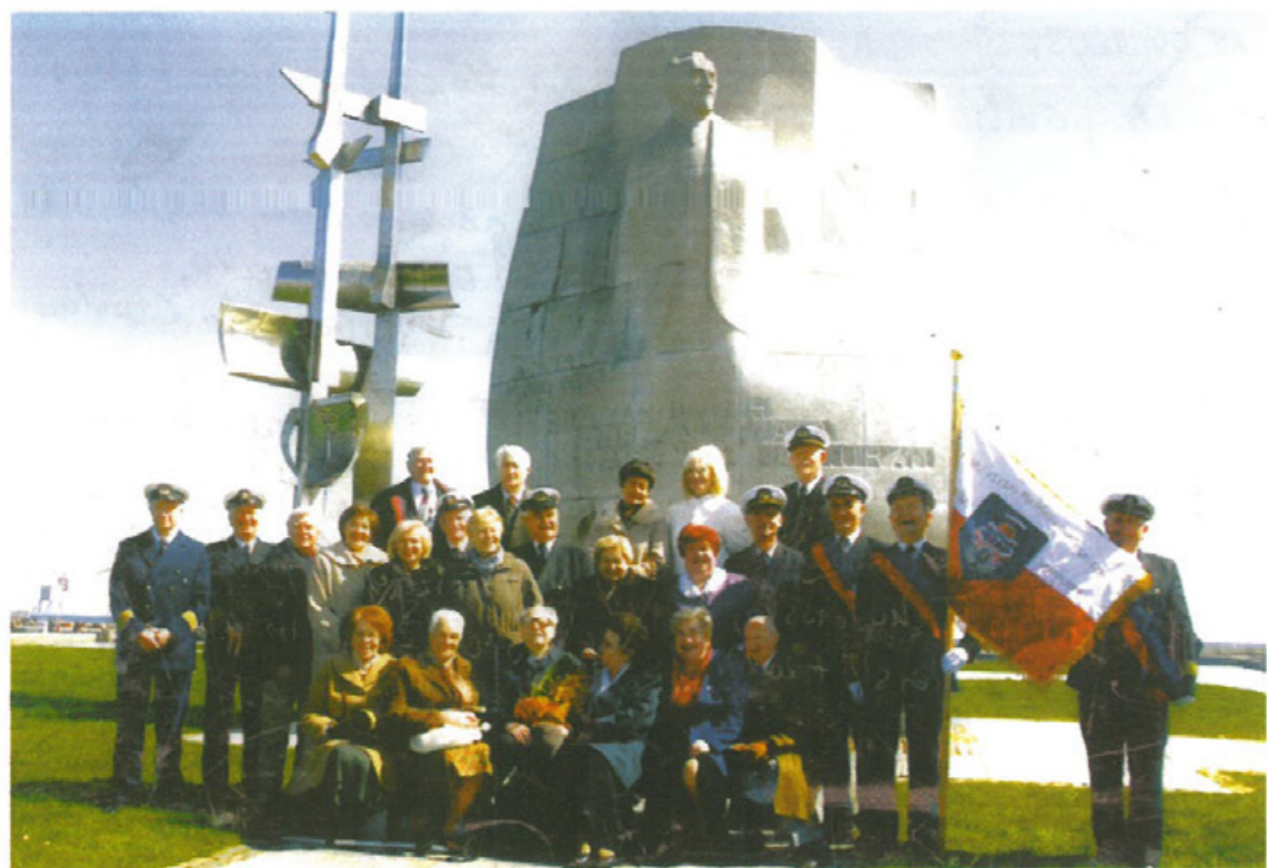
Poświęcenie sztandaru Stowarzyszenia Miłośników Lwowa i Kresów Południowo-Wschodnich II RP. Gdynia 19.04.2009 r.