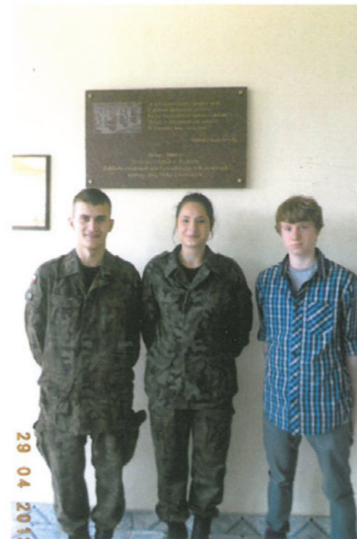
Tablica nadania ZS i ZDZ imienia Orłąt Lwowskich, w Tychach i Katowicach