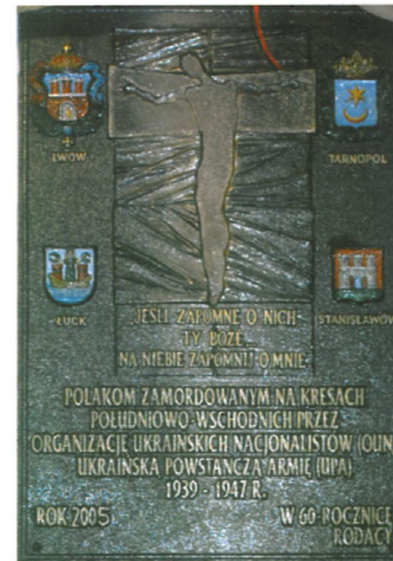
Tablica pamiątkowa poświęcona w kościele koźuchowskim ofiarom zamordowanym na Kresach przez OUN i UPA