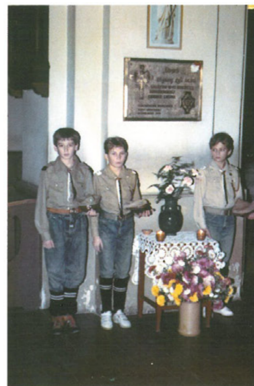
Tablica pamiątkowa „Bohaterskich Obrońców Lwowa”