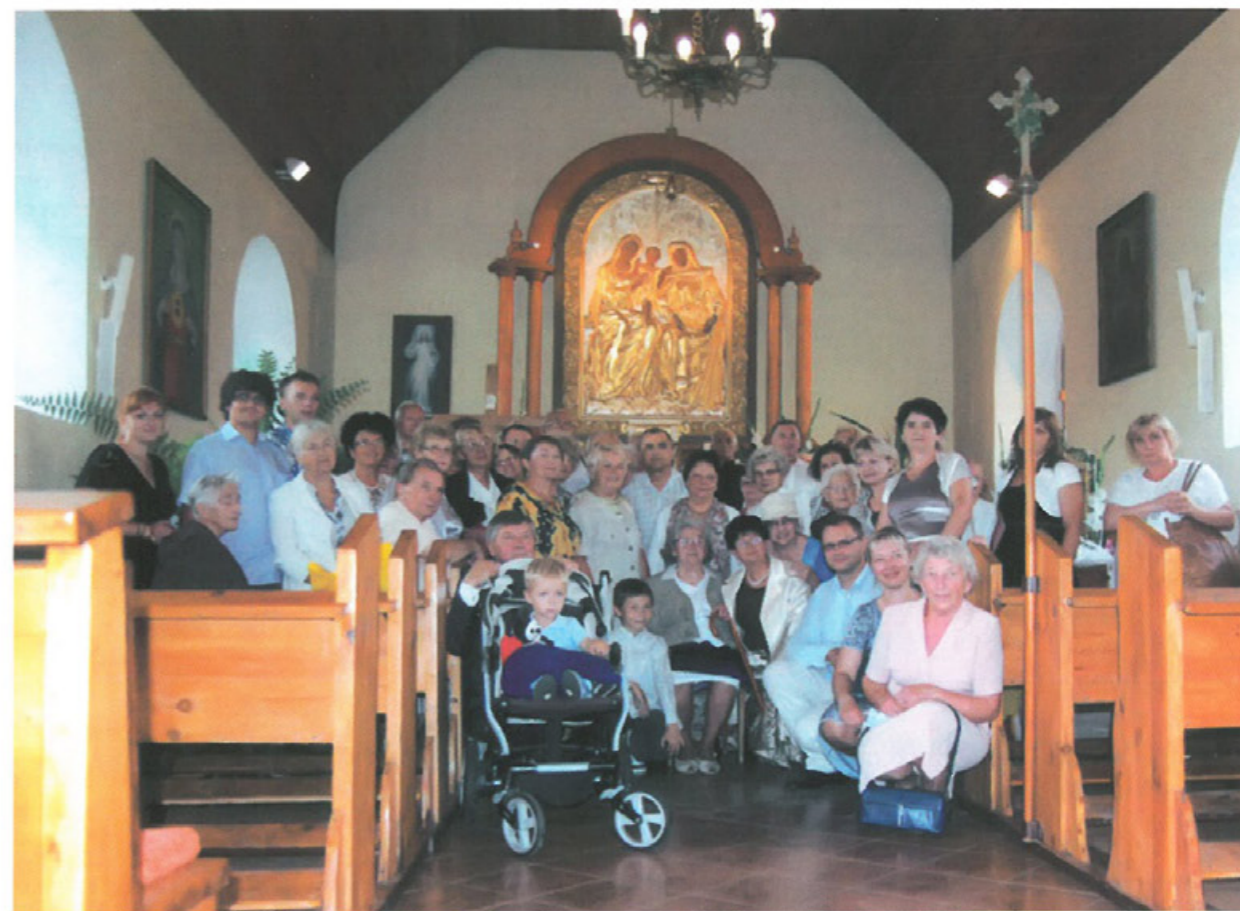
Tłumaczanie u stóp obrazu św. Anny Samotrzeciej w Siedlakowicach, lipiec 2012 r.