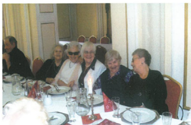
Ciągle młode Tłumaczanki na spotkaniu opłatkowym w Dworze Polskim, Wrocław 2011 r.