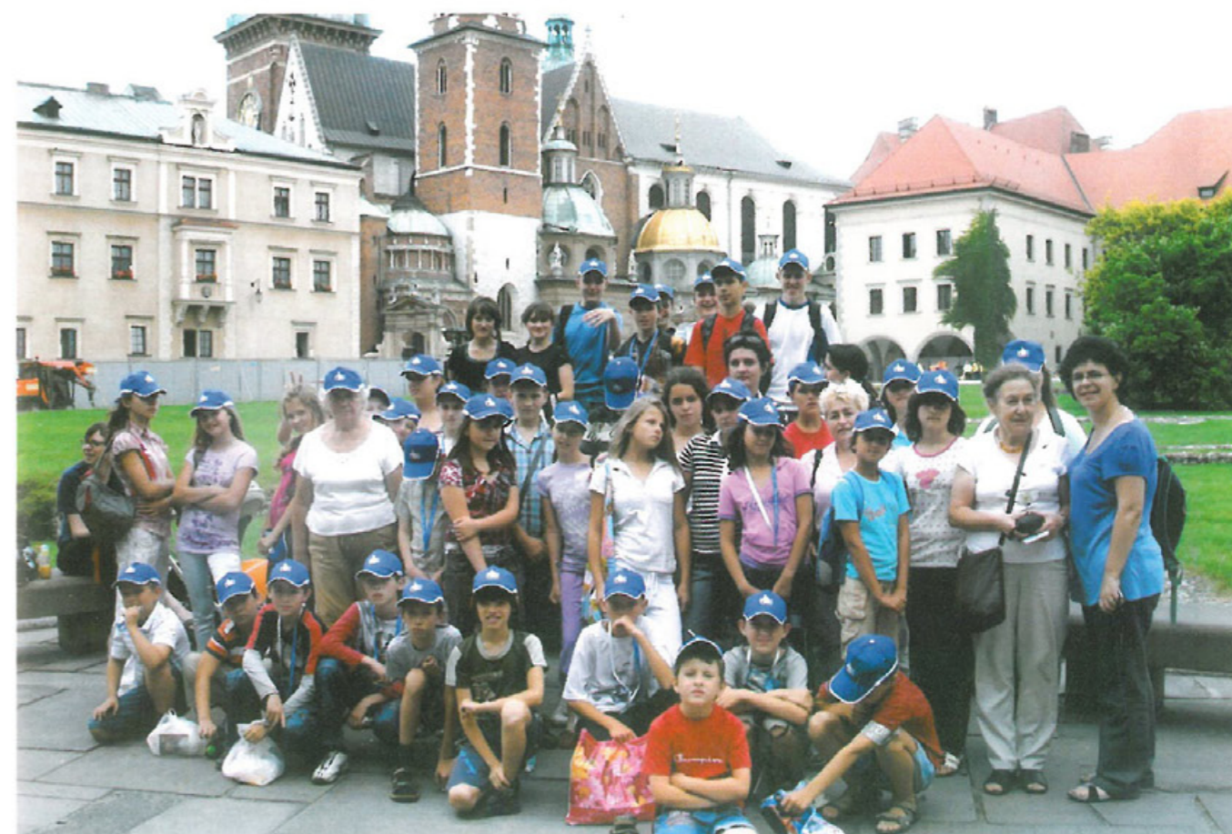
Organizacja edukacyjnych kolonii letnich dla dzieci pochodzenia polskiego z Kresów Wschodnich jest niemal od początku istnienia Oddziału corocznie wykonywanym zadaniem.