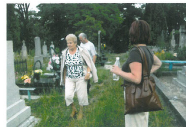
Odwiedzanie grobów, odnajdywanie swoich krewnych, porządkowanie cmentarza