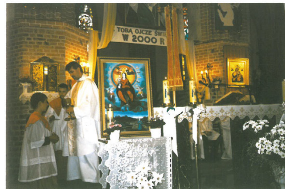
Klub ofiarował Kopię Cudownego Obrazu Matki Bożej Łaskawej z Katedry Lwowskiej kościołowi pw. MBNP w Świdwinie podczas Mszy Świętej IV Dnia Kultury Kresowej, 4.06.2000 r.