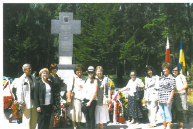
Czarny Las k. Stanisławowa jest miejscem zbrodni dokonanej przez hitlerowców na stanisławowskiej inteligencji.