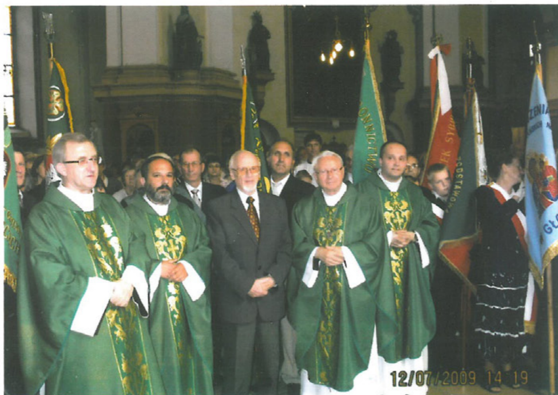
Udział w uroczystej Mszy św. w kościele św. Jana Chrzciciela – poświęconej pamięci pomordowanych na Kresach