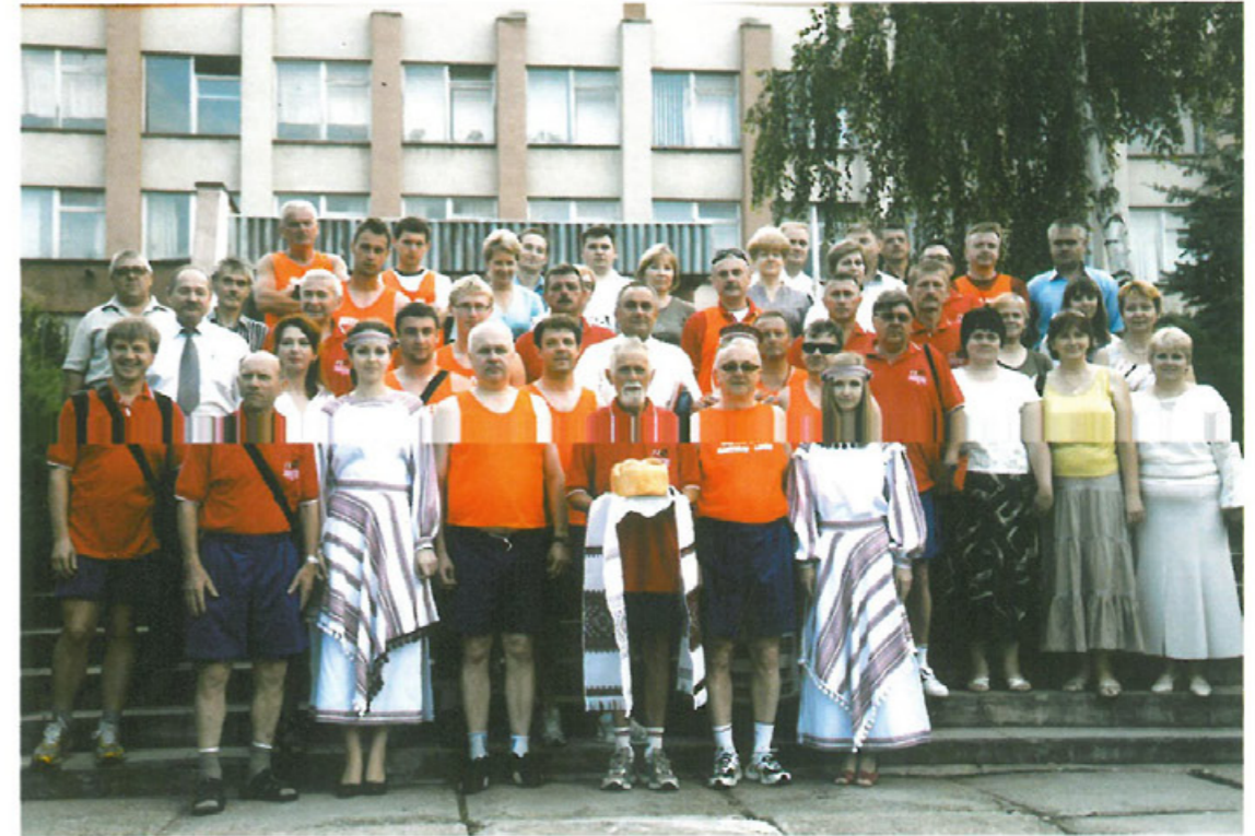
Sztafeta Przyjaźni w Koledżu Agrarnym w Zaleszczykach