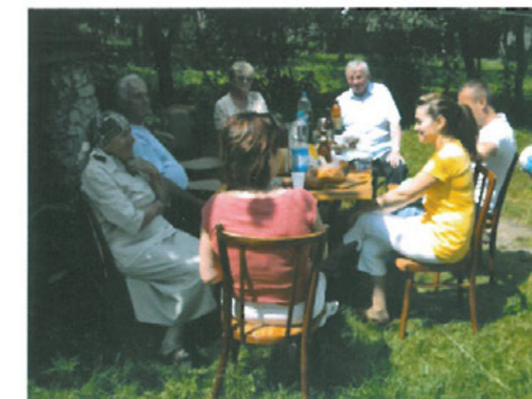
Rodzinne spotkania na Kresach, wspomnienia z dawnych lat