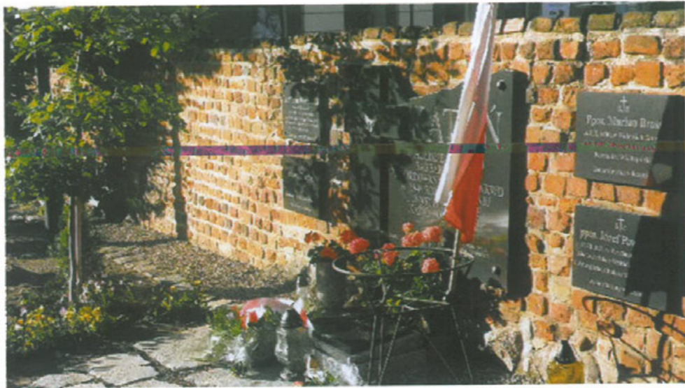
Tablica-Krzyż Katyński z ziemią, postawiony przez Oddział Gniezno w 2005 r.