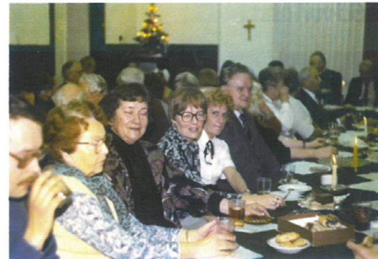
Jedno ze spotkań „opłatkowych” w Katowicach