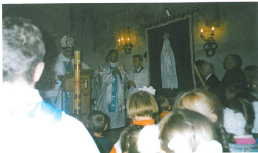
Delegaci Gnieźnieńskiego Oddziału przekazują parafii w Strzelczyskach chorągiew.