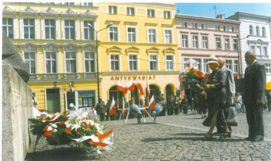
Delegacja Oddziału TMLiKPW w Bydgoszczy składa pod pomnikiem kwiaty, 3 maja 2005 r.