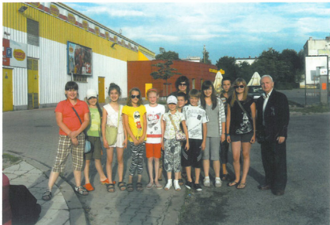
Kolonie letnie. Grupa uczniów Szkoły Średniej nr 10 im. Marii Magdaleny ze Lwowa przed wyjazdem z Częstochowy do Gdańska-Świbno na dwutygodniowe kolonie letnie organizowane przez Oddział TMLiKPW w Częstochowie i Urząd Miasta w okresie 28.07–12.08.2012 r.