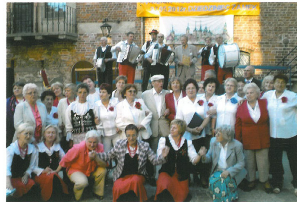
Final XVI Dnia Kultury Kresowej Świdwin 2012. Zespoły z Koszalina: Kapela Przylesianie, Bałtyk, Złote Nutki i Swojacy z Sitna