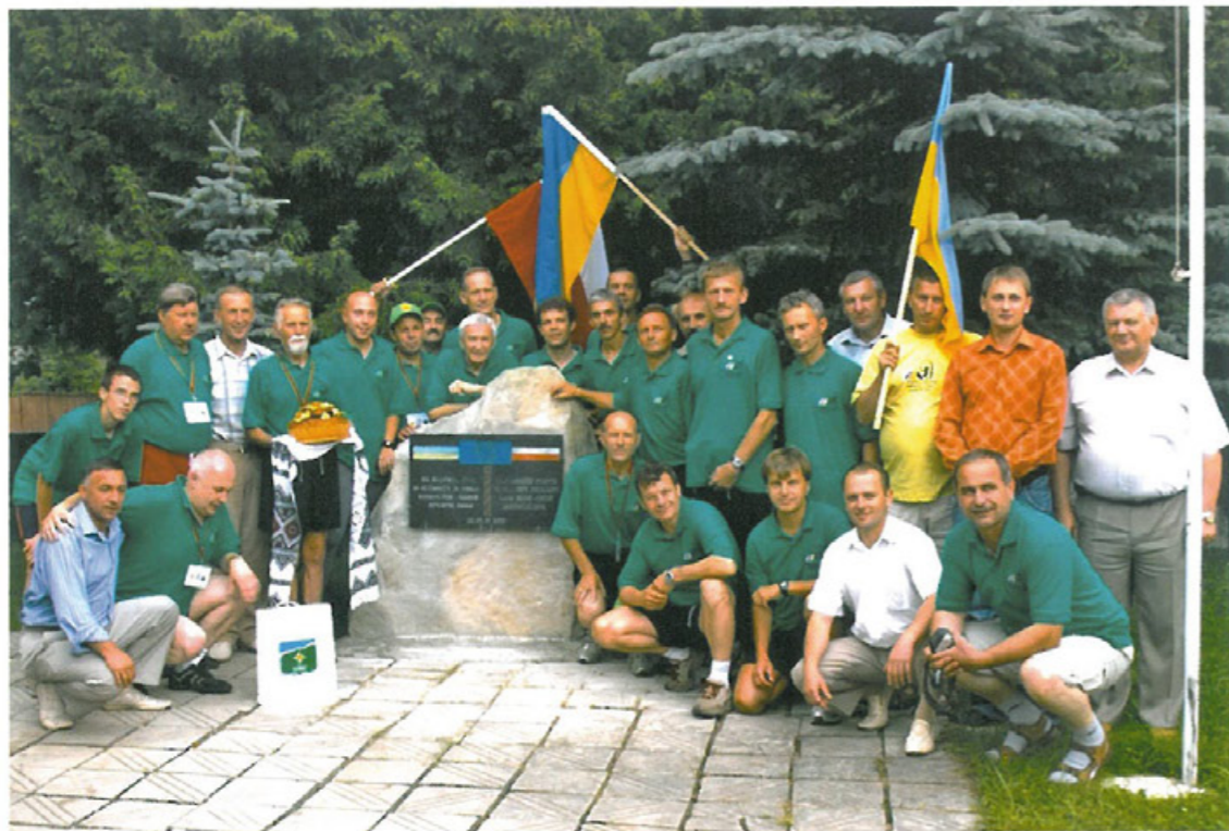
Sztafeta Przyjaźni TML Namysłów z zaprzyjaźnionym miastem Jaremcze