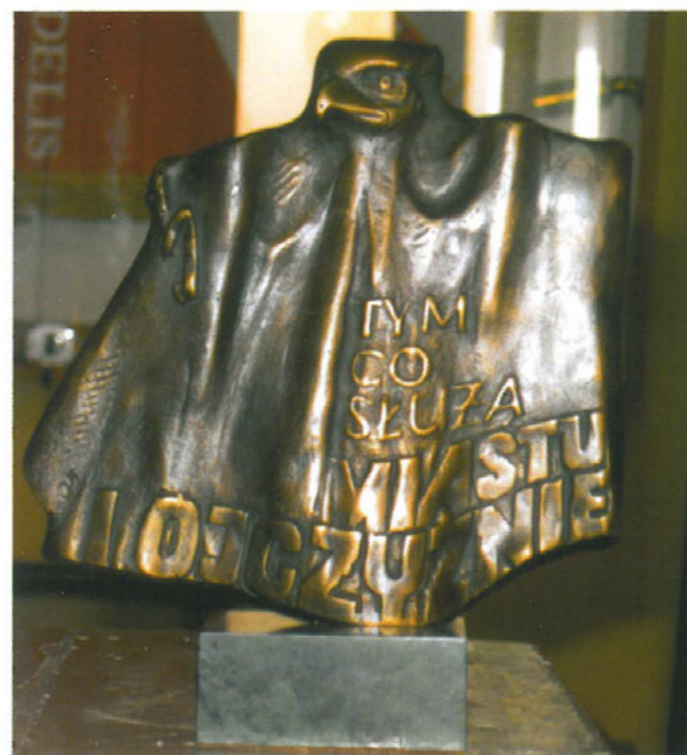
Nagroda Prezydenta Miasta Częstochowy za działalność społeczną i humanitarną, 23 września 2010 r.