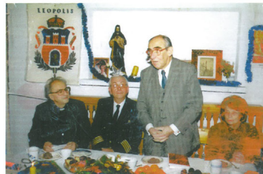
Spotkanie opłatkowe członków Klubu