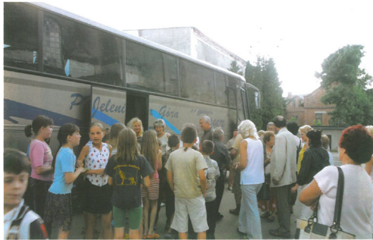
Przekazanie darów dzieciom polskim w Przemyślanach