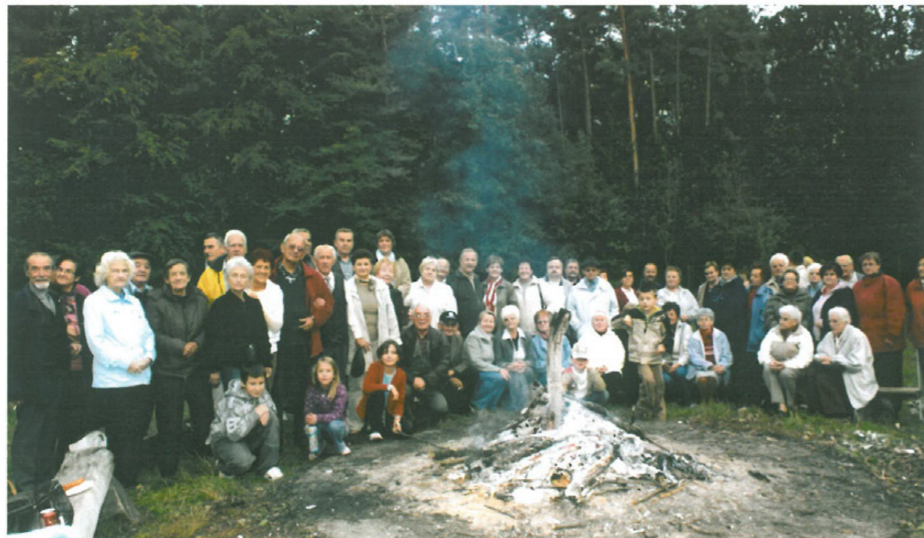
Pożegnanie lata w Karczmie Borowej w październiku 2003 r.