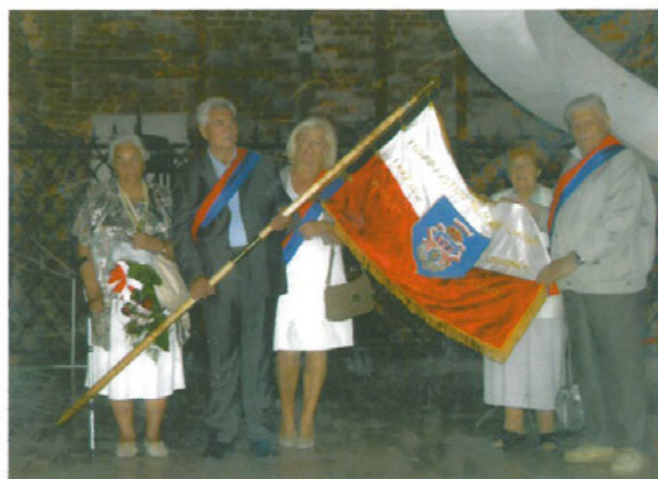
Uroczystości w 2012 r. w kościele św. Brygidy w 69. rocznicę mordów na Wołyniu