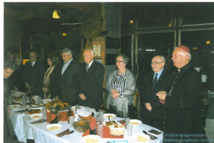
Wigilia kresowiaków w 2012 r.