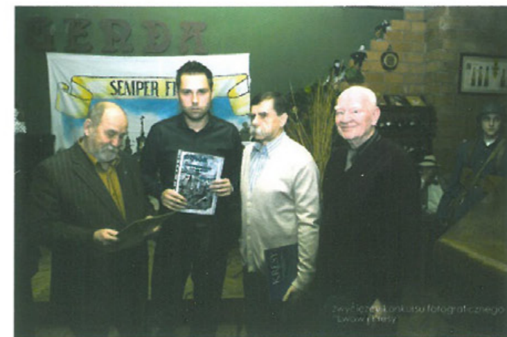
Zwycięzcy konkursu fotograficznego „Lwów i Kresy”