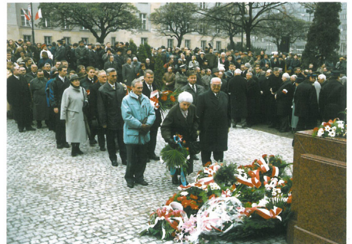
Składanie kwiatów w dniu 11 listopada pod pomnikiem Marszałka Józefa Piłsudskiego