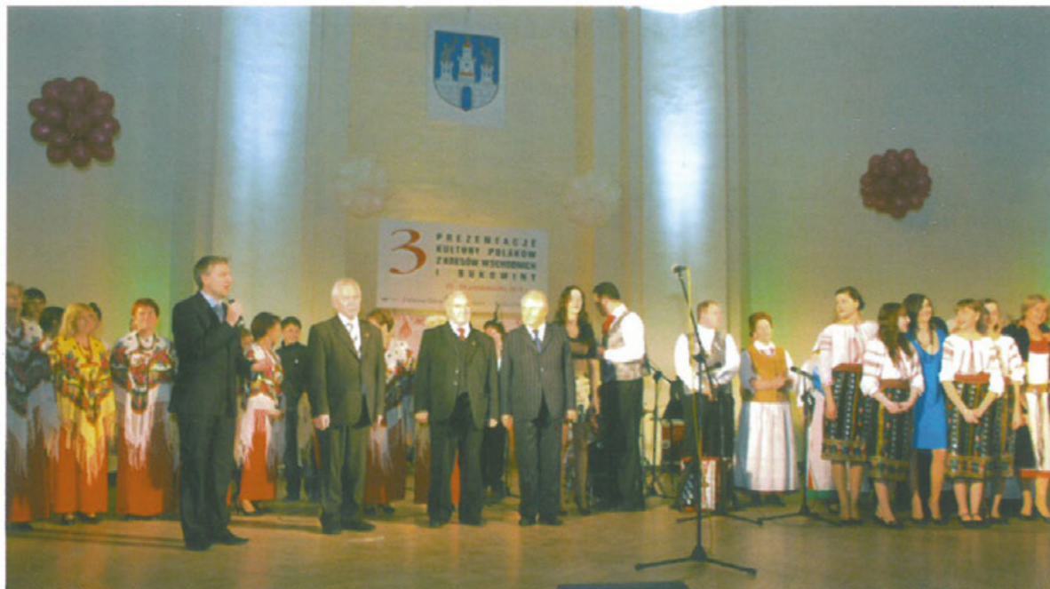
Prezentacja kultury Kresów i Bukowiny na terenie zamku kożuchowskiego w 2010 r.