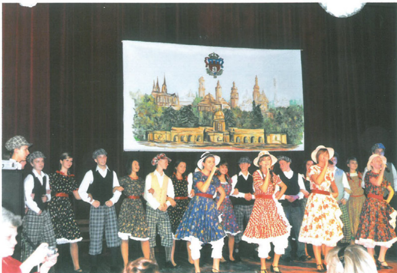
Wspólnie z Brzeskim Centrum Kultury, Muzeum Piastów Śląskich, Klubem Wojskowym, Publicznym Gimnazjum nr 3 im. Orłąt Lwowskich zorganizowaliśmy w ciągu ostatnich trzech lat Dni Kultury Kresowej w formie rozrywkowej lub sportowej, a także spotkania z pisarzami, redaktorami pism o tematyce kresowej.