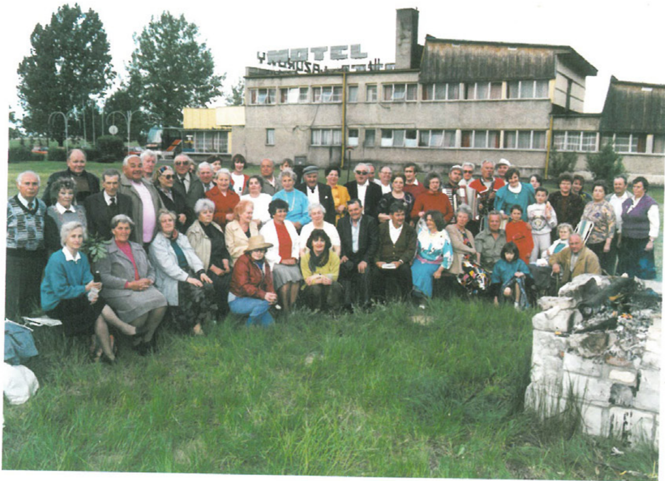
Uczestnicy spotkania majowego przy ognisku 21 V 1994 r.