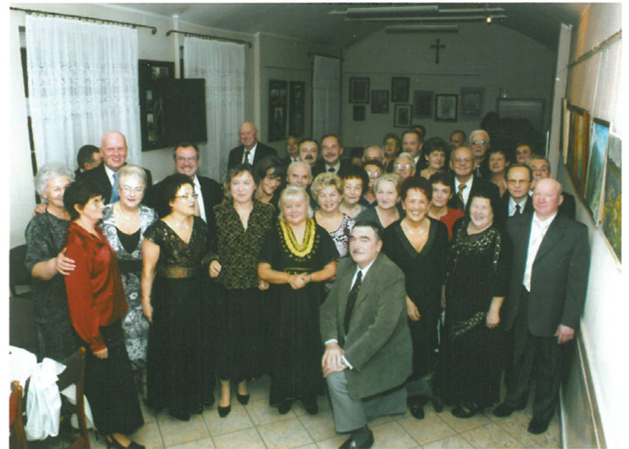
Zabawa karnawałowa w 1998 r.