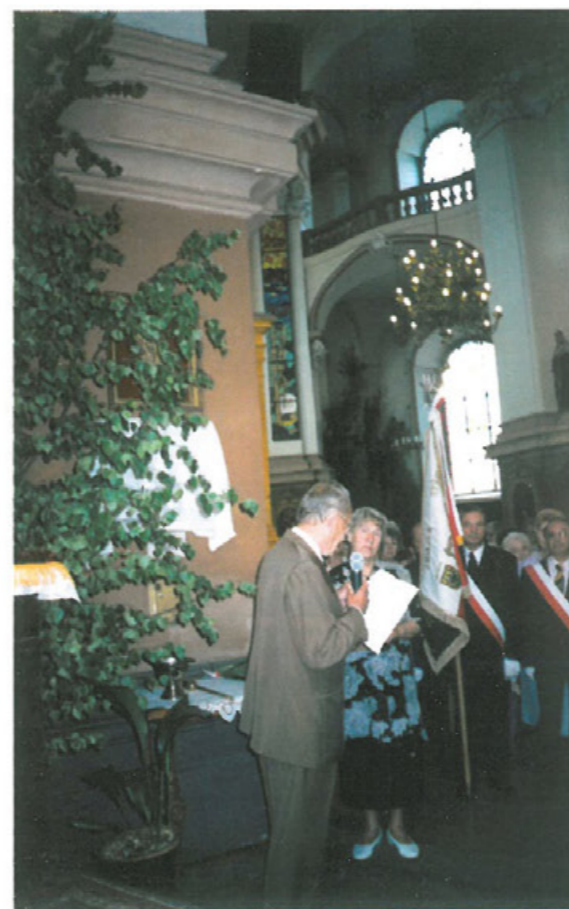
Podczas uroczystego odsłonięcia tablicy pamiątkowej w kościele św. Jana