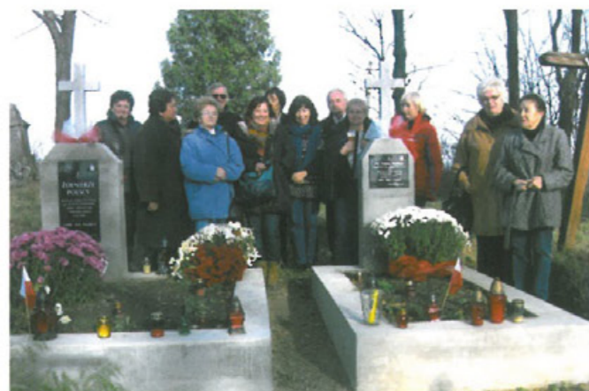
Oddział TMLiKPW w Tarnowie od lat 90. w Dniu Wszystkich Świętych przeprowadza na cmentarzach Tarnowa kwestę na ratowanie polskich grobów i miejsc pamięci narodowej we Lwowie i na Kresach Wsch.