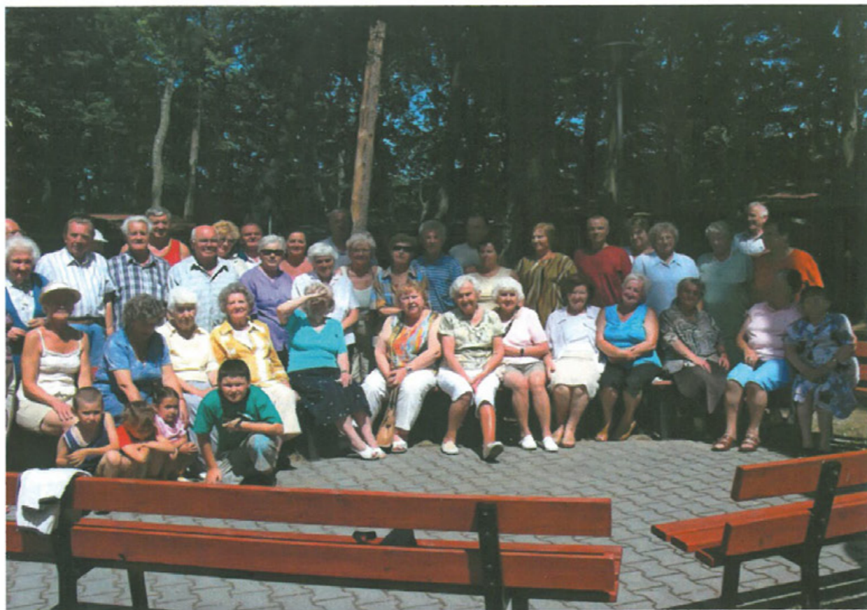
Zjazd Tłumaczan w Kołobrzegu, czerwiec 2008 r.