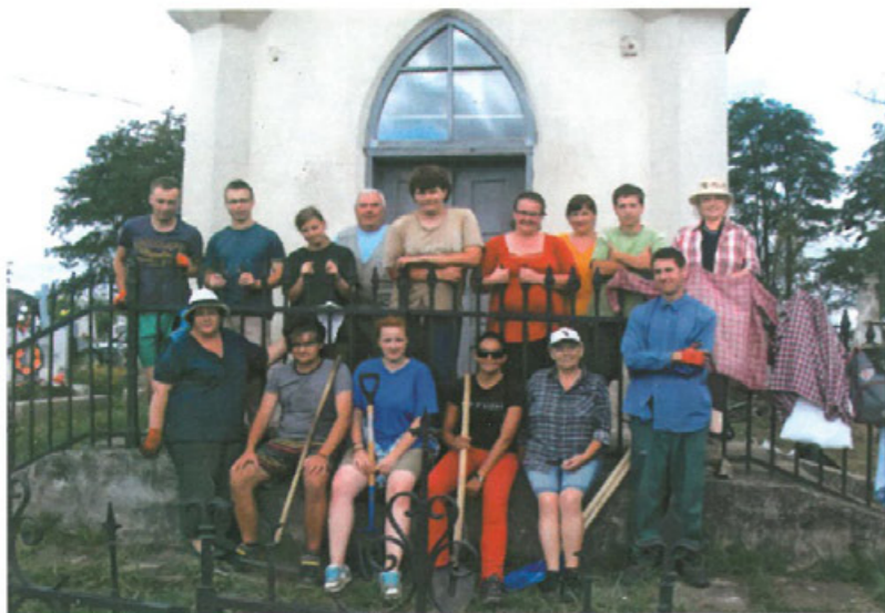
Na cmentarzu w Tłumaczu. Wolontariusze pracujący w ramach akcji „Mogilę pradziada ocal od zapomnienia”, lipiec 2012 r.