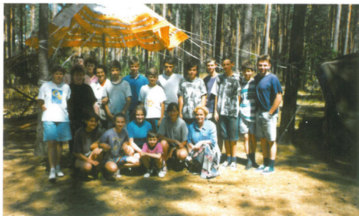
Drużyna harcerzy ze Szkoły nr 24 im. Marii Konopnickiej we Lwowie na obozie harcerskim w Borach Tucholskich w 1994 r.