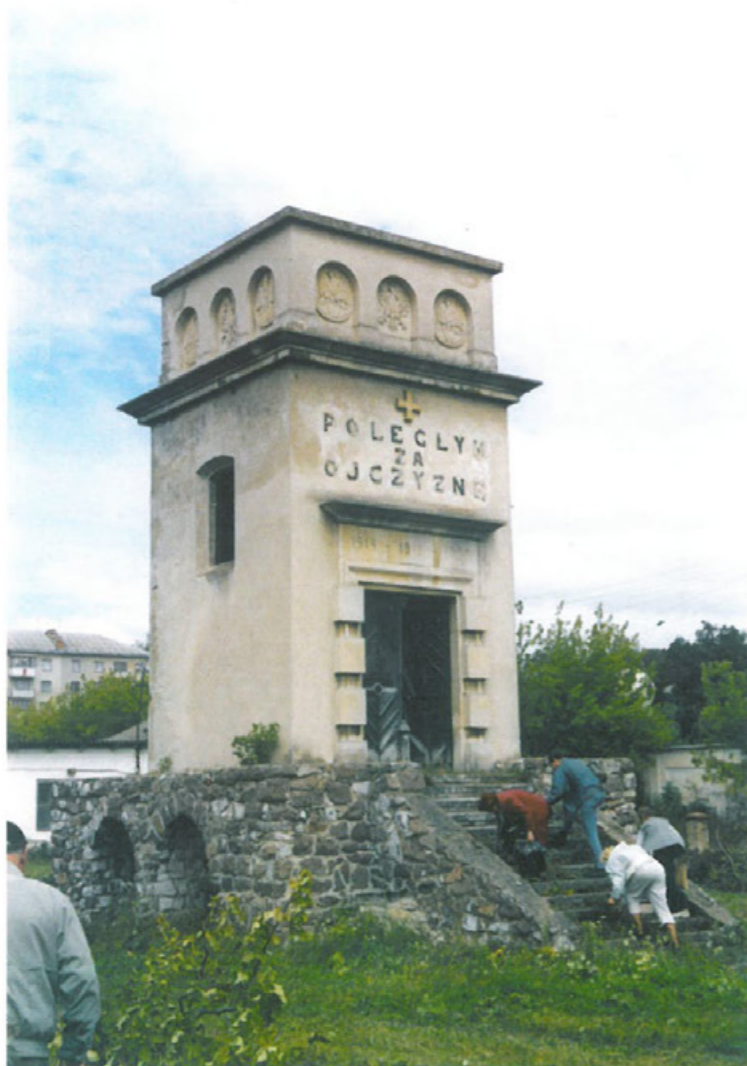
Zborów – porządkowanie Pomnika Chwały i Pamięci, 2005 r.