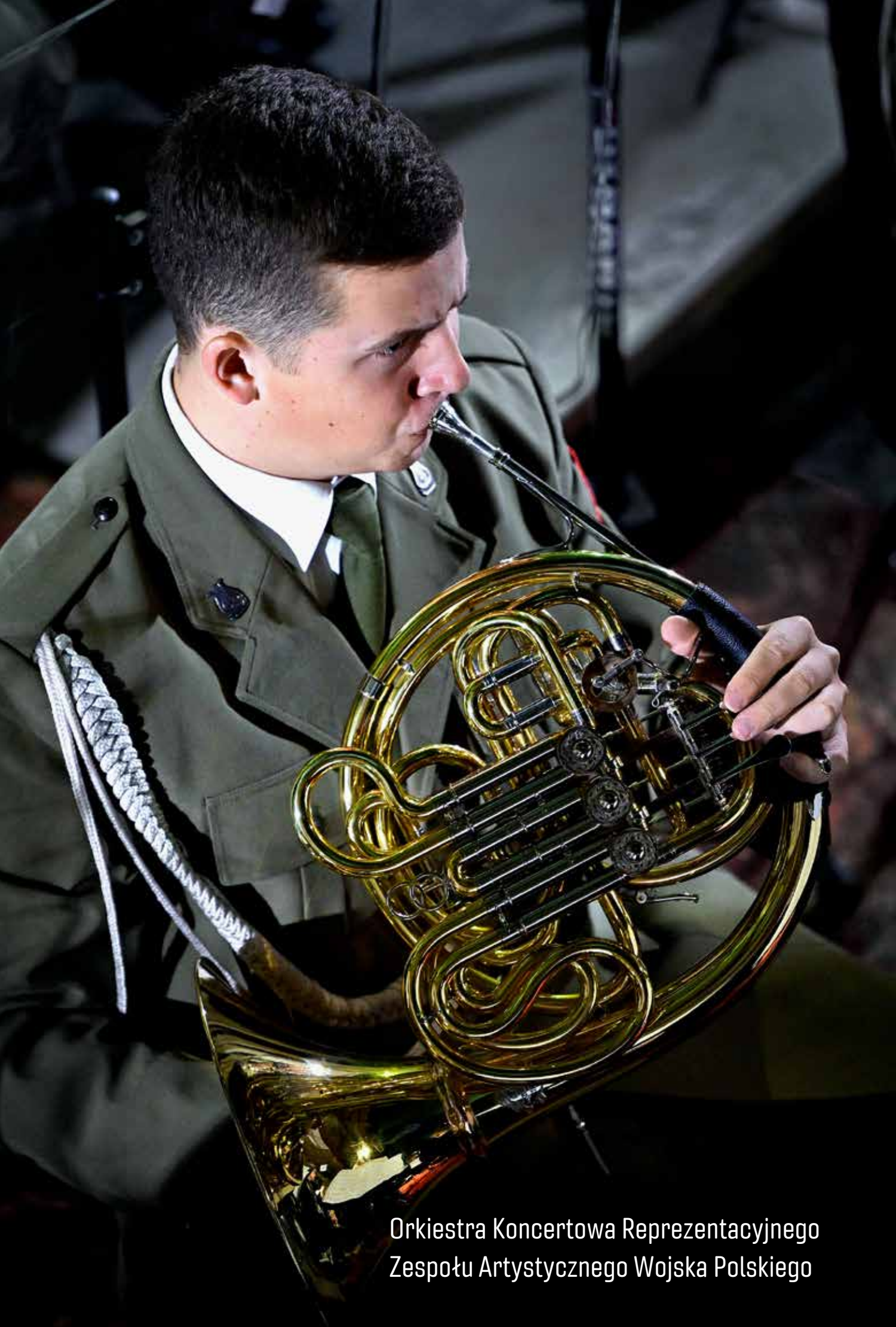
Orkiestra Koncertowa Reprezentacyjnego Zespołu Artystycznego Wojska Polskiego