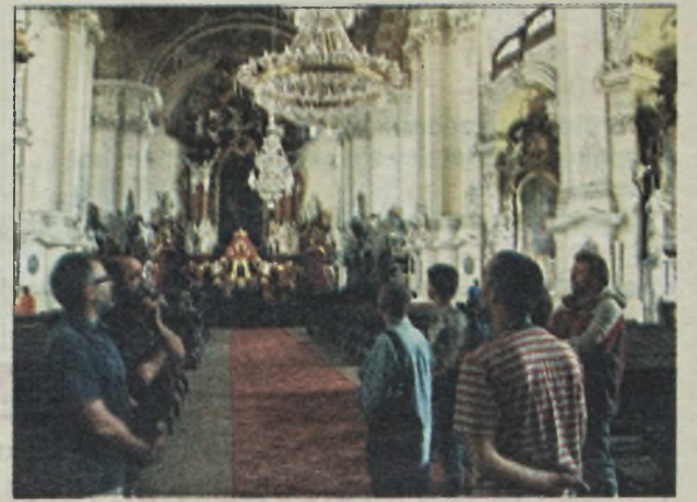
Kościół klasztorny w Opatctwie Krzeszów

Dawne miasteczko, obecnie wieś, którego początki sięgają XIII wieku, największy rozkwit przeżyło w XVII