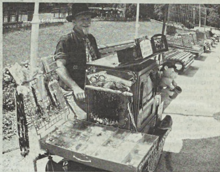
– Wrocław nie ma żadnych gadżetów, które kupowaliby turyści – mówi katarzyniarz

Turystyka stosowana międzynarodówki dysydentów