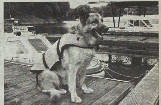
Pies Manko w specjalnej kamizelce do ratowania ludzi