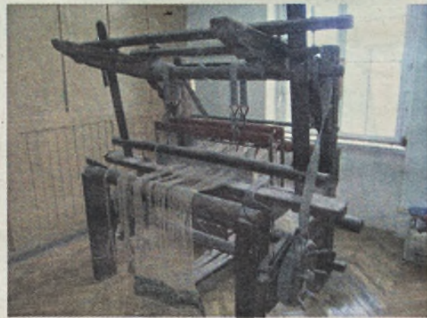
Oryginalne drewniane krosna tkackie w firmie Bo-wa-de w Kamiennej Górze

polichromie, zdobiące ściany i sklepienia kościoła, zostały wykonane przez Jerzego Wilhelma Neunhertza. Ołtarze, znajdujące się w nawach bocznych, wykonał Ignacy König i Józef Smišek, a obrazy namalował Antoni Scheffler. Ołtarz główny zdobi ogromny obraz pędzla Petera Brandla. Po wschodniej stronie kościoła znajduje się dobudowane w 1735 r. Mauzoleum Pia-