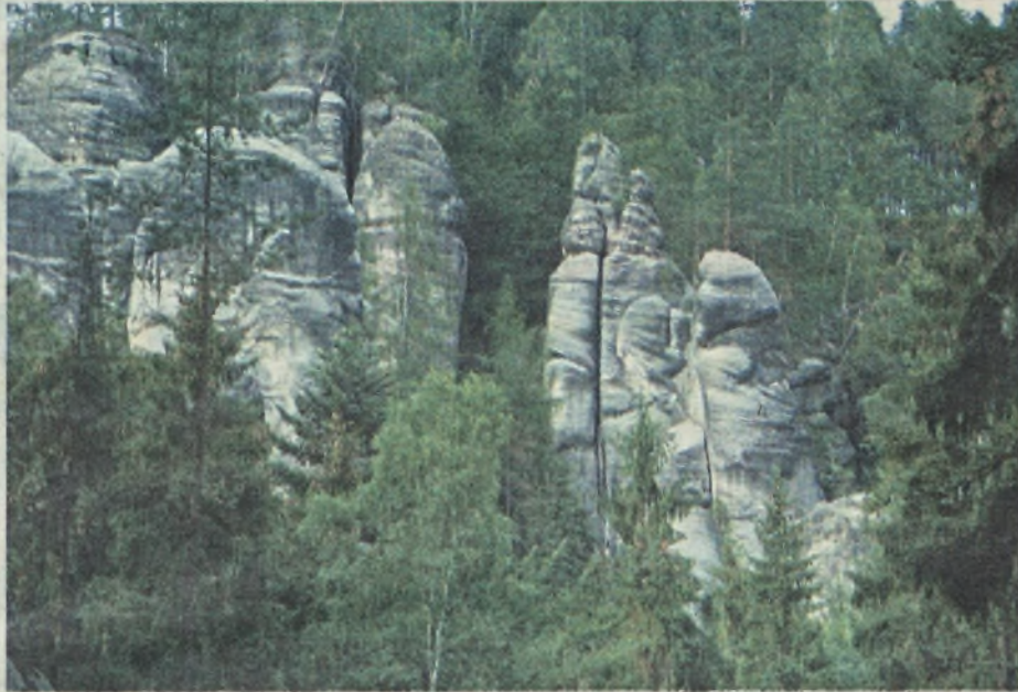
Skalne Miasto w Adršpach

Ziemia kamiennogórska jest bardzo zróżnicowana krajobrazowo, ma specyficzny klimat, typowy dla terenów górskich i podgórszych. Ceniona przez turystów, a szczególnie chętnie tu zaglądających gości z zachodniej Europy jest malownicza panorama górską, niezakłócona przez pięknie ułożone w dolinach miasteczka i wioski. Prawie cały teren powiatu znajduje się w dorzeczu Bobru - największego lewostronnego dopływu Odry. Na początkach XX wieku powstały sztuczny zbiornik w miejsco-