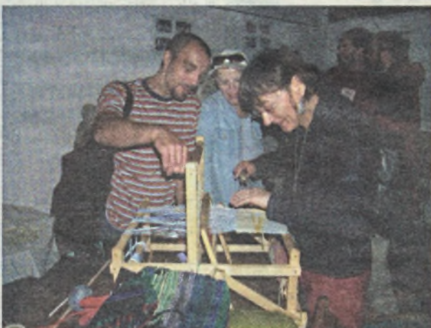
Domki tkaczy w Chełmsku Śląskim