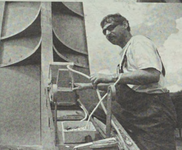
Tak wyglądał montaż jednego z dziewięciu reflektorów na Iglicy

Na każdym z trzech ramion konstrukcji zainstalowano po 3 reflektory. Dwa mniejsze mają moc 150 i 200 watów, największy halogen –