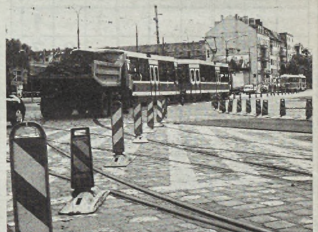
W pierwszych dniach remontu kierowcy mieli sporo kłopotu z przejechaniem placu Grunwaldzkiego.