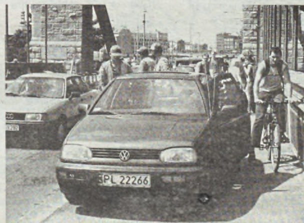
Auto popsuło się w korku na moście Grunwaldzkim. Na szczęście robotnicy pomogli kierowcy zepchnąć je z jezdni