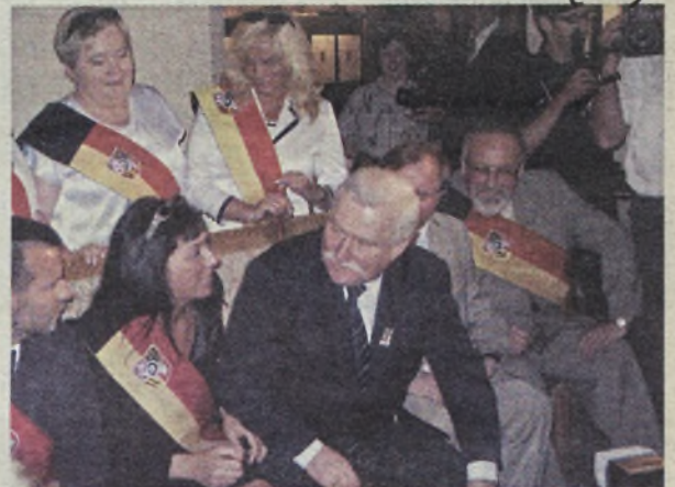
Lech Wałęsa chętnie pozował z radnymi naszego miasta

Podczas pierwszego dnia obchodów święta Wrocławia władze miejskie na czele z prezydentem Rafałem Dudkiewiczem uhonorowały jednego z najbardziej znanych współczesnych Polaków na świecie - Lecha Wałęsę - tytułem Honorowego Obywatela Miasta Wrocławia.