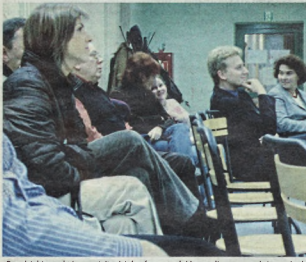
Przedsiębiorcy, którzy wzięli udział w forum zadawali pomoc w dożywianiu dzieci.