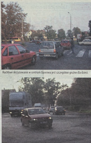
Ruchliwe skrzyżowanie w centrum Oporowa jest szczególnie groźne dla dzieci.

nie są to tylko subiektywne odczucia. Prognoza opracowana przez Instytut Telekomunikacji i Akustyki Politechniki Wrocławskiej wskazuje, że po rozbudowie lotniska Oporów i Muchobór Mały znajdą się w strefie poziomu hałasu od 45 do 50 decybeli, czyli na granicy dopuszczalnego hałasu dla osiedli mieszkaniowych.