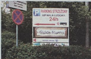
Miliosicy staroci nie będą mieli problemów z trafieniem na giełde