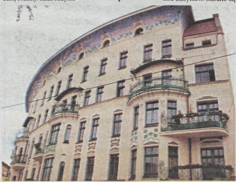
Tak prezentuje się teraz dom na rogu ulicy Prusa 5