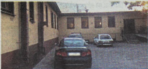
Do wrocławskiej izby wytrzeźwień trafia dzień kilkadziesiąt osób

Niedawno na wrocławskiej izbie wytrzeźwień zmarł młody mężczyzna. Miał 4 promile alkoholu we krwi. Bezpośrednie przyczyny zgonu ustala prokuratura. Wiadomo jednak, że przez 3 godziny nie zajmował się nim lekarz. Mimo że zmarły miał rozciętą tętnicę, a alkohol (według jednego ze źródeł) w jego krwi przekraczał dawkę śmiertelną. Czy jest sens utrzymywanie instytucji, której zadania śmiało mogą spełniać z lepszym skutkiem szpitale i komisariaty?