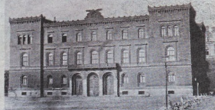
Tak przed wojną wyglądało Muzeum Rzemiosła Artystycznego i Starożytności na placu Wolności