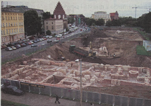
Ogólny widok na wykopaliska

Oprócz kul armatnich i grotów do strzał, archeolodzy na placu Wolności znajdują cizernki, grzebień i drewniane zabawki dla dzieci.