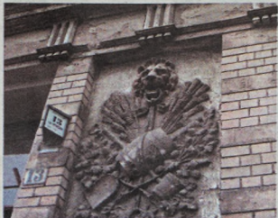
Takie interesujące detale można odkryć na fasadach wielu kamieniec

W ubiegłym roku gmina Wrocław rozpoczęła realizację programu odnowy starych kamieniec. Ma on poprawić stan techniczny i walory estetyczne domów z przełomu XIX i XX wieku, który często pozostawia wiele do życzenia.