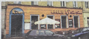
Kino „Lalka” przeszło przed kilku laty generalny remont

Większość obiektów została w ostatnim czasie zmierzdnowana, wyposażona w aparaty dolby stereo i przystosowana do potrzeb widzów niepełnosprawnych. Wygląda na to, że opary się inwazyj multiplexów i znalazły swoich niszowych odbiorców.