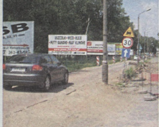
Tak wygląda teraz przejazd ulicą Karmelkową

Wielu mieszkańców osiedla było długo przeciwnych tej inwestycji. Obawiali się wzmódnionego ruchu przez ulicę Solskiego i spokojną do tej pory Aleję Piastów. Ostatnio jednak zdania w tej kwestii są bardziej zróżnicowane. Powstanie mostu pomogłoby nie tylko wjechać do centrum z omiędzianiem „wąskiego gardła” ulicy Grabińskiego, ale także sprawnie dostać się do południowo-wschodnich części Wrocławia – na Brochów czy Tarnogaj. Ewa Mastalska