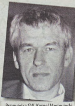
Przywódca SW, Kornel Morawiecki

Solidarność Walcząca to radykalny odłam „wielkiej” Solidarności. – Nie