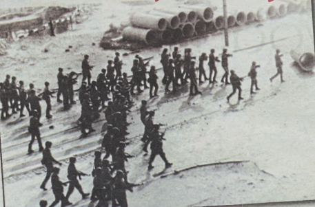
Do walki z demonstrantami wykorzystywano często oddziały Ludowego Wojska Polskiego

Wobec Boga i Ojczyzny przysięgam walczyć o wolną i niepodległą Rzeczpospolitą Solidarną, poświęcać swe siły, czas – a jeśli zajdzie potrzeba – swe życie dla zbudowania takiej Polski. Przysięgam walczyć o solidarność między ludźmi i narodami. Przysięgam rozwijać idee naszego Ruchu nie zdradzić go i sumiennie spełniać powierzone mi w nim zadania.