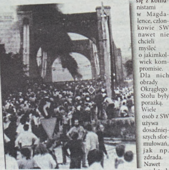
Członkowie Solidarności Walczącej tłumnie uczestniczyli w demonstracjach ulicznych, jak choćby na moście Grunwaldzkim

Inszenjacja wyglądała bardzo interesująco. Jednak trzeba pamiętać, że 25 lat temu demonstranci ryzykowali życiem podczas manifestacji. Zmechanizowane Odwoły Miliji Obywatelskiej często bardzo krwawo rozprędyli manifestantów. Tak było na wielu manifestacjach we Wrocławiu, gdzie Solidarność Walcząca miała