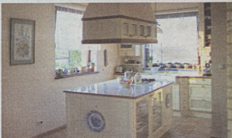
...lub tradycyjny w stylu angielskim.

średnio przed tynkowaniem należy cegły zmoczyć wodą. Zaprawę Tynkarską Atlas, o grubości warstwy od 2 do 10 mm, narzuca się kielnią dwuetapowo – najpierw wykonuje się obróbkę wstępna, następnie po jej związaniu, ale jeszcze przed stwardnieniem, wykonuje się narzuwierzchni. Chłonność powierzchni przed przyklejeniem płytek należy zredukować, stosując emulję Atlas Uni-Grunt. Do przyklejania okładziny ceramicznej może posłużyć Zaprawa Klejąca Atlas Mig i podobnie jak w wyżej opisanym przypadku, wąska Zaprawa do Fugowania Atlas i silikon.