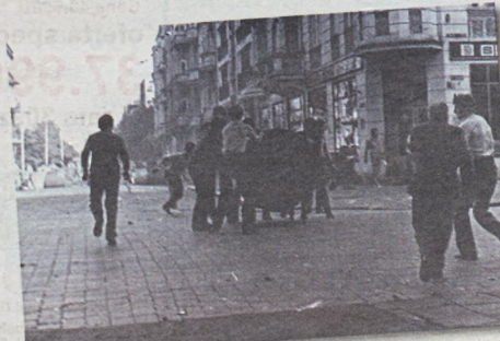
Niektóre demonstracje zmieniły się w prawdziwe bitwy. Tu, na ul. Perelca