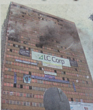
Pozar na pięcym piętrem Poltegoru.

Gasną światła, przestają działać windy, do pomieszczeń wdziera się duszący dym. Organizatorzy największych w Polsce ćwiczeń przeciwpożarowych pokazali, co się dzieje, gdy w budynku wybuchą pożar.