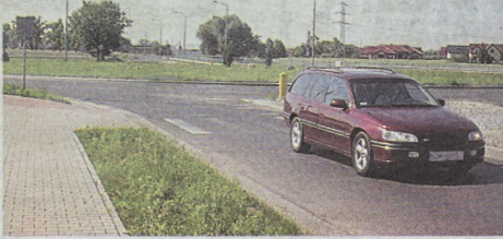
Rondo między Zienkimi Wrocławskimi a Iwiniami już powstało. Budowa reszty wschodniej obwodnicy Wrocławia stanęła pod znakiem zapytania