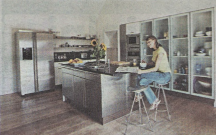
Wyspa może mieć różne style – nowoczesny, typu stal i szkło...