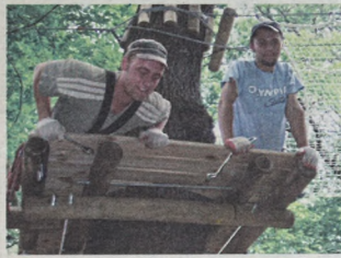
Pracownicy podczas montażu urządzeń zjazdowych

W tym miesiącu na wyspie Opatowickiej rusza park przygody. Na 90 drzewach zamontowano mostki, huśtawki tarzana i liny do pokonywania małpiego gaju.