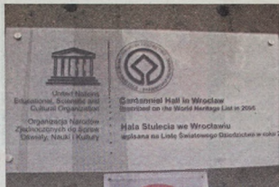
Tablica świadcząca o przyjęciu obiektu do klubu zabytków światowej Kłasy