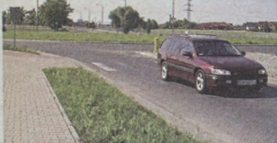
Rondo między Zenikami Wrocławskimi a winami już powstało. Budowa reszty wschodniej obwodnicy Wrocławia stanęła pod znakiem zapytania