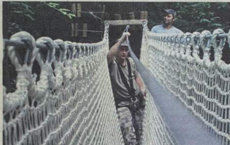
Tunel z lin wisi między drzewami kilka metrów nad ziemią