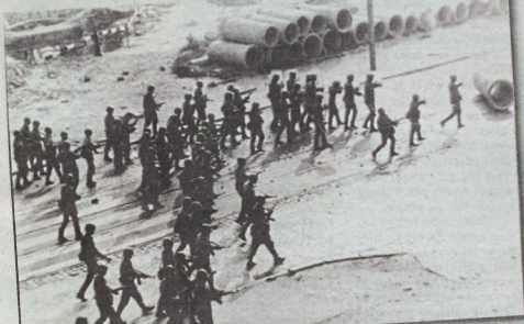
Do walki z demonstrantami wykorzystywano często oddziały Ludowego Wojska Polskiego

Wobec Boga i Ojczyzny przysięgam walczyć o wolną i niepodległą Rzeczpospolitą Solidarną, poświęcać swoją siłę, czas – a jeśli zajdzie potrzeba – swe życie dla zbudowania takiej Polski. Przysięgam walczyć o solidarność między ludźmi i narodami. Przysięgam rozwijać idee naszego Ruchu nie zdradzając go i sumiennie spełniać powierzone mi w nim zadania.