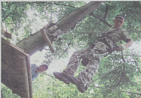
Przed udostępnieniem małpiego gaju stanowiska sprawdzają pracownicy