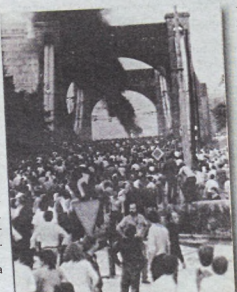
Członkowie Solidarności Walczącej tłumnie uczestniczyli w demonstracjach ulicznych, jak choćby na moście Grunwaldzkim

Obywatelskiej często bardzo krwawo rozprzeczali demonstrantów. Tak było na wielu manifestacjach we Wrocławiu, gdzie Solidarność Walcząca miała mnóstwo członków i zwolenników. Właśnie