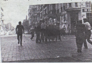
Niektóre demonstracje zmieniły się w prawdziwe bitwy. Tu, na ul. Perca

Sekretariat - zapisy: Wita Śwoszka 28, tel. 071/341 96 04 (naprzeciwko Galerii Dominikańskiej), www.cosinus.pl