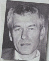
Przywódcą SW, Kornel Morawiecki

Kiedy liberalowie z obozu Lecha Wałęsy dogadywali się z komunistami w Magdalenice, członkowie SW nawet