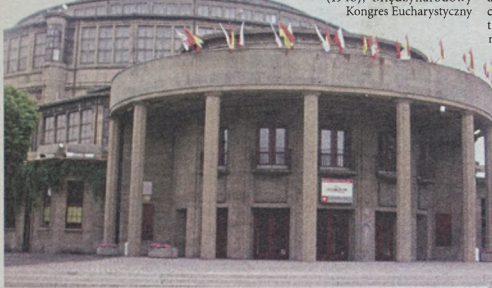
Hala to jedna z wizytówek stolicy Dolnego Śląska

zaprojektowana przez Maksę Berga jest pionierskim osiągnięciem architektury i inżynierii początku XX wieku. Jej konstrukcja nawiązuje do kościoła Hagia Sofia w Konstantynopolu, Panteonu i bazyliki św. Piotra w Rzymie, zawierając również wpływy sztuki egipskiej i babilońskiej.