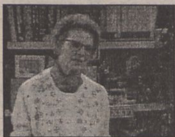
Serial kom. USA