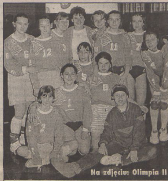
Na zdjęciu: Olimpia II

W najbliższą sobotę, 28 października br. Olimpia II podejmować będzie we własnej hali Astrę II Nowa Sól. Pierwszy mecz o godz. 12.