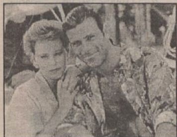
Serial sensacyjny produkcji kanadyjsko-izraelskiej (1992 r., 50 min.), reżyseria: Clay Boris, wykonawcy: ROB STEWART, CAROLYN DUNN, Ian Tracy, Ari Sorko-Ram i in.