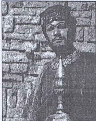
Film fab. prod. wł.-ameryk. (1965 r., 90 min.), reż. John Hu- ston, wyk. STEPHEN BOYD, Ava Gardner, Richard Harris i in.