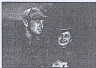
Film kryminalny prod. USA (1956 r., 81 min.), reż. Stanley Kubrick, wyk. STEARLING HA- YDEN, Colleen Gray, Vince Edwards