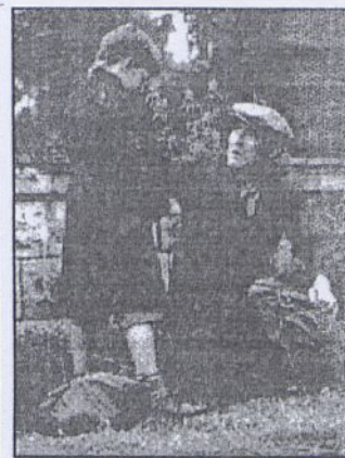
Film fab. prod. angielskiej (1993 r., 76 min.), reż. M. Why- te, wyk. C. HINDS, A. Root, K. Buffy i in.