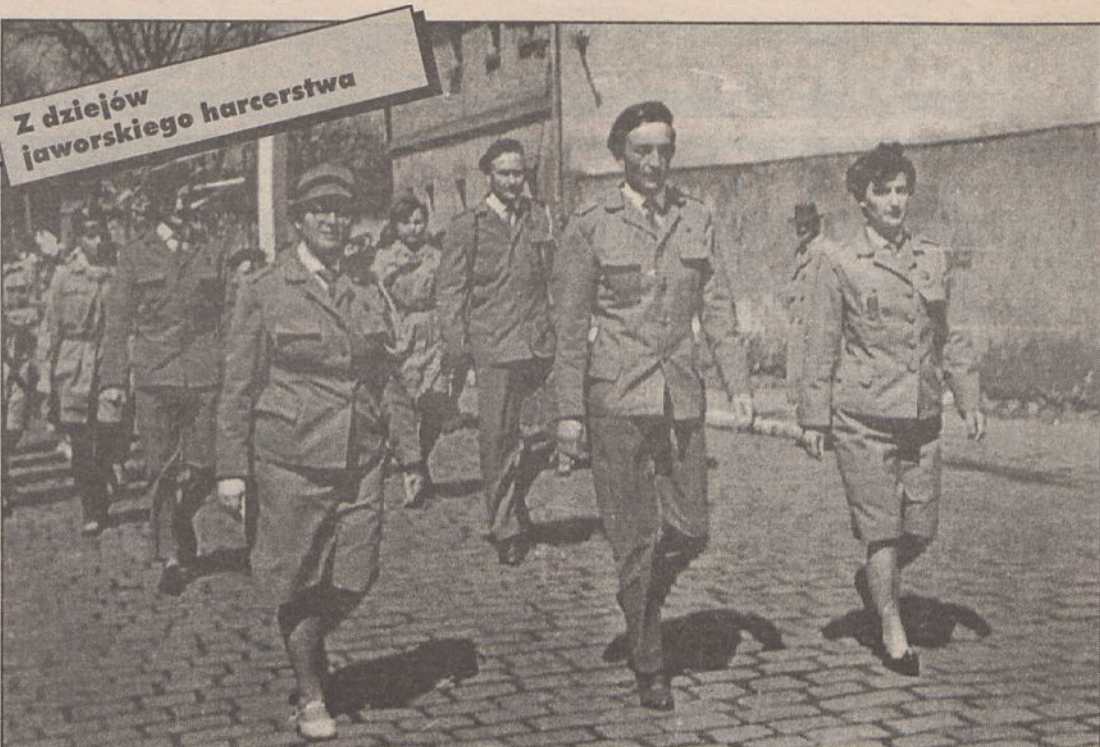
Jedna z pierwszych defilad harcerskich w Jaworze

Uwaga: Przyjmowane są zapisy dzieci w wieku 5 - 6 lat na kurs tańca towarzyskiego. Początek zajęć - 3 kwietnia, godz. 16, sala konferencyjna - "Parkowa". Zajęcia będą prowadzone nieodpłatnie. Ponadto nieodpłatnie prowadzone będą zajęcia dla dzieci w grupie tańca i ruchu. Początek zajęć ogłosimy w następnym numerze. Zapisy przyjmowane są w Jaworskim Ośrodku Kultury (Park Miejski), tel 70-36-48. Zapraszamy.