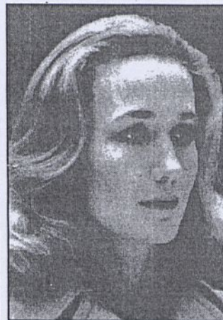
Serial francuski (1992 r., 52 min.), reż. N. Fossey, wyk. B. FOSSEY, P. Duchanssoy, F. Per- rin