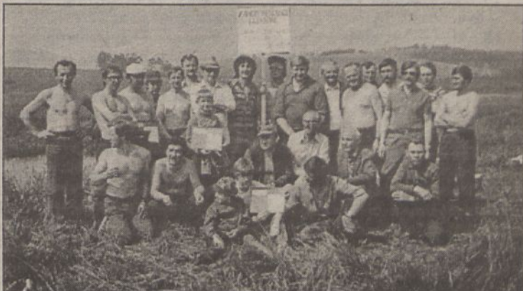
Uczestnicy zawodów o mistrzostwo Koła PZW w Jaworze