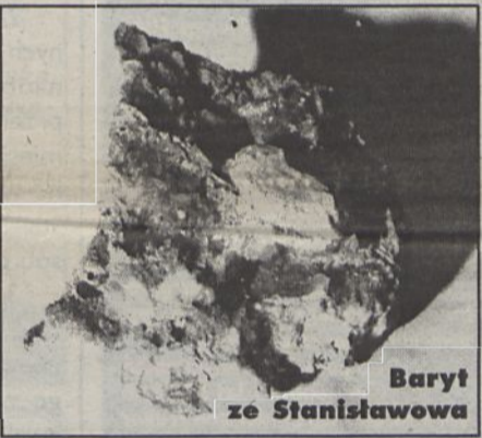
Baryt ze Stanisławowa