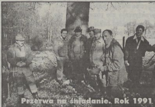
Przerwa na śniadanie. Rok 1991