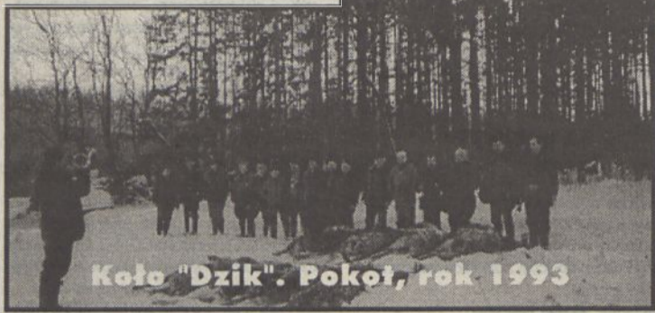
Koło "Dzik". Pokoń, rok 1993