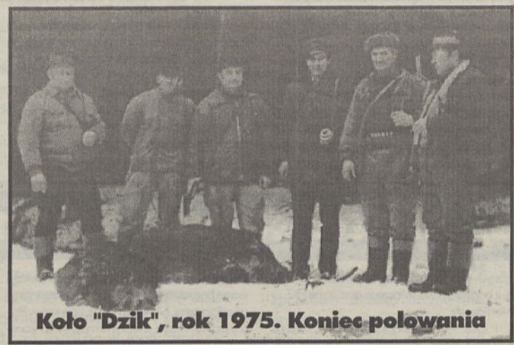
Koło "Dzik", rok 1975. Koniec polowania