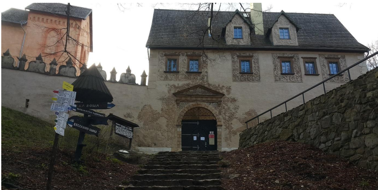
Zamek Grodno.

Zanim jednak dotrzemy do warowni musimy zaparkować nasz samochód w bezpiecznym miejscu. Na szczęście takie miejsce znajduje się przy ulicy Głównej oraz Kolejowej. Teraz czeka nas przyjemny, niezbyt długi spacer leśną drogą wznoszącą się coraz wyżej, która doprowadzi nas na wzgórze Choina mające wysokość 450 metrów n. p. m. Idziemy za znakami szlaku turystycznego koloru niebieskiego, zielonego i żółtego.