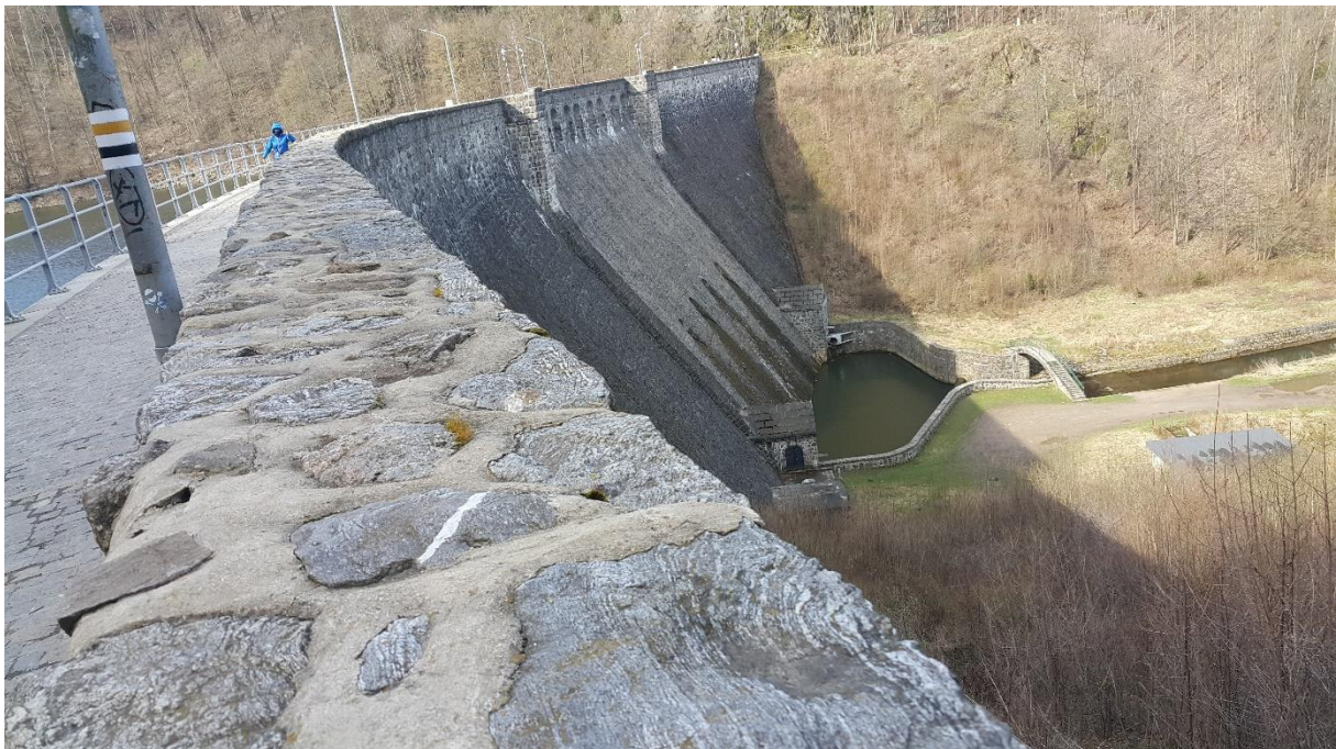
Tama na Bystrzycy.