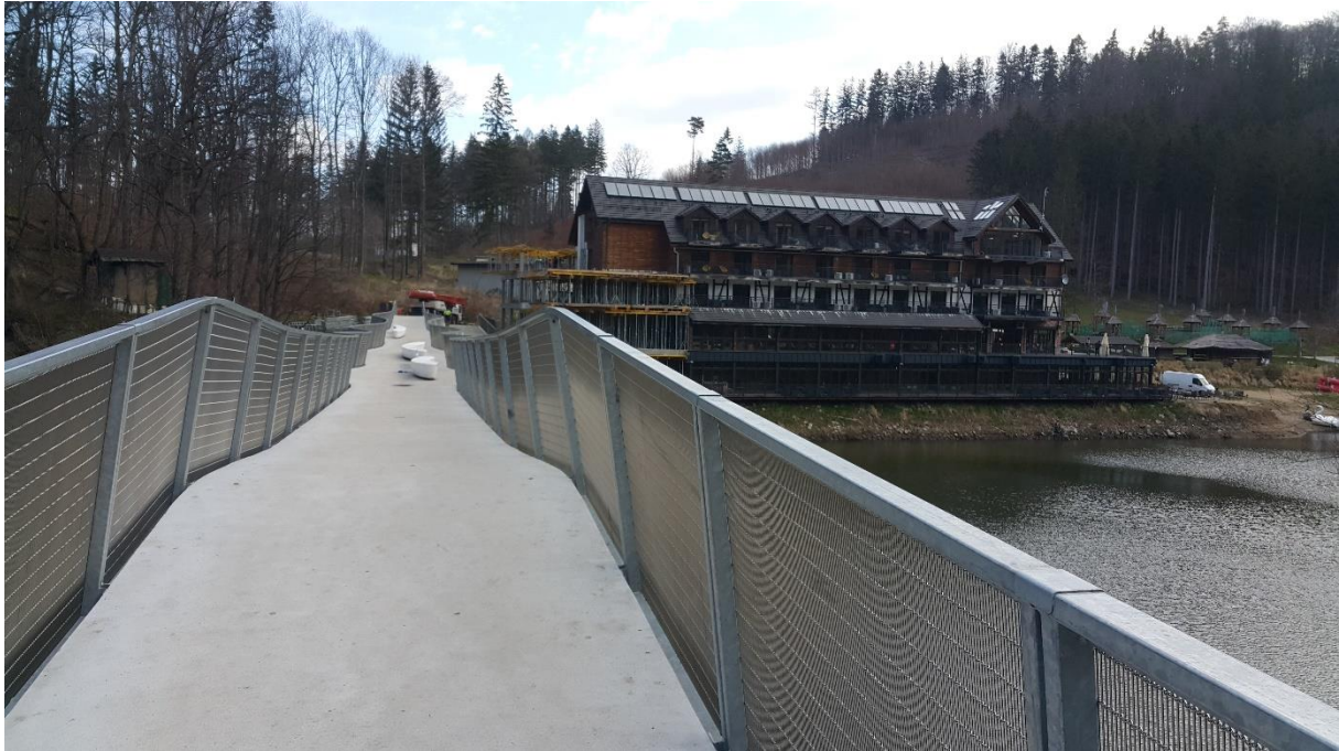
Nowa kładka nad Jeziorem Bystrzyckim.