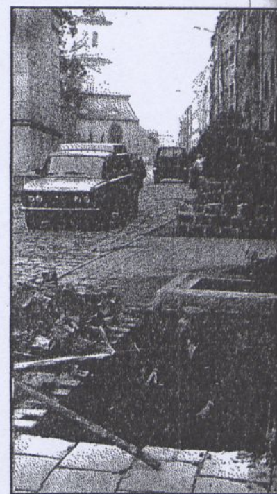
Trwają prace ziemne w Centrum Bolkowa. Zima za pasem, a końca ich nie widać.

Zdaniem naszym jest to duża przesada. Nie jest to odosobniony przypadek jego bezmyślności. Podobne przypadki informowania mieszkańców o podobnych akcjach spotkaliśmy również w innych sołectwach gminy Bolków. A co sądzą o tym służby p. Burmistrza?